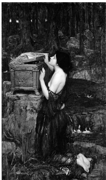
Дж. Уотерхаус: Пандора источник: https://commons.wikimedia.org/wiki/File: Pandora_-_John_William_Waterhouse.JPG