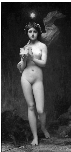
Ж. Лефевр: Пандора