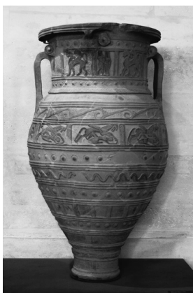
сосуд ( pithos ) с Крита, 675. до н. э.

риантов истории Пандоры, но наиболее влиятельным является рассказ греческого поэта Гесиода в поэме Труды и дни около 700 года до н. э. Гесиод описывает, как зло, предназначенное для распространения среди людей, хранилось в своеобразной чаше в виде закрытого керамического сосуда (греч. πίθος ). Как же тогда чаша превратилась в ящик, дошедший до нас в виде фразеологизма ящик Пандоры ? История Гесиода была взята, пересказана и переведена многими авторами, одним из которых был Эразм Роттердамский, который в XVI веке перевел ее на латинский язык. Предполагается, что именно он, переводя рассказ с греческого на латинский язык, заменил греческое слово πίθος / pythos , пифос / на πυξίς / pyxis , пиксис / и перевел его словом ящик .