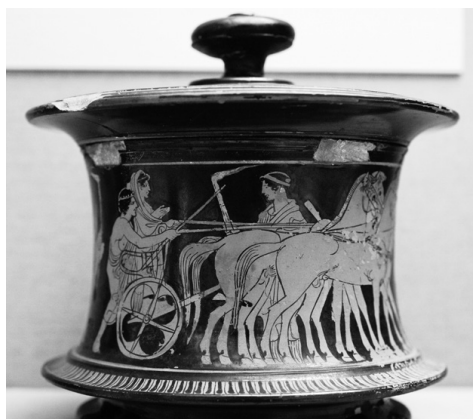
античная шкатулка ( pyxis), V. в. до н. э.

Но вернемся к греческой мифологии и истории Пандоры. Чтобы понять, как и почему появилась Пандора, мы должны вспомнить роль, которую сыграл титан Прометей в этой истории. Когда Прометей и его брат Эпиметей однажды слепили глиняные фигуры, богиня Афина взяла фигуры и вдохнула в них жизнь. Таким образом, фигуры Прометея стали людьми, а фигуры Эпиметея – животными. Стремясь к новому и более справедливому порядку среди богов, Прометей помогал Зевсу в борьбе с Кроносом, но вскоре после этого он стал противником олимпийских богов, которым не нравилось, что Прометей стал другом и благодетелем людей. Ведь Прометей чувствовал, что человек превосходит животных, он сочувствовал людям, которых он создал, и решил дать им огонь, чтобы облегчить им жизнь. Он тайно украл огонь с Олимпа и принес его людям. Это привело Зевса в ярость, и он решил наказать как Прометея, так и созданное им человечество.