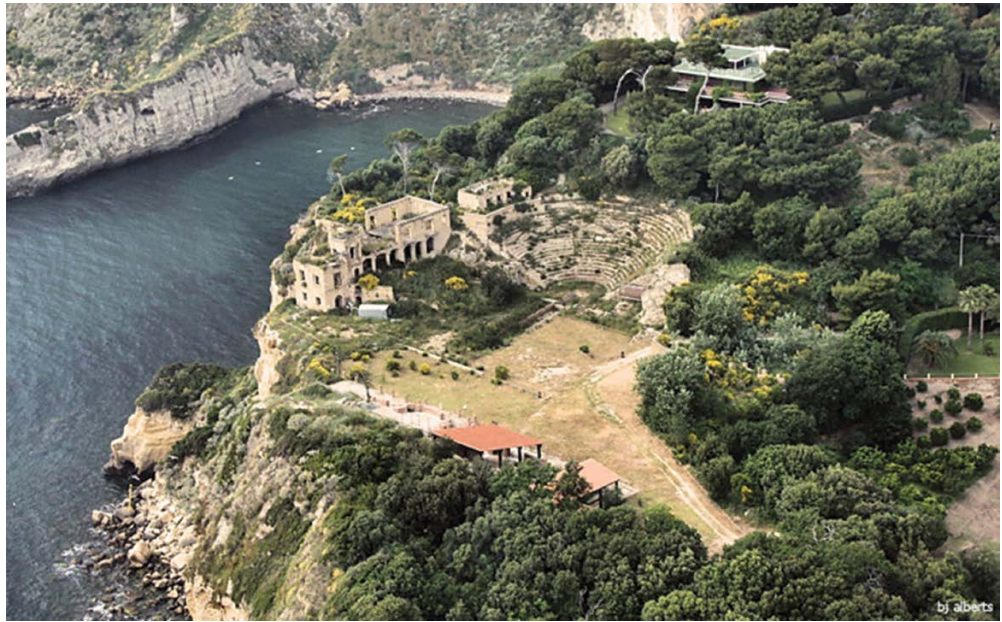
Slika 5. Pogled iz zraka na arheološki park Pozilip.

do, u Severovo doba početkom 3. stoljeća, zna ono što Ovidije, Seneka i Plinije ne spominju: "Takav je dakle Polion bio čovjek, koji je tada umro. Ostavio je velik dio nasljedstva mnogima, a Augustu mnoga imanja i Pozilip, mjesto koje se nalazi između Neapola i Puteola, zapovjedi da se ondje izgradi neko vrlo lijepo javno djelo. August pak njegovu kuću do temelja razori, pod izlikom gradnje neke druge njegove zgrade, ali da ovaj ne bi imao nikakav spomenik u gradu, izgradi trijem sa stupovima, ali na njega upiše Livijino a ne Polionovo ime". 29