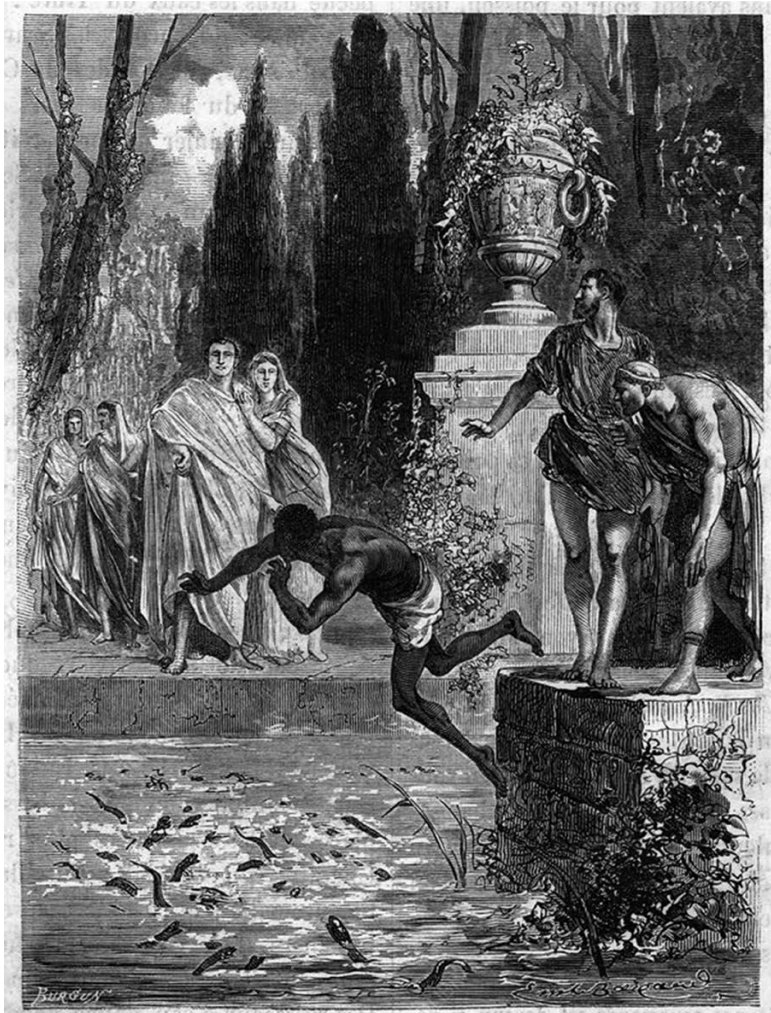
Slika 1. Rimski vitez Vedije Polion baca roba u bazen s murinama (preuzeto iz Louis Figuier, Les Merveilles de la Science , Paris 1869).

murine iznašao je prije svih Gaj Hir koji je za trijumfalne gozbe diktatora Cezara priložio 6000 murina u zajam; nije ih, naime, htio zamijeniti ni za kakav novac i ni za kakvu drugu nagradu 4 .