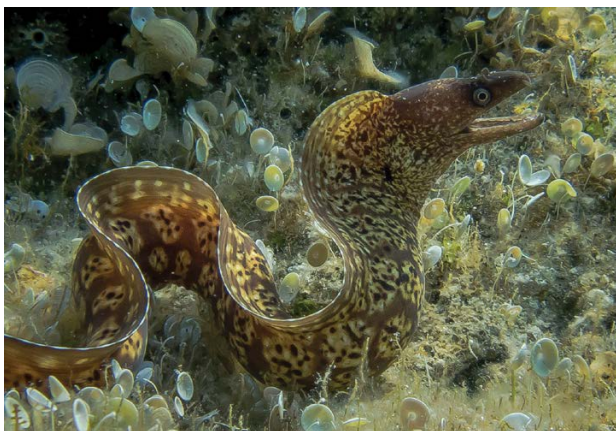
Slika 2. Murina.