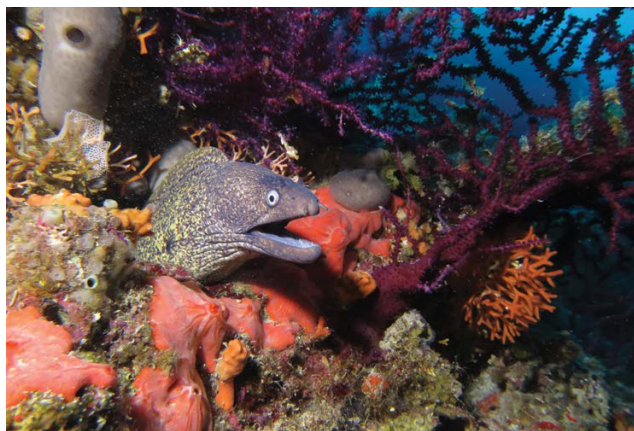
Slika 3. Murina.

je izbliza: Muraena helena , iz reda Anguilliformes , porodica Muraenidae , rod Muraena (Linn. 1758) je riba zmijolika tijela, boje tamne čokolade prošarane žućkastim i bjelkastim pjegama, dužine do 1,3 m – katkad i do 2 m, težine do 8 kg. Strahotnost velikoj ružnoj glavi daju zubi nalik pili. Živi u rupama i pukotinama morskih hridina, obično na dubinama između 5 i 50 m. Lovi noću. Postaje vrlo agresivna tek ako se osjeti ugroženom. Tada bolno i opasno grize, trgajući meso svojom čeljusti, koje okreće poput kosilice. Zbog strašna izgleda i zle čudi ona je par excellence legendarna riba. Sve je kod nje uvijek obavijeno misterijom – od priče da je muraina uvijek ženka i da izlazi na kopno da se pari sa zmijom koja riga otrov prije nego što će murinu oploditi. 11 Priče o murinama kolale su dugo kroz srednji vijek. U Starofrancuskom opisu Pule i Dubrovnika iz godine 1385. anonimni autor bilježi kako su murine opustošile obalu i otoke, a protiv njihove zle čudi kršćanstvo je našlo lijeka u paljenju svijeća po crkvama, jedinom utočištu od moći zlokobnih životinja. 12