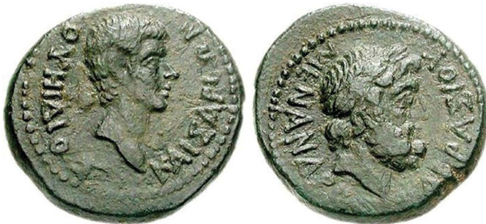
Slika 4. Novac Vedija Poliona kovan u Tralesu u Lidiji.

No, je li August bio baš toliko dirnut okrutnošću Vedijevom? Svetonije pripovijeda kako je jednom zarobljeniku, koji ga je molio za pristojan pokop, odgovorio da će se za to pobrinuti ptice, a ocu i sinu koji su ga molili da im pokloni život naredio je da kockom odrede koji će biti pomilovan, nakon čega je gledao kako izdišu oba. Naime, pošto je umro otac koji se sâm dao krvniku, sin je počinio samoubojstvo (Svetonije 1978: 65). Ovo baš nisu primjeri “meka srca” Augustova. No on je čovjek, rekosmo, s mnogo lica, pa i s priličnim razvojem ličnosti: istodobno “tolerant and impacable, ruthless and forgiving, brazen and tactful” (Garrett G. Fagan). Njegovo promptno djelovanje u Vedijevoj vili u Pozilipu dokaz je njegove ljudske crte, ali zacijelo i povrijeđenosti neodmjerenim bahaćenjem čovjeka koji mu je bio, unatoč svemu, prijatelj – blizak toliko da je smatrao da u nazočnosti imperatora može dječaka-roba osuditi na smrt, k tome takve vrste. Augustovu reakciju na Vedijev način kažnjavanja, kojim ga je zapravo htio impresionirati, M. B. Roller zacijelo ispravno karakterizira kao amicable reciprocity . 25