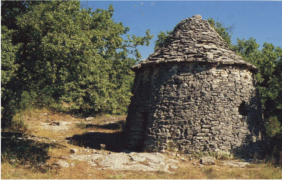
Slika 3. „Kažun“ u Provansi, Francuska

bunji, iako vidimo da je taj visoki zidić organski povezan s vanjskim plaštem bunje.