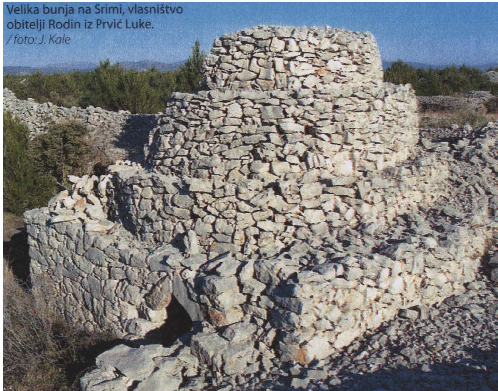
Slika 4. Bunja na Srimi, prema: Bodrožić et al. 2013.

mo za osmanlijsku opsadu grada Šibenika tijekom Kandijskog rata godine 1647., koja je trajala čak mjesec dana. Vojska, bila ona regularna pod vojnom disciplinom ili ne, ponaša se prema domaćem stanovnicima jednako: oduzimaju se zalihe hrane, prisilno se novače radno sposobni muškarci, zbog zastrašivanja se ljude terorizira. Zatim se pojavljuje glad i bolesti, a neishranjenost dovodi do pomora dojenčadi. Te su prilike zasigurno potaknule ljude na bijeg na obližnje otoke, pa tako i na Zlarin. Po dolasku je valjalo brzo iskrčiti zemlju i privesti je poljoprivredi. Usput su se prema starim običajima u nasipima kamenja načinile bunje kao što je npr. Rupica na Malpagi. Pronađena je čatrlja sa slatkom vodom koja se nalazi po prilici usred otoka, što je nužno za život. Čatrlja je velika jama u kamenu koja drži kišnicu te je kasnije djelomično ograđena.