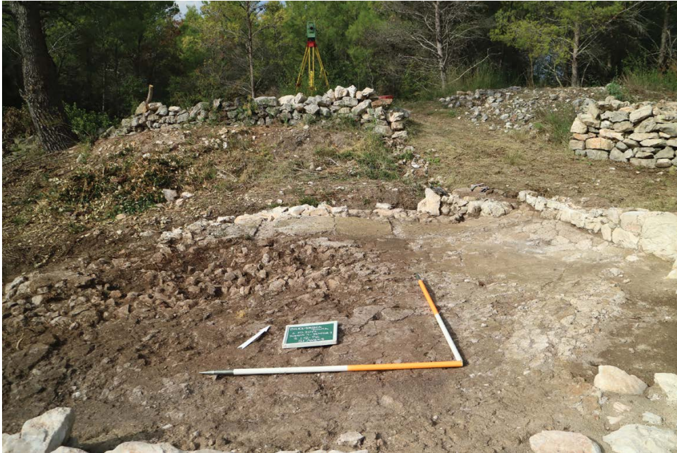
Slika 2. Bilice, Dedića punta, sjeveroistočna prigradnja, ostaci podnice

otuda donošeni u prezbiterij. S premještanjem prothesisu u novu prigradnju čin prijenosa mogao je dobiti više ceremonijalni karakter, jer je kretanje bilo nešto duže. Posebno zbog većeg utjecaja bizantske crkvene arhitekture i liturgije potkraj 6. st., moguće je i nastojanje oponašanja najvažnijeg dijela ranobizantske liturgije – Velikog ulaza.