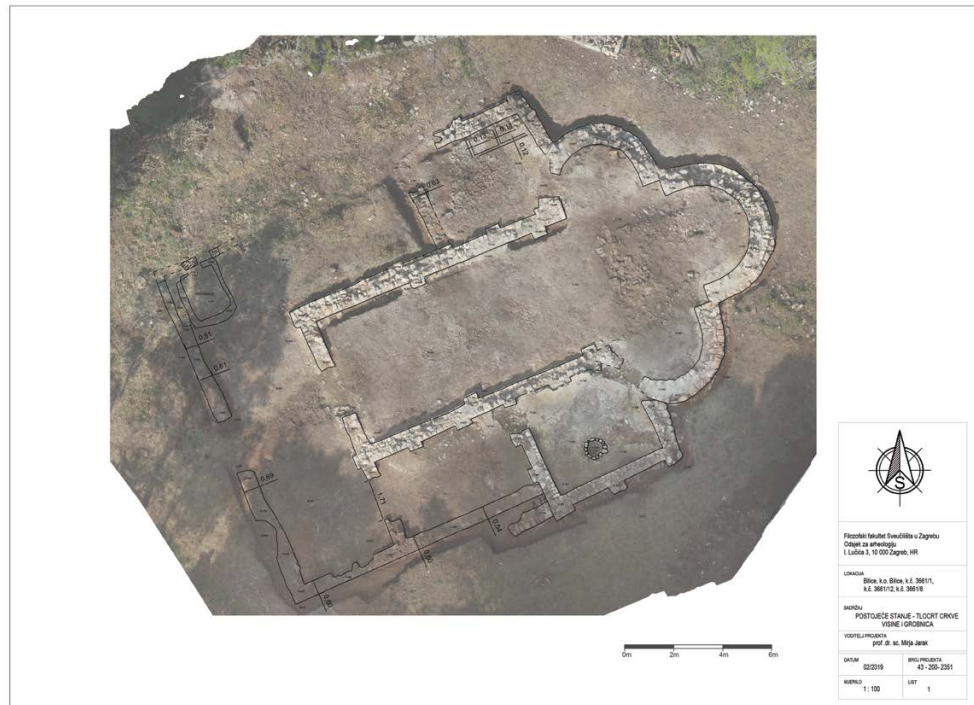
Slika 3. Bilice, Dedića punta, zračni snimak s ucrtanim položajem otiska u podnici sjeveroistočne prigradnje.

i ne utječe na interpretaciju namjene piscine (Gunjača 2005: 37). Za strukturu u Bilicama, unatoč nedostatku stepenica i nadzemnog dijela, teško je ponuditi neko drugo tumačenje osim krstioničkog zdenca. Po dimenzijama, dubini i promjeru, može se uvrstiti među manje ranokršćanske piscine, kao što je bila druga piscina u Srimi izgrađena iznad veće križne. Ta druga piscina u Srimi imala je kružni oblik i unutarnji promjer sličan promjeru biličke konstrukcije. Važno je napomenuti da se obje kružne piscine datiraju u sam kraj kasnoantičkog razdoblja, u kraj 6. ili ranije 7. st., te tako kasna datacija objašnjava njihove male dimenzije. Očito nastaju u vrijeme kada je došlo do promjene ritusa krštenja, te više nisu potrebni veliki bazeni u koje je osoba silazila i uranjala tijekom obreda (Jarak 2019: 46–47). Kasno vrijeme nastanka vjerojatno je razlog i drugim netipičnim elementima piscine u Bilicama.