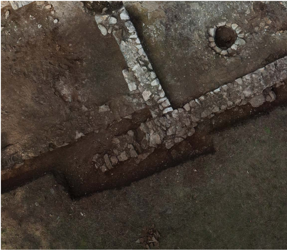
Slika 4. Bilice, Dedića punta, detalj arhitekture s ukopanom piscinom.

starijeg ukopa u toj grobnici metodom ^{14}\text{C} u kraj 6. st. govori dosta i o dataciji samoga narteksa, jer je grobnica svojim ulaznim dijelom povezana sa zidom narteksa i vjerojatno je građena u isto vrijeme s njim. Moguće da je izgradnja velike presvođene grobnice, kao i druge, nešto manje, u sjevernom uglu narteksa, zapravo potaknula izgradnju samoga narteksa, te je on uklopljen u plan druge faze crkvenog kompleksa, kada su izgrađene sve prigradene prostorije. Narteks ima izrazito sepulkralni karakter, pored sačuvanih grobnica, u njemu su bili i drugi grobovi, spomenuti u dokumentaciji s prvih arheoloških istraživanja početkom 20. st. Grobovi su tada otkriveni i u drugim dijelovima crkvenog kompleksa, osobito u brodu crkve, ali u revizijskim istraživanjima nisu pronađeni nikakvi tragovi tih ukopa. U sondi otvorenoj s južne strane kompleksa, također nije bilo tragova grobova, iako su se i u okolišu građevine nalazili brojni grobovi, zabilježeni tijekom prvih istraživanja lokaliteta.