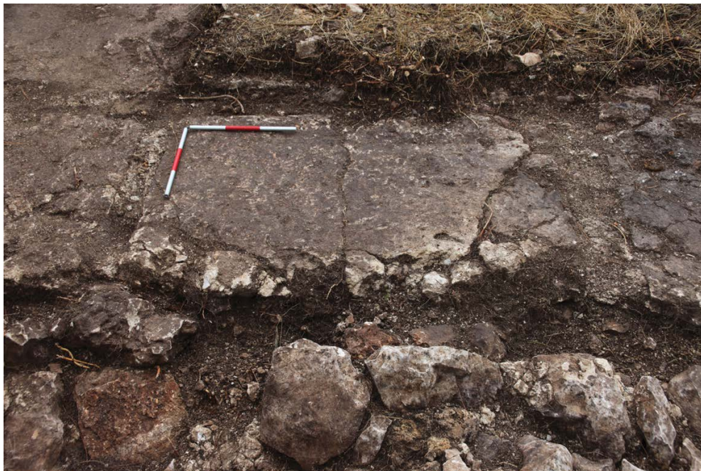
Slika 1. Bilice, Dedića punta, otisak u podnici sjeveroistočne prigradnje