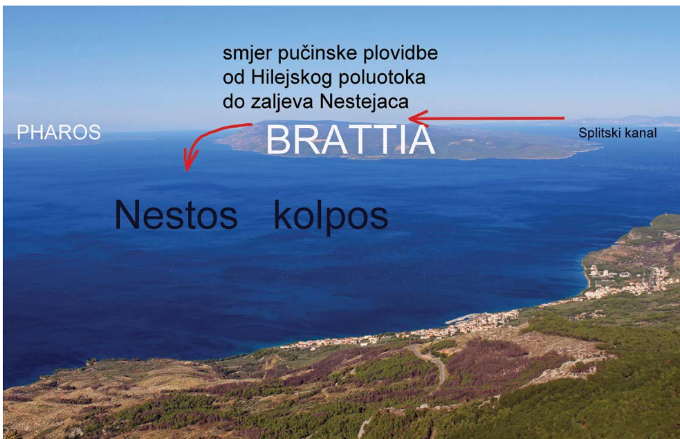
Slika 5. Pogled s planine Biokovo na Nestsos kolpos i otoke Hvar i Brač. Sasvim desno je Splitski kanal

se kroz Hvarski kanal između Brača i Hvara u (Nestsoski/Manijski) zaljev upravo u visini nestsoskih obala što se slaže s Pseudo-Skilakovom konstatacijom da zaljevska plovidba počinje tek od nestsoskih obala.