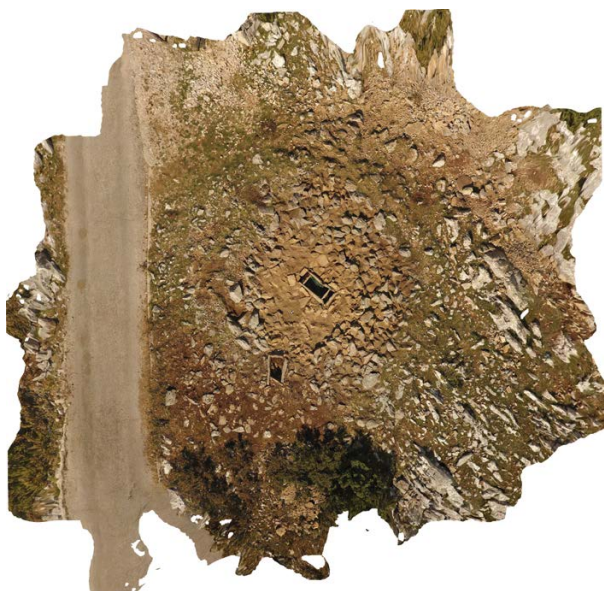
Slika 3. Tumul 1/2018 s dvije grobne škrinje, istražen na Podglogoviku na planini Biokovo

Naveo sam da nemamo pisana svjedočanstva o Nestejcima prije 4. st. pr. Kr. (a ni poslije). Ukopu u grobu 1 u tumulu 1 na Podglogoviku, na planini Biokovo, koji su Bekavac i Miletić istražili godine 2018., analizom kolagena metodom 14-C određena je starost od 3020 +/- 30 godina prije današnjeg datuma, odnosno kalibrirani datum pokazao je sa 72 % vjerojatnosti starost ukopa od 1322. do 1155. godine prije Krista, što prema klasičnoj kronologiji pada u razdoblje kasne bronce. Ukop 2 u istom tumulu izvršen je nešto ranije, 3157 +/- 40 godina prije današnjeg datuma, odnosno kalibrirani datum pokazao je s 84,3 % vjerojatnosti starost ukopa od 1505. do 1376. godine prije Krista, što prema klasičnoj kronologiji pada u razdoblje srednje bronce. Premda je etnogeneza Ilira još uvijek pretežno u sferi teoretskih modela, rekli bismo da je vrijeme migracijskih perturbacija povezanih s fenomenom takozvanih dorskih seoba znači sazrijevanje tijekom halštatskog razdoblja proto-etnija koje kasnije prepoznajemo pod imenima Liburni, Bulini, Nestejci, Iliri i drugim. Pretpostavljamo da su deseci tumula identificiranih na Podglogoviku, na planini Biokovu, pripadali zajednici nama još nepoznatog imena, a koju pola milenija kasnije, u vrijeme prvih opisa obala Jadrana, prepoznajemo pod etničkim imenom Nestejci. Kada vremenom budu provedene masovne kronološke C14 analize ukopa u tumulima na Podglogoviku i cijelom Biokovu, mogla bi ova teza biti učvršćena.