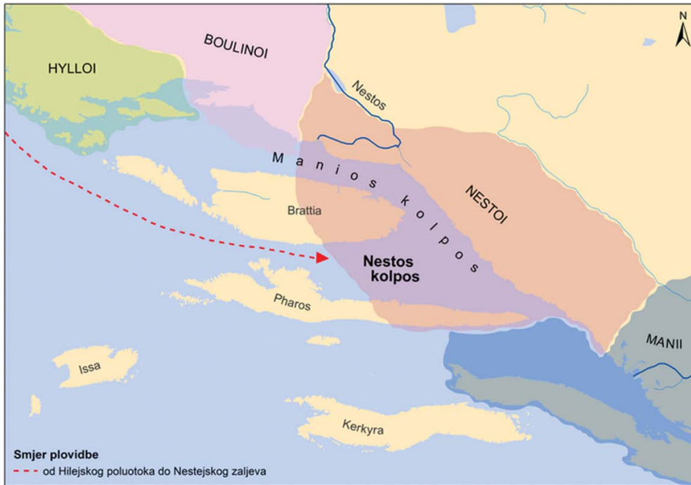
Slika 4. Smjer plovidbe vanjskom, pučinskom stranom otoka Šolte i Brača podrazumijeva da zaljevska plovidba počinje tek od Nestsoskog zaljeva (kartu izradila Dora Štublin).