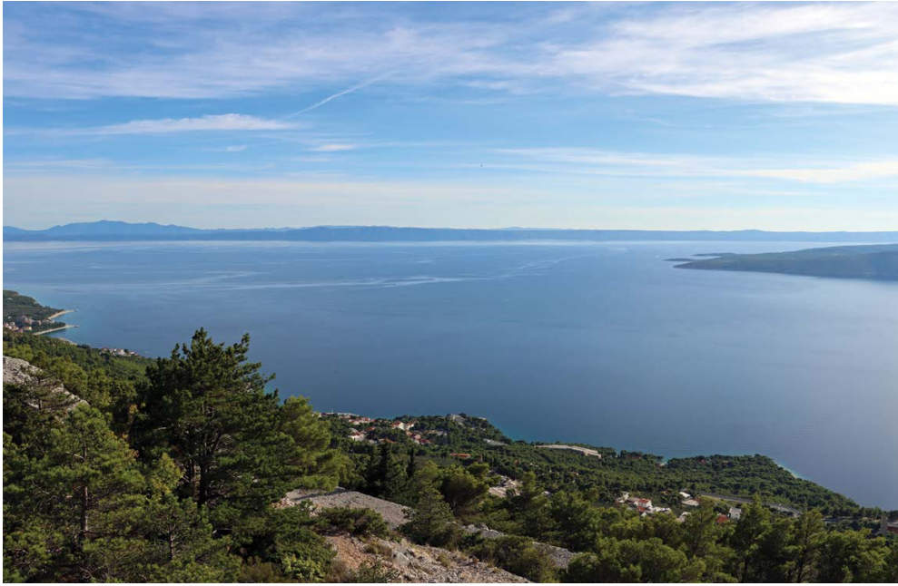
Slika 2. Nestos kolpos , danas Hvarski kanal, gledan s Biokova. Otok Hvar je straga, duž cijele slike, a Brač je na rubu desno.

prije 4. st. pr. Krista i da je tada bilo povezano sa širom grupom autohtonih zajednica na sjevernom Jadranu (Dzino 2014: 52–53).