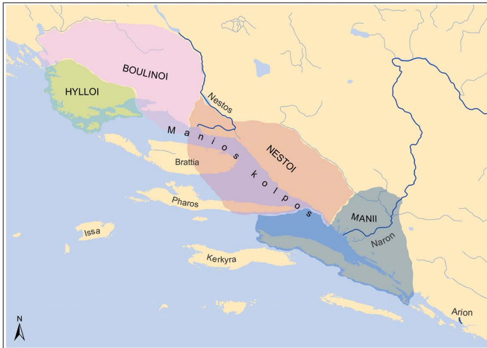
Slika 1. Etnije duž obale Dalmacije prema starijoj grčkoj geografskoj tradiciji (kartu izradila Dora Štublin)