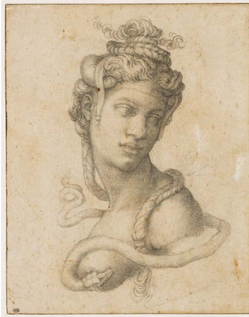
Slika 9. Julije Klović, Kleopatra (prema Michelangelu), Musée du Louvre

Lik starca ovdje je ključan. Prijatelj Pavičić u njemu vidi Saturna i to iznimno kvalitetno ikonografski obrazlaže. 71 Voelkle, na istom tragu, vidi „nude man (Vulcan?) in a verdant landscape“. 72 Cionini Visani, kako citira Prijatelj Pavičić tu je, pak, detektirala „naga čovjeka koji bježi od erupcije vulkana i starca koji stoji pored pećine i simbolizira riječno božanstvo“. 73