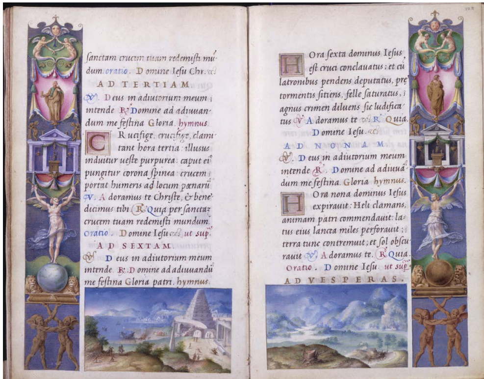
Slika 2. Julije Klović, Časoslov Farnese, fol. 104v i 105, The Morgan Library & Museum, New York

fol. 105., ona vidi sv. Pavla i krajolik s bregovima, dolinom s „nekakvim naseljem“ te likove koji s konjem putuju sred tih bregova. 25 William M. Voelkle, pak, u spomenutoj sceni ispod Mojsija vidi „toranj sličan kuli babilonskoj“, a tu sličnost povezuje sa susjednim krajolikom ispod sv. Pavla, kojem je u prvom planu panj iz poznatog opisa sna biblijskog Nabukodonozora (a koji također simbolizira Babilon), te sljedećom cjelostraničnom minijaturom, fol. 107., koja predstavlja izgradnju, opet, babilonske kule. 26