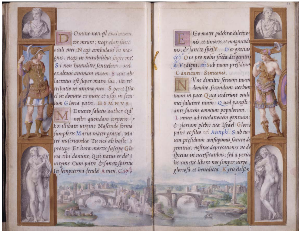
Slika 7. Julije Klović, Časoslov Farnese, fol. 50v i 51, The Morgan Library & Museum, New York

ovdje Klović oslikao početak bitke kod Akcija, zanimljivo je ovoj minijaturi potražiti i njen par (jer u Časoslovu je sve u paru) – finalni susret Oktavijana i Kleopatre u Aleksandriji. Minijature na fol. 50v i 51 moguće da upravo to i prikazuju. Ovog puta na suprotnim stranama stoje muška i ženska figura, dok se između njih nedvosmisleno nalazi Tiberijski otok u samom srcu Rima. Ispod njih nalaze se božanska bića a iznad njih biste rimskih vladara.