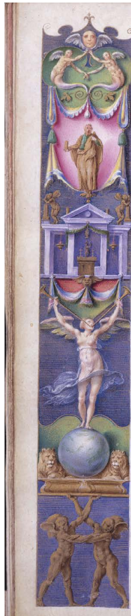
Slika 4. Julije Klović, Časoslov Farnese, fol. 104v (detalj lijevog obruba), The Morgan Library & Museum, New York

Uz obelisk, minijaturom dominira piramidalna struktura. Iako Prijatelj Pavičić i Voelkle pretpostavljaju da se radi o babilonskoj kuli, moja je pretpostavka da je posrijedi staroegipatska piramida. Više je razloga za to. Najprije, nije logično da bi na stranici posvećenoj starozavjetnom Egiptu, uz očite egipcijanizirajuće motive poput obeliska, Mojsija i horizonta s lavovima, a tek jednu minijaturu prije cjelostranične minijature s gradnjom babilonskog tornja (fol. 107), Klović ponovno slikao taj isti Babilon. Klovićeva piramidalna struktura ima oko sebe izgrađenu pješčanu rampu kojom se dolazi do gornjih etaža i koja se povija oko njene lijeve strane. Ovakvu rampu, koja je služila izgradnji Keopsove piramide u Gizi, detaljno opisuje Diodor Sicilski. U prvoj knjizi svoje Biblioteke on piše: „Priča se da je kamen donesen iz velike daljine, iz Arabije, a da je gradnja uspjela zahvaljujući nasipima, budući da dizalice tada još nisu bile izmišljene. Najzanimljivije u toj priči je to što se oko tih građevina, iako su tako velike, nalazi tek pijesak. Nema traga ni nasipu niti kamenim ukrasima, tako da ne djeluju kao da su ih polako radile ljudske ruke, već kao iznenadne tvorvine nekog boga koji ih je odvažno položio u okolni pijesak. Neki Egipćani u njima vide čudo, govoreći kako ih je, unatoč tome što su nasipi bili izgrađeni od soli i salitre, otopila pripuštena rijeka i u potpunosti zbrisala bez pomoći ljudskih ruku“. 32