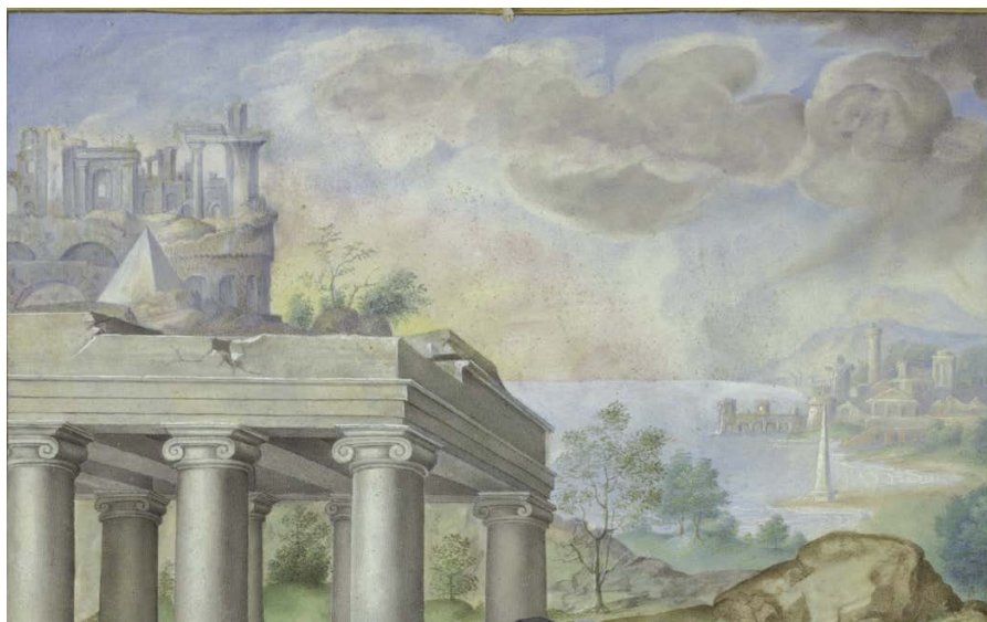
Slika 11. Julije Klović, Propovjed na gori (detalj), Lekcionar Townley, 1550.

Do danas se također vodi žustra debata je li i stranica Misala Collona , inače obilata drevnoegipatskim rebusima i simbolima, a koja je nastala nekoliko godina prije Časoslova Farnese (1532–1539), djelo (i) Klovićevih ruku. 82 Bez obzira na debate, djelo je pod njegovim imenom izloženo 2012. u Klovićevim dvorima na izložbi Julije Klović: najveći minijaturist renesanse . 83