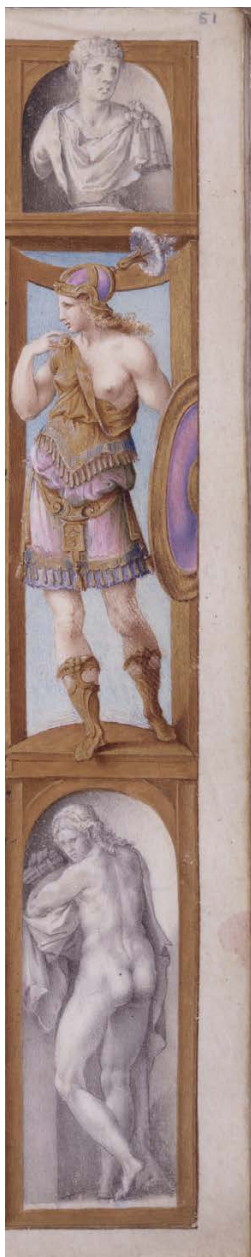
Slika 8. Julije Klović, Časoslov Farnese, fol. 51 (detalj desnog obruba), The Morgan Library&Museum, New York

Njemu s desne strane parira Kleopatra, ogoljene dojke, koja desnom rukom dodiruje svoje rame evocirajući tada toliko omiljeni kip belvederske Kleopatre, kasnije prozване Arijadna, koju je pribavio i u fontanu prepravio papa Julije II., a posebno naklonjenu (i iznimno popularnu) pjesmu spjevao Baldasare Castiglione. 65 Njezin bi, onda, božanski predak na dnu same desne minijature bio Dioniz, izravno povezan i s Markom Antonijem. 66 Posebno je zanimljivo zašto je Klović Dioniza naslikao baš sa sviralom. Podsjetnik je to i na podatak da, u kontekstu Kleopatrinih predaka, njezin otac Ptolemej XII. ima nadimak auletes / frulaš . 67