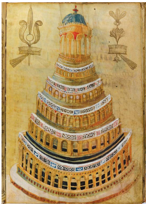
Slika 5. Piramida u The North Italian Album, 1500., Sir John Soane's Museum, London