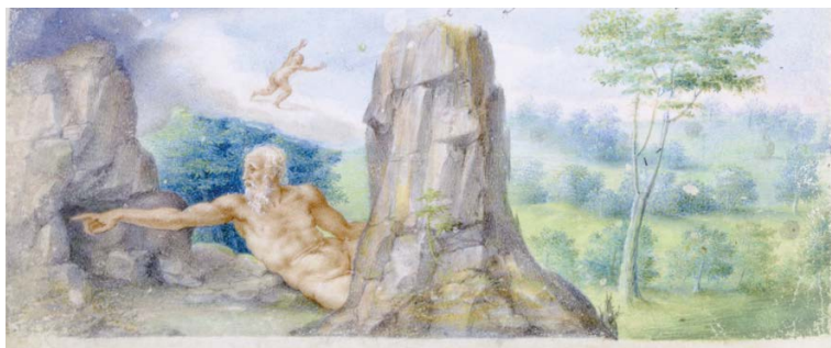
Slika 10. Julije Klović, Časoslov Farnese, fol. 32v, The Morgan Library&Museum, New York

egipatskom kralju. Kako je zbog građanskog rata čak i rijeka prestala poplavljivati te je uslijedila glad, proročište je savjetovalo kralja da žrtvuje svoju kćer kako bi umirio bogove. Odmah po krvavoj žrtvi kralj se od užasa bacio u rijeku Melas, koja se od tada po njemu zove Aegyptus . Potom je, zaključuje Pseudo-Plutarh, nazvana Nilom. 78 Isti kraj opisuju i Plinije i Seneka, pišući o ekspediciji Neronovih pretorijanaca u potrazi za izvorom Nila. 79