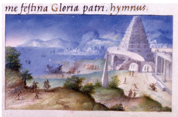
Slika 3. Julije Klović, Časoslov Farnese, fol. 104v (detalj vinjete), The Morgan Library&Museum, New York

anđela – već o sfinji, stilski sličnoj onoj pronađenoj na freski Neronove Domus aurea , koja se danas čuva u British Museumu. 28 Ispod sfinge u hramu vidimo krilatu božicu s trubljama, Famu, koja pak stoji na kugli koju pridržavaju dva lava. Ta dva lava, koja se pojavljuju i na fol. 105, iznimno su važna za ubikaciju mjesta radnje donje minijature. Lavovi koji na svojim leđima pridržavaju kuglu/disk/Sunce izravno su preuzeti iz staroegipatskog pisma. Hijeroglifski znak za sunce koje počiva na horizontu, oslonjeno na leđa dva lava koji gledaju u dvije strane svijeta (istok i zapad), staroegipatska je riječ akhet i označava horizont. 29 Ovdje postaje jasno da Klović inspiraciju pronalazi kod Horapolona, najvjerojatnije u francuskom ilustriranom i tiskanom izdanju iz godine 1545. Ta ilustrirana Hieroglyphica riječ „hrabrost“ (XVII) ilustrira crtežom dva lava koja drže horizont na leđima te navodi kako Egipćani: „kad označavaju hrabrost, prikazuju lava, budući da ima veliku glavu, vatrene oči i okruglo lice, te obiluje dlakama koje nalikuju sunčanima. Zato smještaju lava pod Horusov tron, naznačujući povezanost te životinje s bogom. Sunce također zovu Horusom, jer vlada satima“. 30 Ako je Klović oslikavao Farneseov časoslov sukcesivno, spomenuti je fol. 104v morao biti izrađen na samom kraju rada pa se time izvrsno vremenski podudara s objavom ilustriranog Horapolona. Mjesto radnje fol. 104v je, dakle, nedvojbeno Egipat.