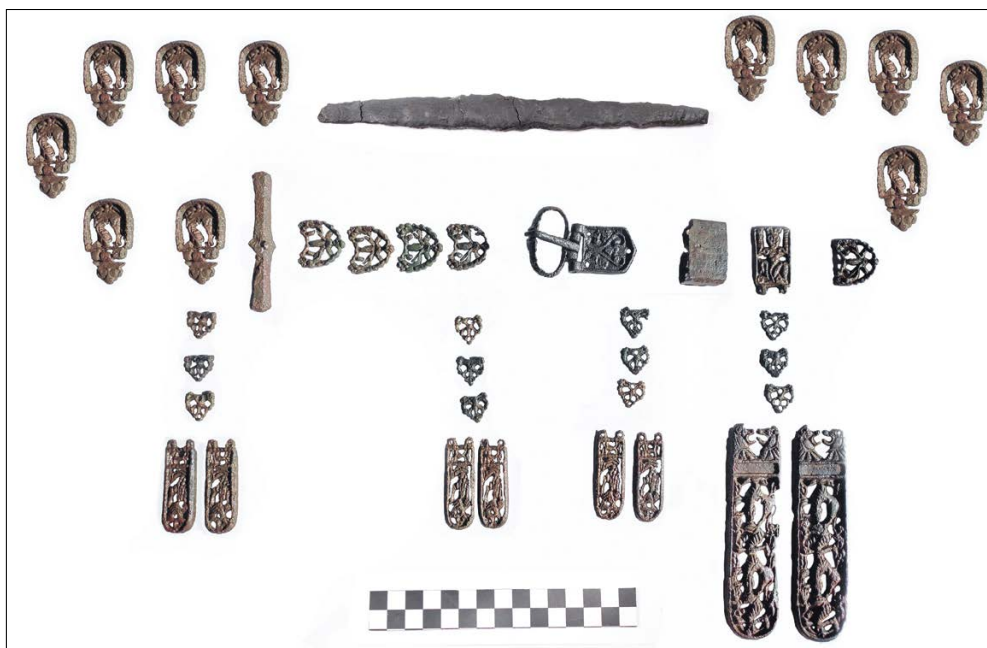
Slika 1. Pojasna garnitura sa cirkuskom scenom, G216, Privlaka-Gole njive (Šmalcelj Novaković 2020, Fig. 4)

1992: 145–7, 152, T. 58–73, Garam 2002: 29–31, 49–51, 57–65). Treba naglasiti kako, očekivano, u ovom razdoblju susrećemo i pojavu gotovo anti-bizantske mode na pojasnim garniturama, to jest izbjegavanje bizantskih dekorativnih elemenata (Daim 2010: 62).