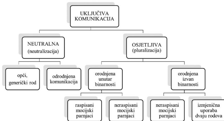
Graf 3. Shema rodno uključive komunikacije zabilježene na hrvatskome jeziku