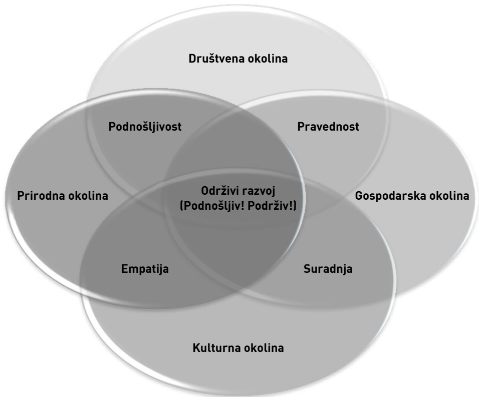
Dijagram 2: Osobine održivog razvoja (priredio T. Šola, 2008.)

Europska novija politička i ekonomska povijest učinile su zemlje EU-a svjetskim liderima u pažnji koja se poklanja globalnim procesima, tj. odgovornosti koju zajednički treba podnijeti 19 . Popularna percepcija identificira održivi razvoj s jakim političkim i civilnim nastojanjima, a u profesionalnim krugovima predstavlja temu kojoj se uporno gomila argumentacija i istraživanje, a malo se uspijeva napraviti.