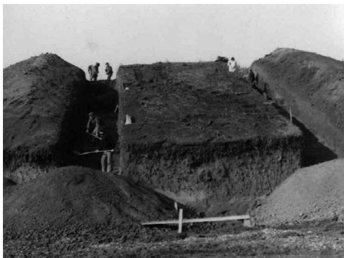
Slika 42 – Iskopavanje na Damića gradini 1980. godine Fig. 42 – The 1980 excavation at Damića Gradina

Iskopavanje je pokazalo kontinuitet naseljavanja tijekom sopotske, badenske, vučedolske, vinkovačke i bosutske kulture, a život na gradini završava utvrđenim naseljem mlađe faze sred-njolatenskog razdoblja u drugoj polovici 1. st. pr. Kr. (Dizdar 2001; Potrebnica & Dizdar 2002). S obzirom na to da je lokacija za školu bila predviđena na istočnoj polovici gradine, na toj su strani izvršena istraživanja u pet traka širine 2 i 4 m (Slika 43).