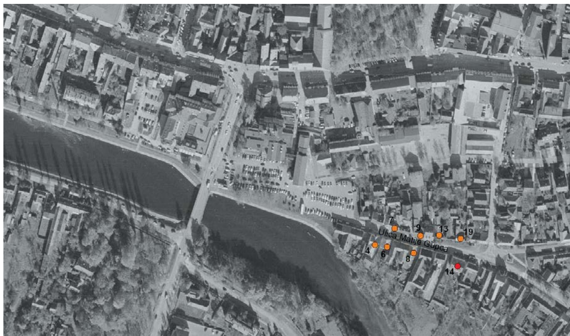
Slika 40 – Istraženi položaji u Ulici M. Gupca na Ervenici u Vinkovcima Fig. 40 – Investigated locations in Matija Gubec Street, Ervenica, in Vinkovci

Od 90-ih godina prošlog stoljeća istraživanja na Ervenici ograničena su na manje iskopne površine prilikom izgradnje stambenih i poslovnih objekata u Ul. Matije Gupca. Tragovi vučedolskog naselja dosad su zabilježeni na kućnim brojevima od 4 do 19 (Krznarić Škrivanko 1994; Gale 2002; Miloglav 2007; 2012a) ( Slika 40 ). Prema dosadašnjim istraživanjima istočnije od položaja kod k. br. 14 i 19 nisu zabilježeni tragovi naseljavanja tijekom vučedolske kulture. Dimitrijevićevi nalazi na položaju Poljski jarak zasad nam ostaju usamljeni slučajni nalazi koje ne možemo arheološki interpretirati.