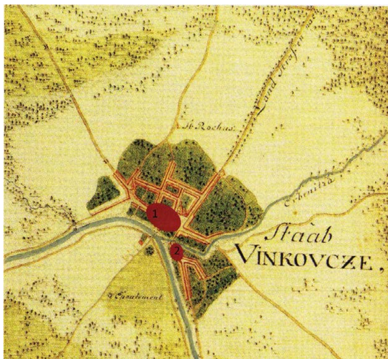
Slika 39 – Položaj naselja na Ervenici (2) i tela „Tržnica“ (1) u odnosu na potok Ervenicu i rijeku Bosut Fig. 39 – Position of the settlement at Ervenica (2) and the ‘Tržnica’ tell (1), in relation to the Ervenica brook and the River Bosut