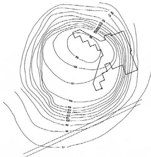
Slika 43 – Tlocrt iskopavanja za temelje Osnovne škole Fig. 43 – Ground plan of the excavations for the foundations of the elementary school

Rezultati su pokazali da je gradina imala zemljani bedem zapečen u dva nivoa, podignut u vrijeme sopotske kulture te opkop koji je vjerojatno bio povezan s potocićem koji teče s istočne strane gradine. Plato gradine kružnog je oblika promjera 117-125 m, dok je u podnožju promjera oko 170 m. Gradina se blago spušta prema jugu, relativne visine 8 m, dok je visina u sjeveroistočnom dijelu platoa preko 9 m (Iskra-Janošić 1984: 149).