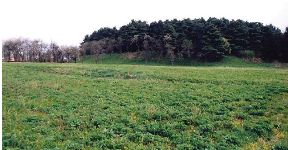
Slika 44 – Damića gradina – pogled s jugozapada. Snimljeno tijekom obilaska terena 2002. godine Fig. 44 – Damića Gradina – view from the south-west. Photographed during a field survey in 2002

S istočne strane nalazio se potok koji je punio opkop vodom, a vidljiv je i danas sa sjeveroistočne, sjeverne i sjeverozapadne strane. Ulaz na gradinu bio je s jugoistočne, najpristupačnije strane (Slika 44).