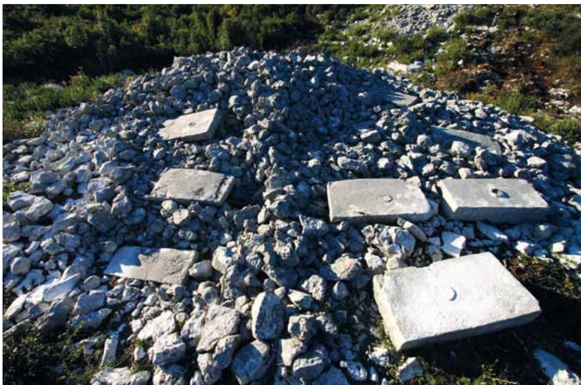
Sl. 6: Kamici na lokalitetu Mišja draga – Tumul 7.