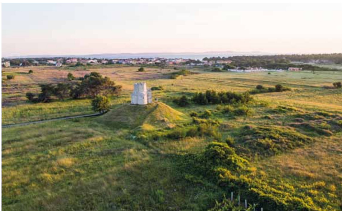
Sl. 10: Crkva sv. Nikole na zemljanom tumulu kod Nina.

Ilustrativan primjer iz kasnijeg vremena su dokumenti o razgraničenju između Mlečana i Osmanlija u Dalmaciji iz ranoga novog vijeka gdje se granica često određuje i tumulima (Anzulović 1998). U sukcesivnom mijenjanju granične crte u Dalmaciji od 16. do 18. st. dolazilo je i do podizanja novih tumula pa je bez arheoloških istraživanja i/ili reambulacije terena teško detektirati kada su se u razgraničenju koristili već postojeći tumuli, a kada su podizani novi (Milošević 1995).