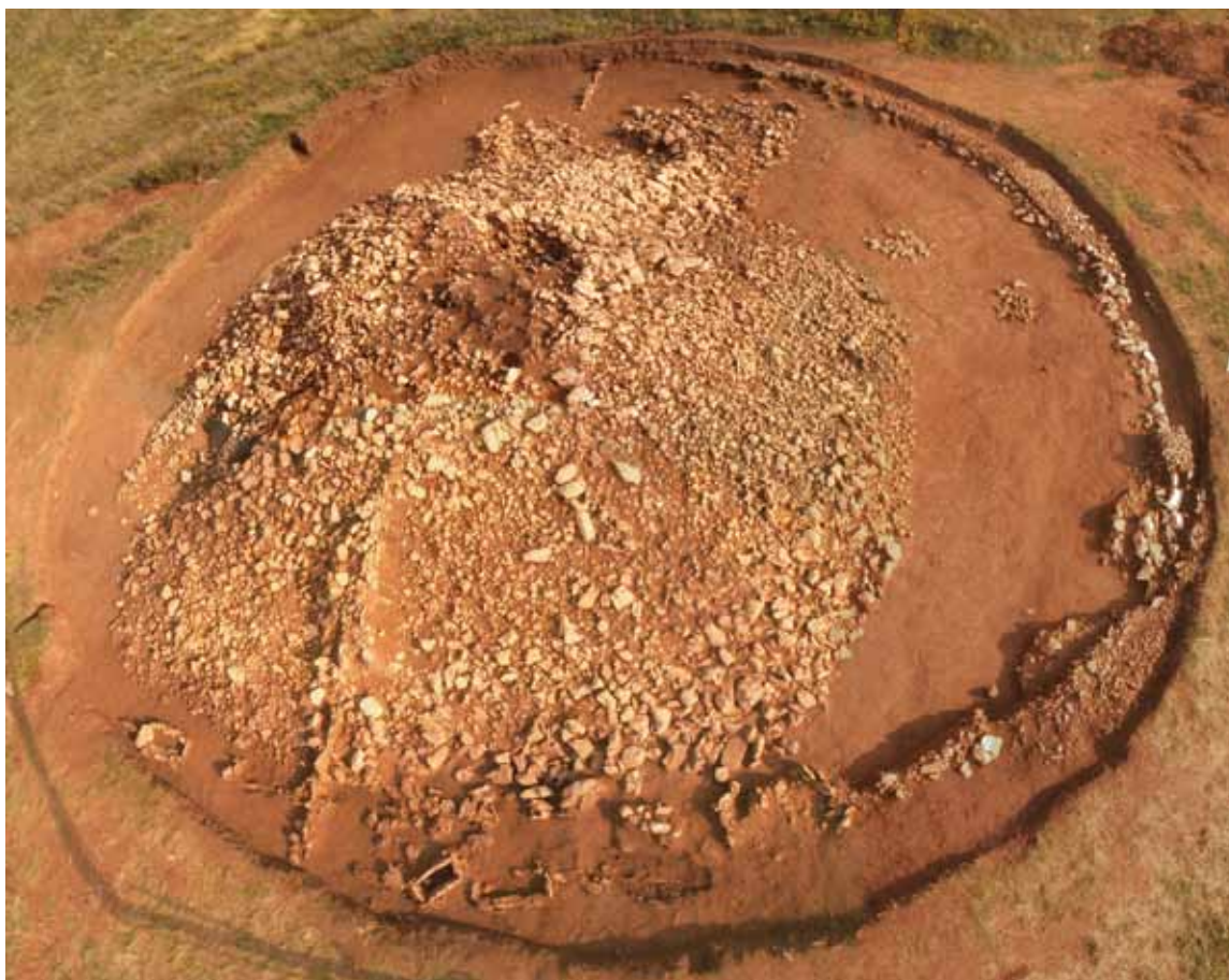
Sl. 4: Pogled na tumul Škornica tijekom istraživanja s kasnoantičkim grobovima u prvom planu.

Omjer dviju najbrojnijih kategorija ukazuje kako se ranosrednjovjekovni grobovi javljaju na manjem broju tumula, ali su tada brojniji u odnosu na kasnosrednjovjekovne (Šučur 2015a: 158–160).