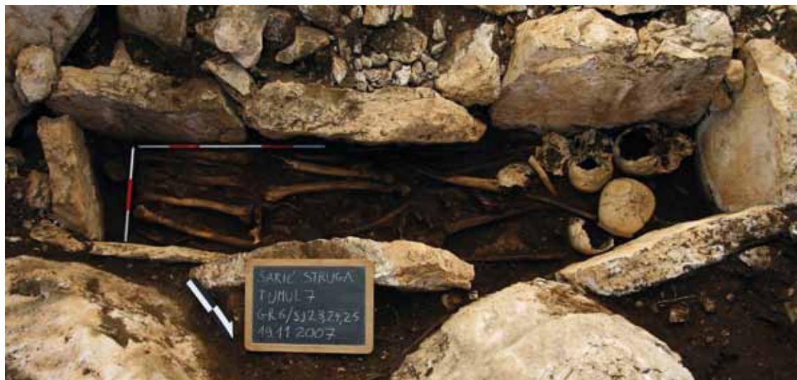
Sl. 7: Grob 6 na tumulu 6 na vrhu Mišje drage u kojem su očuvani osteološki ostaci pet pokojnika.

Najmlađi ukop zabilježen je u tumul sv. Grgur kod Nina. Pokojnik u grobu 2 ležao je na trbuhu, u smjeru istok – zapad s glavom na istoku. Obje su mu noge savijene u koljenu, kao i ruke u laktu od kojih je lijeva ispod ostatka kostura. S obzirom na položaj pokojnika i činjenicu kako je 1943. godine na vrhu tumula izgrađeno mitraljesko gnijezdo pokojnik je vjerojatno poginuo tijekom borbi u Drugome svjetskom ratu te je samo prekriven zemljom (Šučur 2015b: 29).