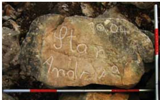
Sl. 9: Kamen iz skloništa na tumulu Gomila na padini Radovića s naznačenim urezanim grafitom.