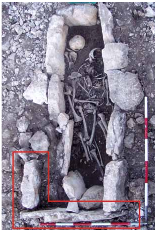
Sl. 11: Grob 1 na tumulu 11 u Vrbici – ranonovovjekovni ukop koji je jednim dijelom iskoristio prapovijesnu kamenu grobnu škrinju.

Tumuli se zbog svega navedenog ne mogu smatrati samo prapovijesnim spomenicima već su neodvojiv dio krajolika od samog nastanka do danas i kao takvi privlače ljudsku pažnju o čemu svjedoče brojni tragovi aktivnosti – kako duhovnih tako i profanih.