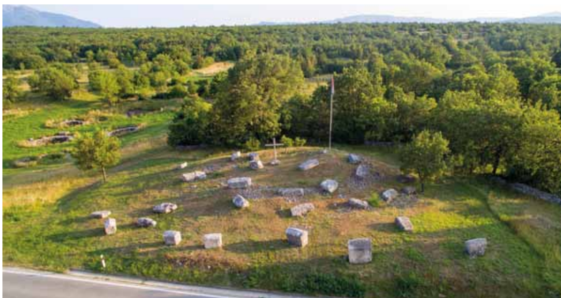
Sl. 2: Tumul Velika Crljivica s kamicima, suvremenim križem i zastavom (fotografirao: J. Šućur 2016.).

vremenim tumulima koji se vezuju uz razne nomadske narode, na koje se nadovezuju oni sibirski, s istočne strane Urala (Lutovský 1989; 1990; 1996). Ranosrednjovjekovni tumuli nalaze se i na prostoru koji nisu naselili Slaveni – u zapadnoj Europi, uključujući i Veliku Britaniju. Zapadnoeuropski tumuli su raniji, datirani od sredine 6. do sredine 8. st., i vezani su uz Germane, ali vidljive su i druge razlike (Van de Noort 1993: 67–69; Lutovský 1996). Ovdje je riječ o novopodignutim tumulima, ali postoje razlike i kada je riječ o ukopima u postojeće tumule. M. Lutovský navodi kako se u anglo-saksonskom svijetu podizanje tumula možda razvilo upravo iz ponovnog korištenja prapovijesnih, dok M. Carver vezano uz poznati anglo-saksonski lokalitet Sutton Hoo smatra kako je kod ukapanja u već postojeće tumule riječ o simboličnoj okupaciji novog prostora (Carver 1998). Na prostoru slavenskih tumula sekundarno ukapanje je rijetko, ali su takvi ukopi u prapovijesne tumule zabilježeni. Zanimljivi su primjeri iz Češke gdje podizanje novih tumula prestaje sredinom 10. st., a u pojedinim prapovijesnim zabilježeni su ukopi koji se datiraju u 11. i 12. st. (Hejhal & Lutovský 2012). Ti bi ukopi mogli svjedočiti o dijelu zajednice koja je sporije prihvaćala kršćanstvo.