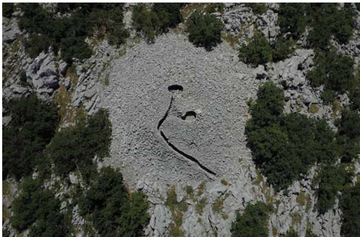
Sl. 6: Biokovo, Podglogovik, prapovijesni tumul s kasnijim intervencijama.

U dalmatinskom krajoliku, svojom se brojnošću i smještajem ističu kamene gomile – prapovijesni tumuli. Mišljenja smo da ukoliko bi postojao konačni broj arheoloških lokaliteta na ovom prostoru, onda bi barem polovica od toga broja otpadala na prapovijesne gomile. S obzirom