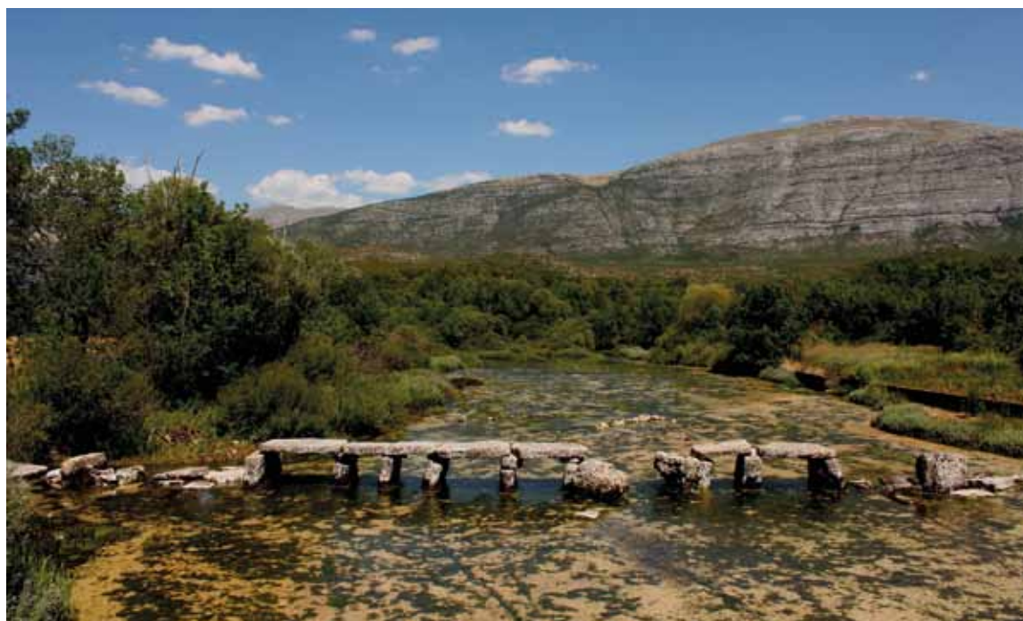
Sl. 3: Izvor Cetine, Pločasti most.

Drukčiji primjer, rekli bismo snošljiviji, nalazimo u Drnišu. Tamošnja crkva sv. Ante zapravo je džamija iz 16. stoljeća – ali ovdje poznata i toliko puta viđena priča o konvertiranju crkve u džamiju ili obrnuto (Klis, Đakovo), ne staje (sl. 2). Džamiju je krajem 16. ili početkom 17. stoljeća sagradio Serasker Halil Hodža. Taj ugledni Drnišanin je 1616. godine visovačkim fratrima posudio 600 reala za gradnju novog samostana na obali Krke do čega na kraju nije došlo. Veći dio svoga života Halil Hodža se iskazao kao prijatelj i zaštitnik fratara, a na samrti je i pokidao zadužnicu za tih 600 reala te na taj način „onim siromašnim fratrima“ oprostio dug. Godine 1670. (trinaest godina prije prestanka osmanske vlasti u Drnišu) džamiju preuzimaju visovački fratri te ona postaje crkva sv. Ante, a kasnije je i nadograđuju prema istoku i zapadu te podižu zvonik.