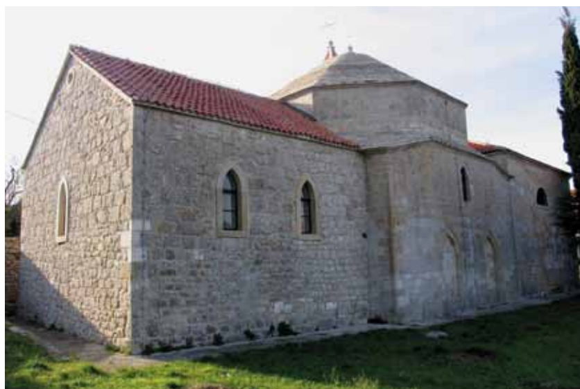
Sl. 2: Drniš, crkva sv. Ante s bivšom džamijom u središnjem dijelu.

Drukčiji primjer, rekli bismo snošljiviji, nalazimo u Drnišu. Tamošnja crkva sv. Ante zapravo je džamija iz 16. stoljeća – ali ovdje poznata i toliko puta viđena priča o konvertiranju crkve u džamiju ili obrnuto (Klis, Đakovo), ne staje (sl. 2). Džamiju je krajem 16. ili početkom 17. stoljeća sagradio Serasker Halil Hodža. Taj ugledni Drnišanin je 1616. godine visovačkim fratrima posudio 600 reala za gradnju novog samostana na obali Krke do čega na kraju nije došlo. Veći dio svoga života Halil Hodža se iskazao kao prijatelj i zaštitnik fratara, a na samrti je i pokidao zadužnicu za tih 600 reala te na taj način „onim siromašnim fratrima“ oprostio dug. Godine 1670. (trinaest godina prije prestanka osmanske vlasti u Drnišu) džamiju preuzimaju visovački fratri te ona postaje crkva sv. Ante, a kasnije je i nadograđuju prema istoku i zapadu te podižu zvonik.