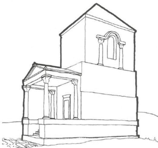
Sl. 8: Škrip, Kaštel Radojković, rekonstrukcija antičkog mauzoleja (Faber & Nikolanci 1985: 18).

Izgleda da se mauzolej pretvara u kulu unutar novih bedema naselja već u kasnoj antici. Kasnije je naselje doživjelo određene promjene da bi bračka obitelj Radojković krajem 16. stoljeća nadogradila opisani mauzolej-kulu te su je dodatno povisili i utvrdili, strahujući od pljačkaških pohoda Turaka s obližnjeg kopna ili pak iznenadnih gusarskih napada (sl. 9).