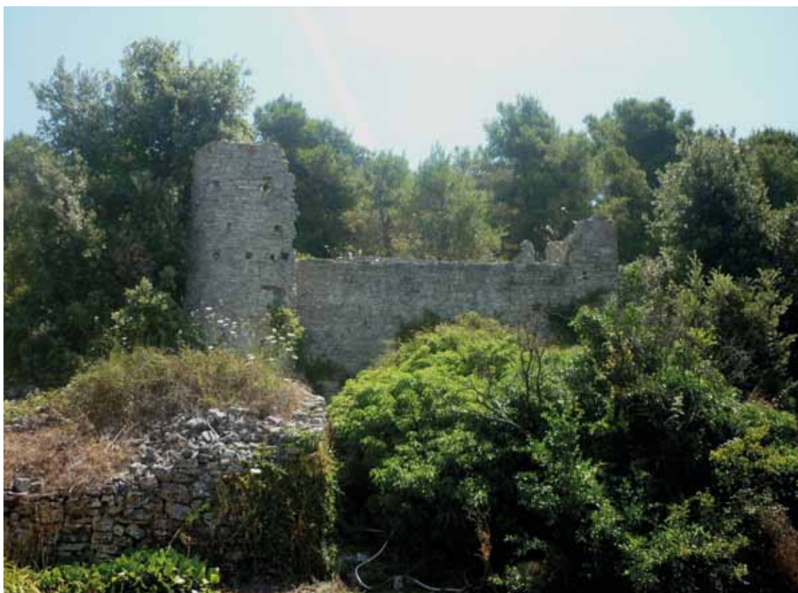
Sl. 10: Šolta, Starine.

Drugi primjer nalazimo na Šolti, otoku rijetko prisutnom u znanstvenoj literaturi. Sjeverno od Gornjeg Sela u neposrednoj blizini crkve i groblja Gospe od Stomorije nalazi se lokalitet “Starine” - jedno od najintragantnijih arheoloških nalazišta u Dalmaciji (Mihovilović 1990: 56, 61). Na ovom mjestu sačuvana je utvrda visine zidova i preko 6 metara. Utvrda ima najmanje četiri faze gradnje, tj. uporabe (sl. 10). Prva faza predstavlja vjerojatno ranoantički (rimski) stambeno-gospodarski objekt sačuvan u arheološkim tragovima oko današnje utvrde. U vrijeme kasne antike, na što nas upućuju sačuvani gljivasti otvori na zidovima, nastaje stambeni objekt s cisternom za vodu sačuvan danas gotovo u izvornim gabaritima do visine od oko 5 metara. Treća faza gradnje uslijedila je tijekom srednjega ili ranoga novog vijeka. Kasnoantičkoj građevini na “Starinama” tada su na sjeverozapadnom i jugoistočnom uglu dodane dvije okrugle kule s puškarnicama za lakšu obranu. Naime, Šolta je često bila na meti gusarskih, a kasnije i turskih napada. U današnje vrijeme (ili barem donedavno) utvrda je još uvijek služila za privremeni boravak ljudima i životinjama, a cisterna sačuvana unutar objekta i danas skuplja i drži kišnicu koja služi za zalijevanje okolnih polja.