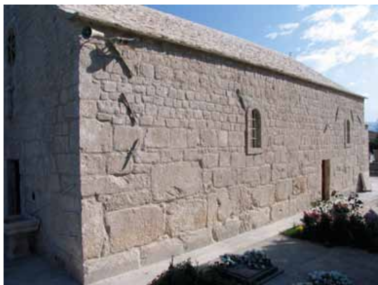
Sl. 5: Kamenmost kod Imotskog, crkva sv. Luke, stećci u južnom zidu crkve.

Imotskog. Okolnom kršćanskom stanovništvu je osim kao crkva služila i kao utvrda s izrazito širokim zidovima i kamenim svodom pokrivenim krovom od kamenih ploča. U to je doba crkva imala vrlo uska vrata te nije imala drugih otvora osim puškarnica koje su otkrivene u posljednjim zaštitno-istraživačkim radovima.