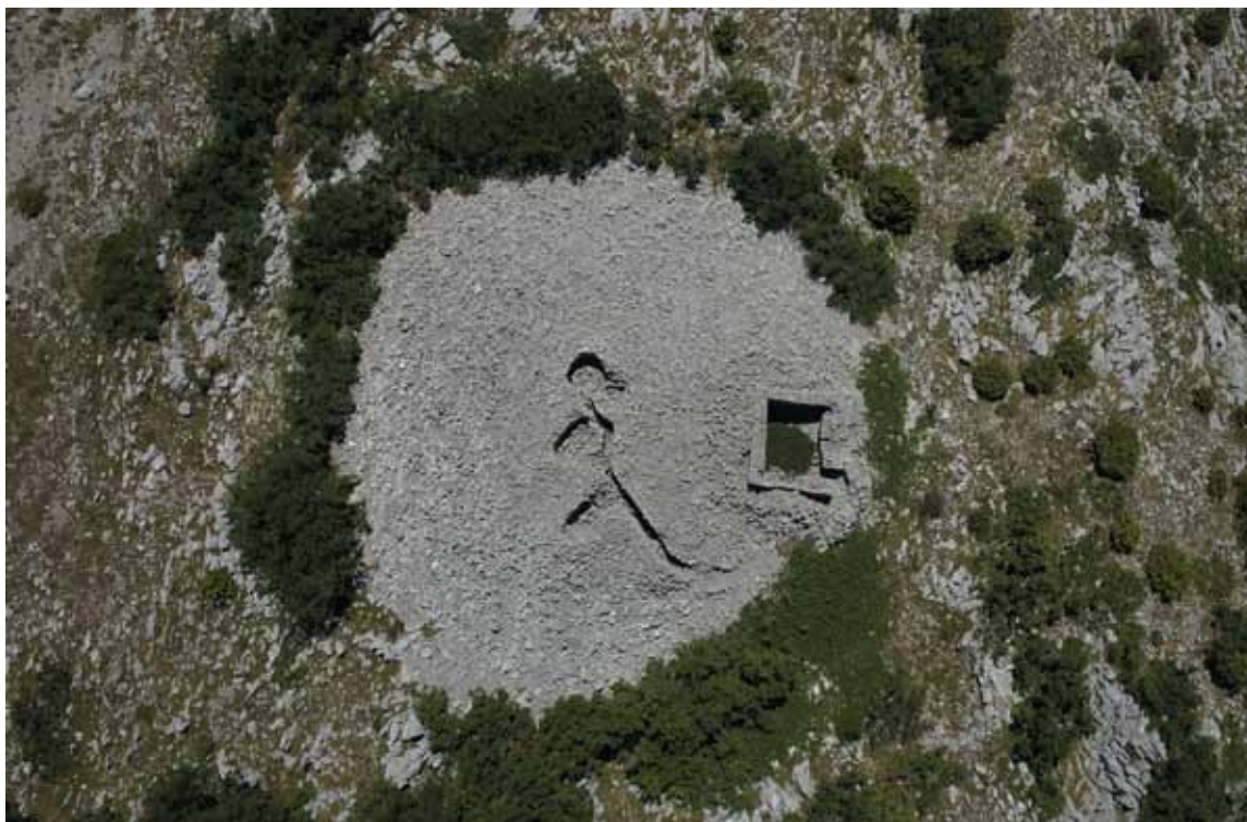
Sl. 7: Biokovo, Podglogovik, prapovijesni tumul s kasnijim intervencijama.