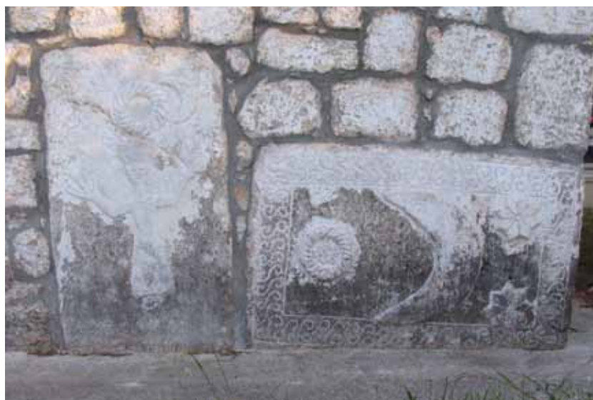
Sl. 4: Kljenak kod Vrgorca, crkva Svih Svetih, stećci u sjevernom zidu crkve.

Možda će zazvučati naivno, ali lijepo je vjerovati da su se fratri vodili poštovanjem prema svom zaštitniku u njima nesklonim vremenima, čuvajući njegovu zadužbinu i uspomenu na njega. S druge strane, s jedne od drniških džamija, odnosno sahat-kule, mletačka je vojska u jednom od svojih napada na grad 1647. godine skinula sat koji i danas pokazuje vrijeme na zvoniku šibenske crkve sv. Ivana (Traljić 1972; Kosor 1979: 132; Jurin-Starčević 2006: 127, 134).