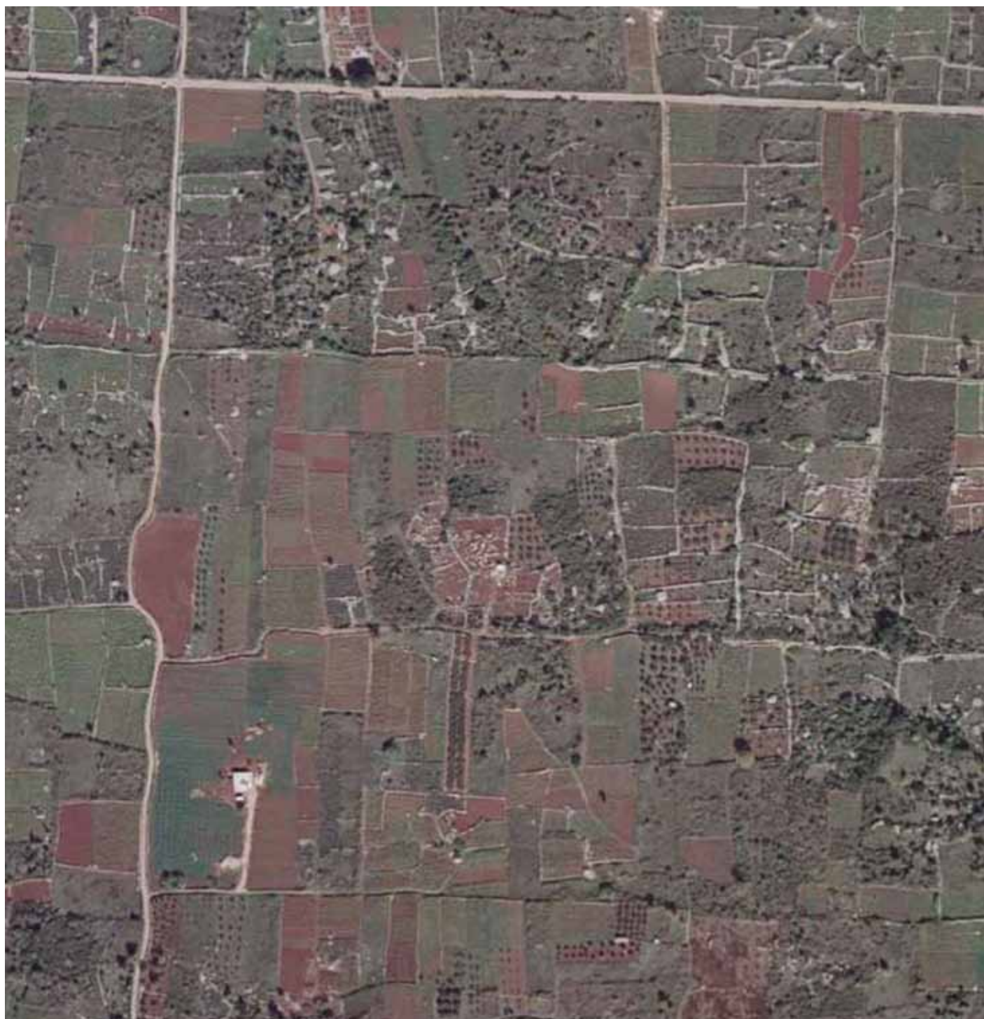
Sl. 11: Središnji dio Starigradskog polja na otoku Hvaru (fotografirao: I. Alduk).

turom). Iz više razloga taj prvorazredni starogrčki katastar je od 2008. godine na UNESCO-voj Listi svjetske baštine (sl. 11). Unatoč tome, taj prostor nikada nije obrađen publikacijom koja bi se, osim njegovim nastankom, detaljno bavila i njegovim razvojem u posljednjih 2400 godina. Jer priča je tek započela u trenutku kada su doseljenici s egejskog Parosa podijelili ovo polje u 70-ak identičnih parcela ( hora ) dimenzija 1x5 stadija, tj. 180x900 metara. Rimljani će Farosu