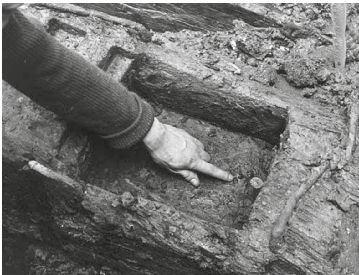
Sl. 9. Domicijanov as u utoru jarbola broda potonulog u Blackfriarsu u rijeci Temzi (Carlson 2007: 318; fig. 2).

srećom (Donderer 1984: 177–178; Rowan 2010: 7–8; Facchinetti 2013: 51). Novac se polagao i u javnim i privatnim objektima, od mostova, cesta, 5 hramova do privatnih kuća; pri izgradnji nove građevine, ali i pri obnovi ili nadogradnji već postojeće. Osim posvećivanja gradnje ritual je mogao uključivati i piaculum , pogotovo ako se gradilo na mjestu već postojeće građevine, da bi ju se ritualno očistilo od tragova prethodnih naseljenika. Istraživanja rimske kuće u Ferentu 2005. g. otkrila su postojanje takvog votivnog depozita, kalathosa s novcem, željeznim čavlom i tragovima drveta, zakopanog u jami u atriju kuće (Rizzo et al. 2013: 1–5). Novac se često direktno polagao u zemlju, bez posude. U Così je tijekom arheoloških istraživanja pronađen netom iskovani quadrans za koji su arheolozi istaknuli da je izgledalo kao da je namjerno utisnut u vlažnu žbuku rudus -a ispod mozaične površine koja je prekrivala južnu celu (Brown et al. 1960: 102; Scott 2008: 46–47; Rowan 2010: 7). U takvim je situacijama lako prepoznati ritualnu funkciju novčanog depozita, dok se u drugim slučajevima mora paziti da se nalaz novca koji se slučajno našao u određenom stratigrafskom sloju ne interpretira kao namjerna posveta (v. raspravu u: Facchinetti 2013: 51–52).