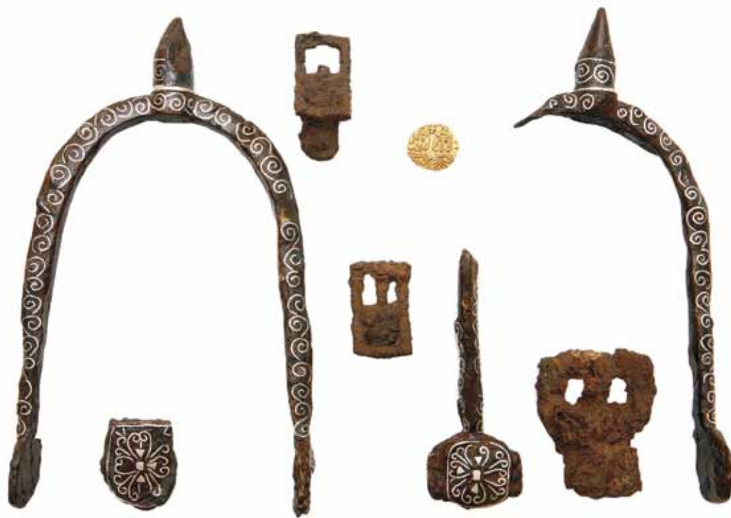
Sl. 8. Grob 7 iz Biskupije – Crkvine kod Knina sa zlatnim solidom Konstantina V. Kopronima (Šeparović 2009: 2, fig. 2, fotografirao: Z. Alajbeg).

o auguriju i drugim oblicima proricanja, i da ga ne može objasniti. Kako god ga protumačili, 3 svjedočanstvo je da su i kovanice mogle poprimiti magična svojstva i postati predmeti štovanja.