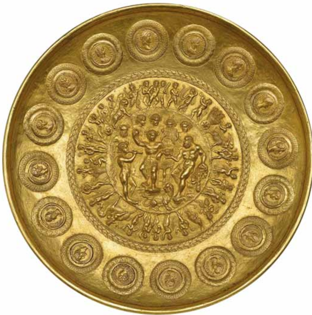
Sl. 5. Patera di Rennes (Morelli 2011: 106, fig. 1).

zaključiti da su Liburni rado nosili privjeske pravljene od metapontskog novca i da su očigledno tim novcima pridavali neka posebna značenja (Stipčević 1978: 37). Privjesci su kod Liburna brojni i raznoliki te, kao i aplike, osim ukrasne namjene imaju i simbolično i magijsko značenje. Brojni primjerci novca pronađenog u ostavama, grobovima i slučajnim nalazima ukazuju na njegovu upotrebu, bilo u međusobnoj razmjeni, ali i u razmjeni Liburna s antičkim svijetom (Brusić 2010: 243).