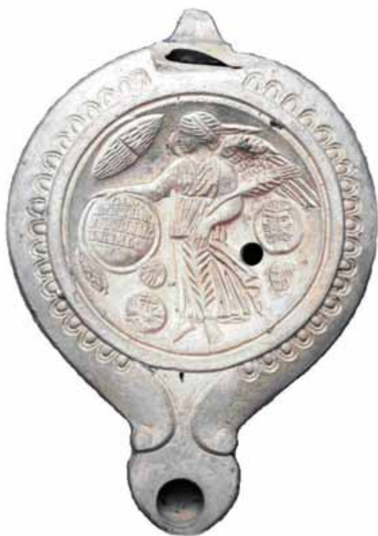
Sl. 6. Rimska "novogodišnja" svjetiljka (Rowan 2010: 6, fig. 2, ©Trustees of British Museum).

su dijelom radi toga što su se svojom neutralnošću uklapali u novu kršćansku sliku svijeta, a istovremeno su projicirali lako prepoznatljivu snagu i moć (pobjeda, znak križa ...) (Bonner 1950: 165–168; Maguire 1997: 1040; Fulghum 2001: 140–142; Rowan 2010: 9; Németh 2013: 61). Mnogi su amuleti imitirali kovanice, iako nikad nisu bili iskovani i namijenjeni novčanoj cirkulaciji (Fulghum 2001: 146; Maguire 1997: 1040–1042; Németh 2013: 61). Probušene su kovanice čest i omiljen grobni prilog, koji se javlja u vremenski i prostorno vrlo udaljenim područjima, u društvima koja nisu poznavala novčanu privredu i u kojima su tek dio zemaljskih vrijednosti pokojnika.