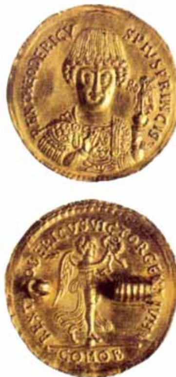
Sl. 2. Zlatna kasnoantička fibula od Teodorikovog solida (Morelli 2010: 156, fig. 9).