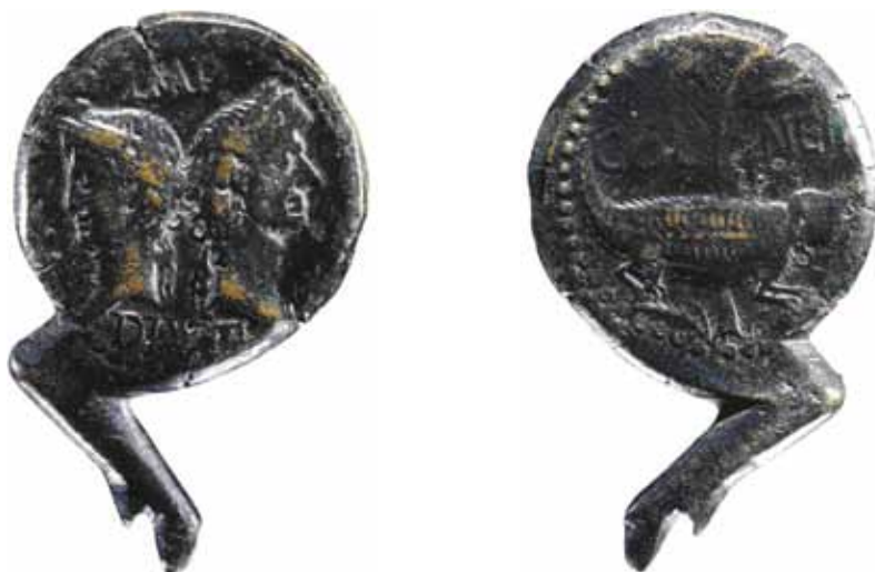
Sl. 10. Rimski provincijalni denar iskovan u Nemauzu (Rowan 2010: 10, fig. 4).

kojih se apotropejska uloga može potvrditi ili pretpostaviti s većom sigurnošću, često dolaze u paru s kovanicama. Ako novac nije bio položen u ustima pokojnika ili ako je bilo više kovanica u grobu, vjerojatnija je interpretacija novca kao amuleta (Alfayé 2010, 430–431; 444; 449–450; Németh 2013: 61). Naravno, novac u grobu može jednostavno i biti samo to – novac. Nalaze više kovanica, često korodiranih i međusobno slijepljenih, u području ruke ili pasa pokojnika, možemo lako prepoznati kao ostatke novčane vrećice.