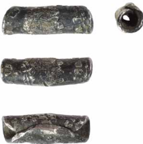
Sl. 11. Zarolani Domicijanov denar iz grofovije Lincolnshire u Engleskoj ( Portable Antiquity Schemes : PUBLIC-49EA94; https://finds.org.uk/database/artefacts/record/id/828719 ).

Dotakli smo se samo nekih sekundarnih upotreba novca, no, već nam je i ovaj letimičan pregled raznoraznih primjera u kojima možemo posvjedočiti recikliranje već postojećih kovanica dao naslutiti koliko je širok repertoar predmeta, pojava i mjesta na kojima možemo naići na “stari” novac u njegovu novom svjetlu.