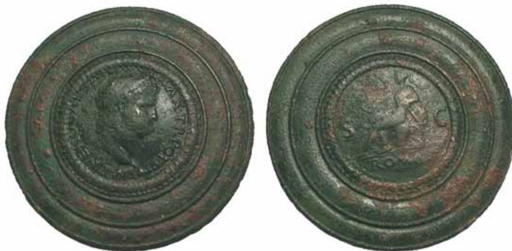
Sl. 1. Brončano dvodijelno zrcalo u kutijici iz Salone (Arheološki muzej u Splitu) (Ivčević 2007: 33, sl. 12).

nutim portretima. I literalni izvori potvrđuju karizmatičnu snagu carskog portreta; od zapisa da je za vrijeme Tiberija bilo zabranjeno ući u javnu kuću ili nužnik s kovanicom koja je na aversu imala carev portret (Suet. Tib. 58; Dio Cass. 78. 16. 5), do toga da se nije smjelo tući roba koji je sa sobom nosio takav primjerak novca (Philostr. VA 1. 15. 2; Rowan 2010: 4). Možda je snaga poruke i legitimiteta koji se vezao uz carski portret ( imago ) utjecala na upotrebu kovanica u izradi nakita. Nakit s istaknutim portretom određenog cara ili carske obitelji, objavljivao je tko ste, što ste i jeste li u trendu (Rowan 2010: 4). To je zasigurno vrijedilo za određene slojeve stanovništva, ali da se carski portret ne može uzeti kao jedini isključivi razlog zašto je novac tako sveprisutan u oblikovanju nakita, pokazuju i nalazi gdje vidimo zanemarivanje damnatae memoriae . Nakit s kovanicama s prikazom Elagabala, pronađen u ostavi zakopanoj oko 260. godine, 38 godina nakon Elagabalova pada, dokaz je da se kovanice s njegovim portretom nisu zamijenile ili uklonile. Naravno, ostaje mogućnost da se nakit jednostavno više nije nosio, ali da je sačuvan zbog svoje intrinzične vrijednosti (Agrinier & Schaad 1992: 22–23; Rowan 2010: 4).