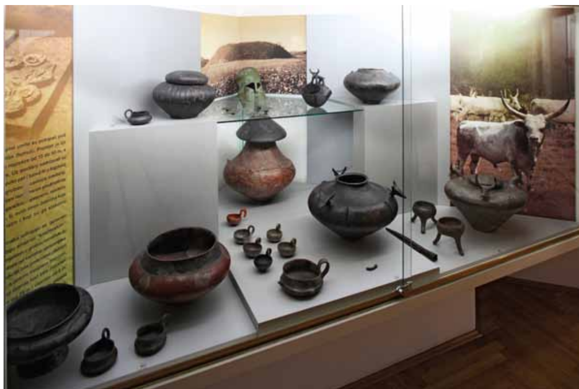
Sl. 12. Prilikom postavljanja novog stalnog postava Pretpovijesne zbirke korištene su originalne vitrine arhitekta Stjepana Planića iz 1974. godine.

Palača na Zrinjercu 19. kroz stoljeće i pol promijenila je mnogo vlasnika, koji su unosili novi sadržaj i time mijenjali izgled palače i vrta prema Gajevoj ulici. Najveće adaptacije su bile djelo velikih arhitekata, sve su bile rađene smisleno, no, ipak, nekih se danas sjećamo sa sramom. Međutim, sve su bile potrebne kako bi nastavile životni vijek palače koja bez svrhe i stanara nema šanse za preživljavanjem.