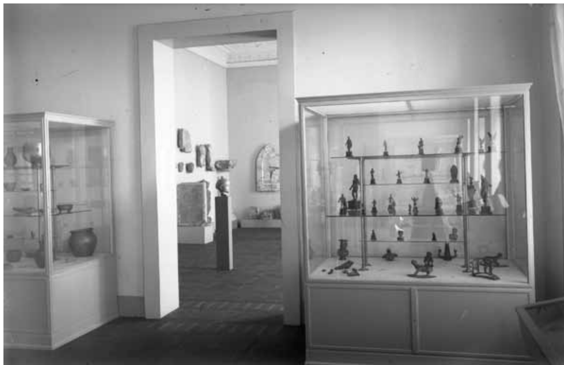
Sl. 9: Stalni postav Arheološkog muzeja u Zagrebu, 1955. (AAMZ 73).