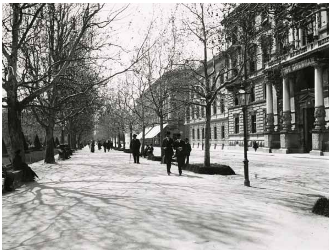
Sl. 1: Natpis na palači: The Gresham (Gresham Life Assurance Company) – društvo za životno osiguranje iz Londona, Zrinjski trg 19, prije 1906., MGZ FOT-1306 (Solter 2016: 190).