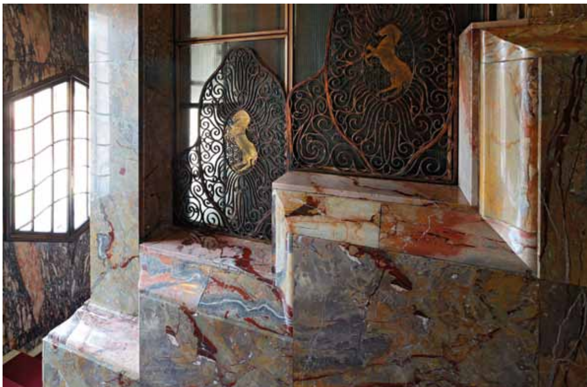
Sl. 2: Kovana rešetka prema narudžbi Radivoja Hafnera: srednji ovalni ukras s konjem – Tomislav Krizman (?), vanjski ukrasi – Alojz Bastl, Zagreb, vjerojatno 1917. (Koprčina 2016: 211).

Palaču je od udovice baruna Terezije Vranyczany-Dobrinović za 610.000 kruna kupio 1916. godine Radivoj Hafner 5 , bogati liferant austrougarske vojske konjima i mesom. Od 111 nekretnina prodanih te godine u Zagrebu, palača na Zrinjvcu 19 postigla je najveću vrijednost (Koprčina 2016: 201–219). Novi vlasnik, ubrzo je započeo adaptaciju unutrašnjosti palače. Današnji raskošan izgled dugujemo arhitektu Alojzu Bastlu kojeg je Hafner angažirao 1916. godine za adaptaciju palače i dvorišnih objekata – staje i kolnice koje danas više ne postoje (Koprčina 2016: 205–210). Najveći zahvat Bastlove adaptacije zasigurno je projekt izmicanja stubišta i ugradnja panoramskog dizala zaštićenog željeznom kovanom i pozlaćenom ogradom, ukrašenom monogramom RH i konjima (rad Vjekoslava Bastla i Tomislava Krizmana) (sl. 2). Novo stubište i prizemlje Bastl je dao obložiti mramorom, što nam najbolje prikazuje vrhunac luksuza kojim je adaptacija provedena iako u vrlo teškim vremenima Prvoga svjetskoga rata. Danas mnoga obilježja Bastlove bogate adaptacije nisu ostala sačuvana kao što su reprezentativne drvene oplata pojedinih prostora, namještaj koji detaljima odgovara oplatama, ali i raskošno adaptirane staja i kolnica u dvorištu prema Gajevoj (sl. 3).