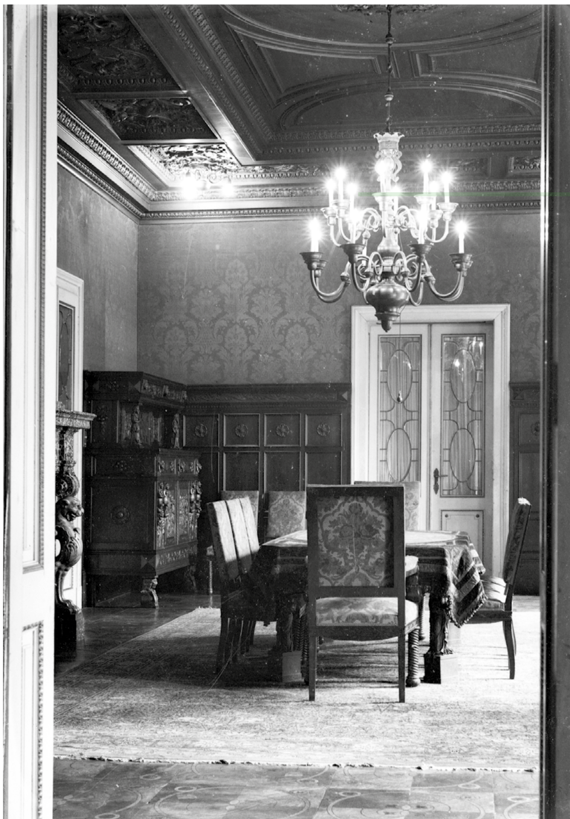
Sl. 3: Blagovaonica Autokluba (Janeković 1932.; MUO-041942).