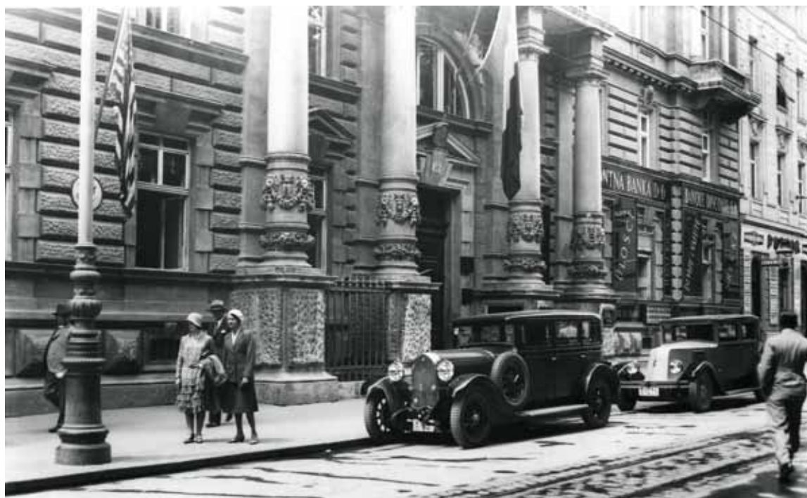
Sl. 6: Fotografija pročelja palače na Zrinjevcu 19, 1929. – 1931., MGZ FOT–19997 (Koprčina 2016: 208-209).