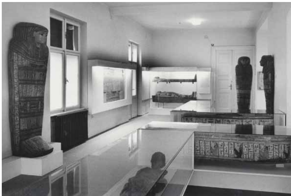
Sl. 10: Stalni postav Egipatske zbirke, 1974. (M. Grčević, AMZ i-478).