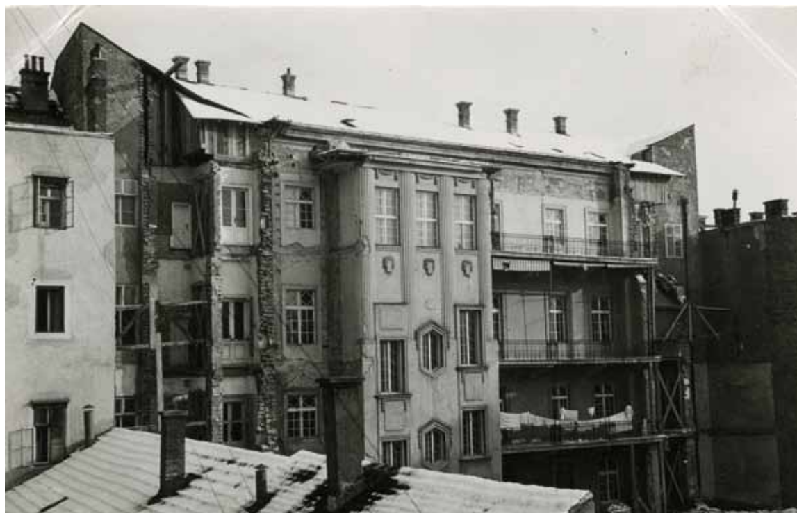
Sl. 7: Rušenje dvorišnih krila, 1941., MGZ FOT-17371 (Koprčina 2016: 213).