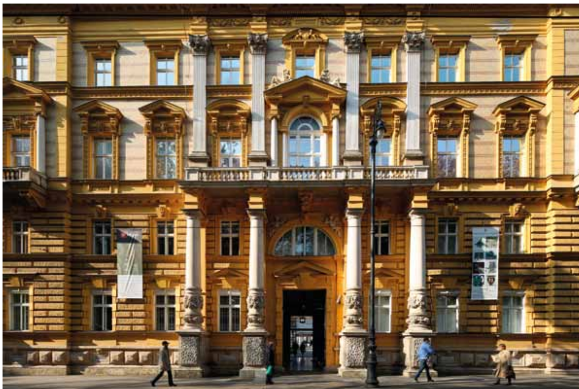
Sl. 11. Pročelje palače.

Nakon preseljenja 1945. godine Muzej je u vrlo kratkom roku čak šest puta mijenjao izgled stalnog postava (sl. 8 i 9). Prvi stalni postav, doduše skroman izgledom, bez velikih financijskih ulaganja, otvoren je za posjetitelje već 1. svibnja 1946. godine, samo godinu dana nakon prve naredbe o preseljenju (Solter 2016: 232). Kako stambeni interijer palače nije bio adekvatan za postavljanje muzejskih izložaka, ubrzo su nakon prvog stalnog postava skinuta sva vrata na drugome katu, odstranjeni su izvorna hrastova oplata, mramorni kamini te lusteri, kao i sve preostalo pokućstvo (Mirnik 2009: 297). Od Vranczyanyjeva interijera ostali su samo parketni podovi, koji će biti odstranjeni u adaptaciji 90-ih godina, i štukturni stropovi. Potkrovlje zgrade služilo je kao depozitorij, kao i veći dio podruma.