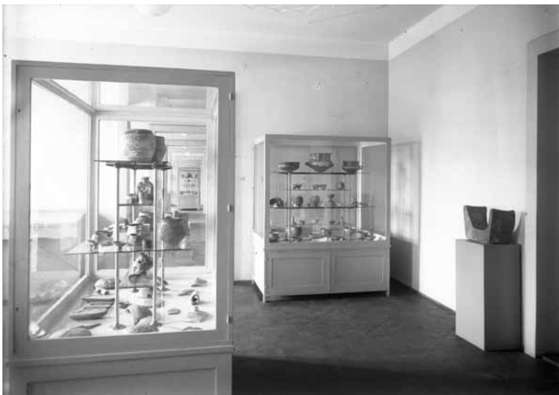
Sl. 8: Stalni postav Arheološkog muzeja u Zagrebu, 1955. (AAMZ 73).