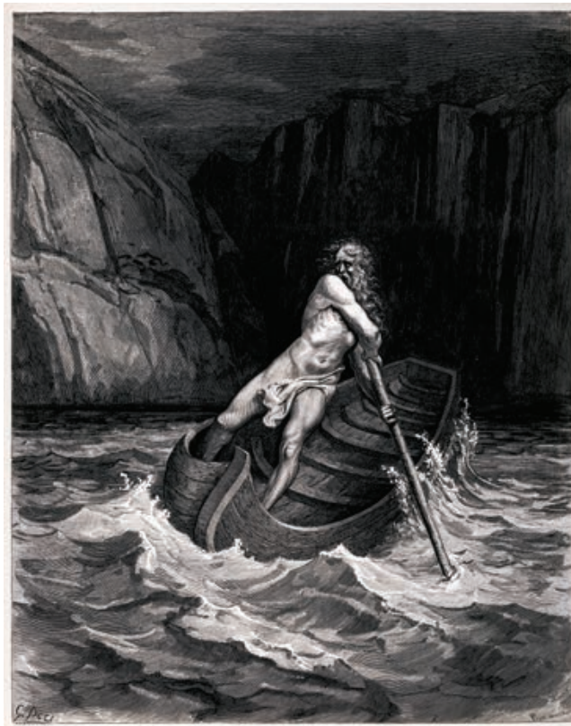
Sl. 5. Paul Gustave Doré, Harón , drvorez (1857.)

Evo i Harona groznog, vozara i vodi čuvara, halja mu gnusna je tralja, i sijeda ga obrasla brada, čupava, kuštrava, gusta; a očima vatrenim gleda, plašt mu se prljavi klati što u čvor ga sapeo sprijeda. Motkom otiskuje lađu i plovidbom upravlja njenom, duše preminulih vozi u čunu od rđe crvenom, star je, no bogu su sile i u starost krepke i čile. 138