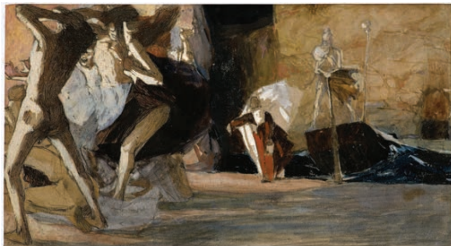
Sl. 7. Mirko Rački, S onu stranu Aheronta , tuš i akvarel na papiru (1907.), Galerija umjetnina, Split