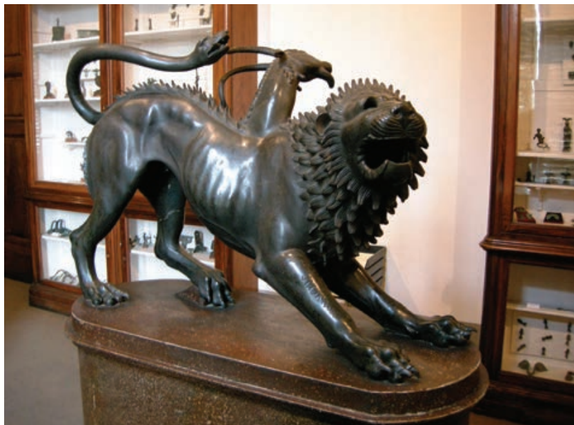
Sl. 4. Himeru iz Arezza, bronca, lijevanje à cire perdue (5. – 4. st. pr. Kr., etruščanska umjetnost), Firenze, Museo archeologico nazionale

čudovište Himeru. Unuka Geje i Tartara, kći diva Tifona i zmije Ehidne, harala je stadi- ma i rigala vatru uništavajući okoliš, tako da je Argolidi prijetila glad. Usmrtio ju je junak Belerofont te kao opasna sjena živi u podzemnom svijetu među sjenama drugih čudovišta. Kompozitna neman (kombinacija koze, lava i zmije) najpoznatija je u obliku koji su joj dali etruščanski brončari. Oštećeni kip nađen je 1553. godine kod Arezza u ne baš posve jasnim okolnostima, a prvi ga je restaurirao Benvenuto Cellini za Cosima I. Medicija. 134 Danas je jedan od bisera arheološkog muzeja u Firenzi. U odlomku iz XIX. poglavlja Proljeća Ivana Galeba šimerom postaje sama zamisao o borbi protiv smrti, utjelovljuje se i opisana je nizom riječi koje pristaju bićima (šiknuti, staniče, pokuljati, propet, sokovi, sazdan od krvi i mesa) 135 i upravo prizivaju Himeru. 136