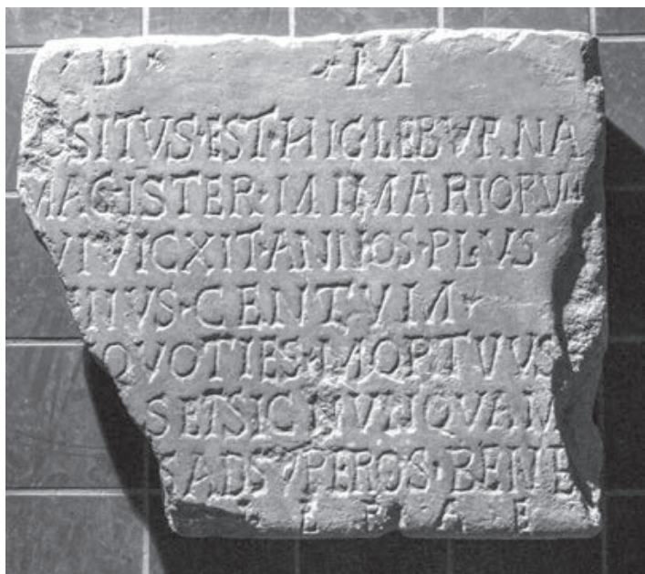
Sl. 2. Nadgrobna ploča Leburne (4. stoljeće), Sisak (Mađarski narodni muzej, Budimpešta)

Leburne iz 4. stoljeća nađena je 1823. u Sisku na prostoru zapadne siscijske nekropole. Vlasnik vinograda u kojemu je iskopana, trgovac Paulus Bitroff, dao ju je otpremiti u Mađarski narodni muzej u Budimpešti, gdje se i danas nalazi. Teatralno osebujan epitaf glasi: D(is) M(anibus) / positus est hic Leburna / magister mimariorum / [q]ui vixit(!) annos plus / [m]inus centum / [al]iquoties mortuus / [sum] set sic nunquam / [opto v]os ad superos bene / [va]ler{a}e . U prijevodu: „Bogovima Manima. Ovdje leži vođa glumaca Leburna, koji je živio stotinjak godina. Umro sam mnogo puta, ali nikada ovako. Vama koji ste još živi želim da ste dobro i zdravo.“ 18