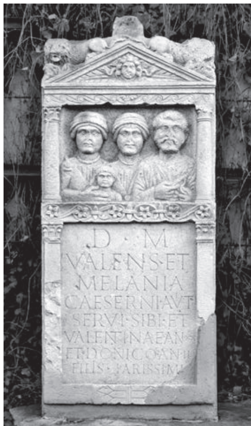
Sl. 3. Stela robovske obitelji (2. stoljeće), Donji Čehi (Arheološki muzej u Zagrebu)

Bez obzira na pojedine nezgrapnosti u detaljima izvedbe, stela je raskošan, dopadljiv i u cjelini vrsno isklesan spomenik. Na sredini zabata prikazana je Meduzina glava, a na njegovim bočnim stranama leže lavovi s ovnujskim glavama u šapama. Na prvi pogled uočava se samosvijest prikazanih osoba vidljiva u odjeći i portretnim crtama koje oponašaju carske fizionomije i frizure. Na desnoj strani niše prikazan je Valent s frizurom te bradom i brkovima koji oponašaju izgled cara Antonina Pija (138. – 161.), odjeven u tuniku i ogrtač