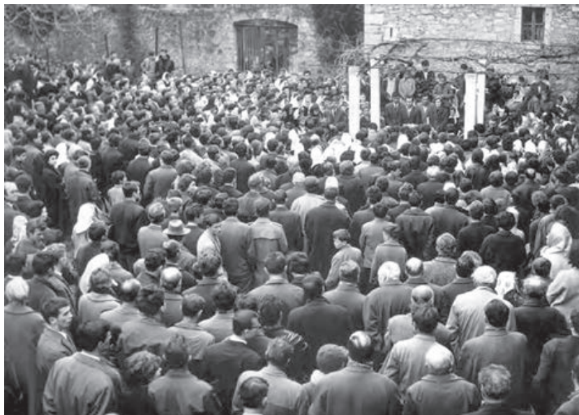
Sl. 5. Okupljeno mnoštvo ispred Kule Stojana Jankovića u Islamu Grčkom na sprovodu Vladana Desnice

Na kuli legendarnoga hajdučkog vođe Janković Stojana u Islamu Grčkom vijorila se danas crna zastava. Žitelji Ravnih kotara i sjeverne Dalmacije oprašali su se od svog uglednog sina, istinskog književnika Vladana Desnice, potomka slavni serdara i hajduka tog kraja. 34