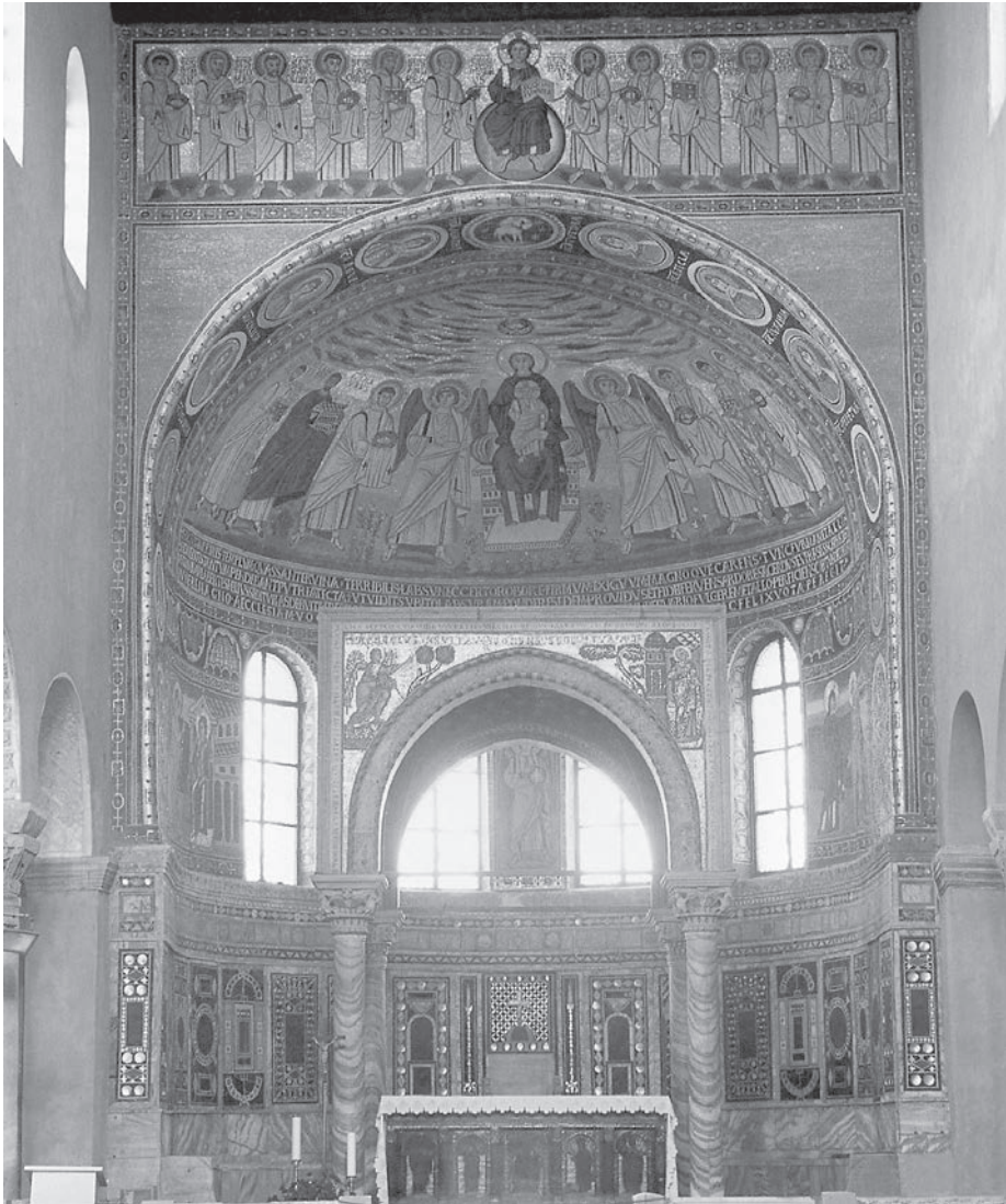
Slika 6. Na istočnoj strani bazilike nalaze se tri apside ukrašene mozaicima u ranobizantskom stilu. najbolje su očuvani mozaici u središnjoj apside. Središnji prizor u polukupoli apside predstavlja Bogorodicu s djetetom na prijestolju, okruženu anđelima i mučenicima, među kojima je posebno označen sveti Mavro, prvi porečki biskup i mučenik, te biskup Eufrazije koji u rukama drži model crkve. Ističu se i lijepi prizori Navještenja i Pohoda u donjem dijelu apside, traka s 13 medaljona kojim je ukrašen svod apside te prikaz Krista s apostolima nad lukom apside.

biskupu Eufraziju koji je istovremeno bio i spiritus movens njihove izgradnje. Specifični arhitektonski oblik, karakteristične dekoracije, a ponajviše programatska ikonografija zidnih mozaika (lik Bogorodice na središnjem mjestu) povezuju