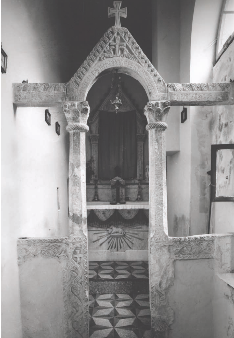
Slika 5. Crkva sv. Martina u Zlatnim vratima Dioklecijanove palače