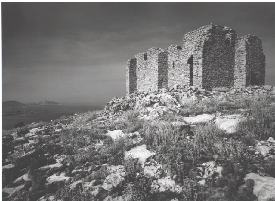
Slika 3. Bizantska utvrda Toreta na otoku Kornatu

Zadar, Trogir te Krk, Osor, Pula održali su se na životu u turbulentnim vremenima kasne antike. Nekim gradovima to nije uspjelo – Salona, Epidaur, Narona, 57 Fulfinum na Krku, Nezakcij kod Vizače u Istri iz mnogih se razloga više nisu mogli prilagoditi novonastalim prilikama, te se život u njim jednostavno ugasio. 58 U nekim slučajevima središta života pomiču se prema novim lokacijama – kao na primjeru Salone/Splita i Epidaura/Dubrovnika. Radi se o dvojakoj vrsti kontinuiteta pod bizantskim vrhovništvom – za prvu skupinu postoji kulturno-političko-topički kontinuitet, za drugu samo kulturno-politički. 59