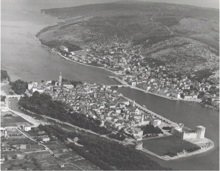
Slika 2. "Grad Trogir je malen otok u moru, s kopnom povezan kao most uistinu uskim zemljouzom, kojim stanovnici prelaze u sam grad. Trogir se zove, jer je sam otok malen kao krastavac" - DAI 29/258-262; Vizantijski izvori II, 22-23.

ili cisterna. Arhitekturu je gotovo nemoguće tipološki klasificirati, jer su se pri gradnji bedemi vrlo često prilagođavali konfiguraciji terena. 50 Uglavnom se radi o teško pristupačnom, brdovitom terenu na vrhovima, gdje je utvrda (odnosno gradina) postojala još iz prethistorijskih vremena. 51 Doduše, poznati su primjeri i savršeno pravilnih geometričnih kastrona, za sada bez indikacija o unutarnjim strukturama, što su izgrađeni na nižim, zaravnjenim otočnim lokacijama (poput utvrde na Palacolu i sv. Petar kod Ilovika). 52