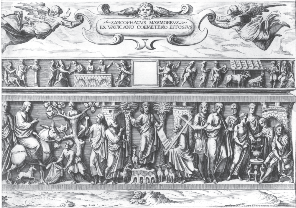
Slika 127. Sarkofag s motivom gradskih vrata (crtež), nekoć Sv. Petar u Rimu, posljednja četvrtina 4. st.

Sarkofag je nađen na prostoru stare bazilike Sv. Petra i sačuvan je samo u ulomcima. Pripada tipu sarkofaga s motivom gradskih vrata, koja se naziru u pozadini, sugerirajući zemaljski i nebeski Jeruzalem. Ikonografski program svoden je na dvije pasionske teme (Ulazak u Jeruzalem te Pilatov sud), dok središte zauzima tema Predaje zakona.