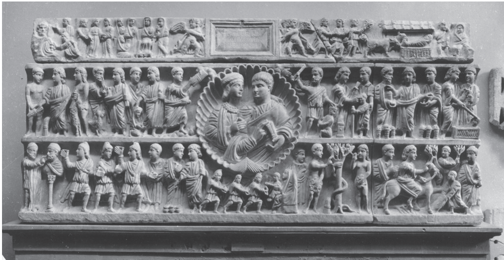
Slika 114. Adelfijin sarkofag, oko 340. Sirakuza, Museo archeologico

Sarkofag s reljefima na dvije razine kršćanskim je umjetnicima omogućavao velik izbor sadržaja. Starozavjetne teme (Stvaranje čovjeka, Adam i Eva, Abrahamova žrtva, Mojsije prima zapovjedi, Hebreji u gorućoj peći) miješaju se s onima iz Novoga zavjeta (Poklonstvo mudraca, pet Kristovih čuda, Ulazak u Jeruzalem, Petrovo nijekanje). Na poklopcu je rani prikaz Kristova rođenja (desno), te niz enigmatičnih ženskih likova lijevo, s rijetkim primjerom Navještenja na bunaru.