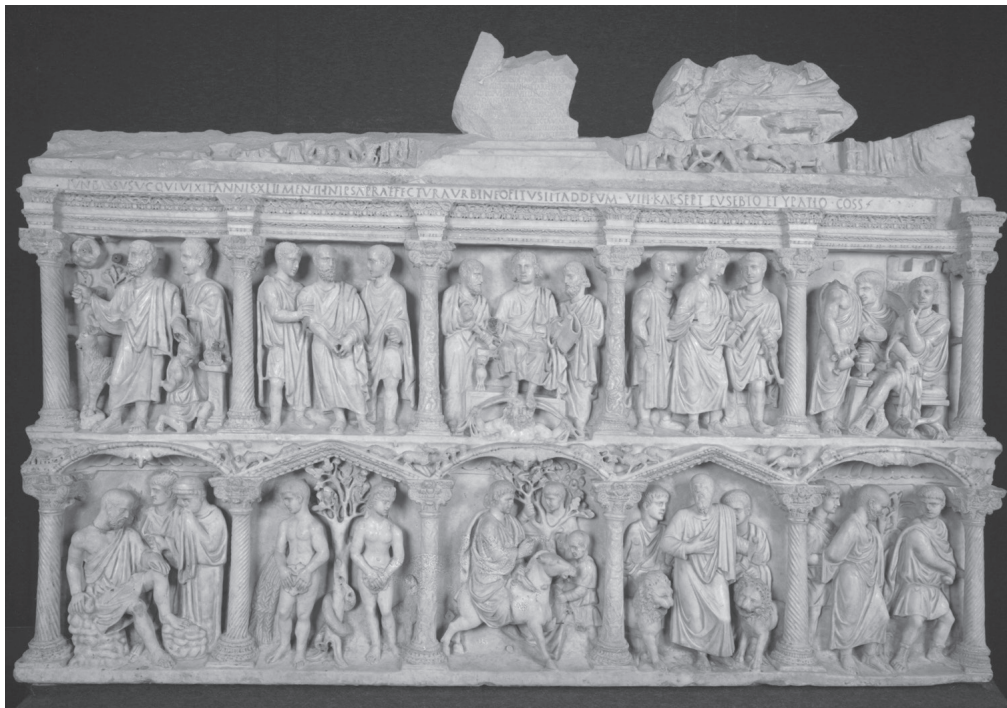
Slika 116. Sarkofag Junija Basa, 359. Vatikan, Museo storico del tesoro della Basilica di San Pietro

Jedno od najljepših djela ranokršćanske umjetnosti općenito. Pročelje na dvije razine stupovima je podijeljeno na deset niša u kojima su smještene starozavjetne i novozavjetne epizode. Niše u donjem registru imaju naizmjenice lučne i trokutaste završetke, a prostori iznad lukova i zabata ispunjeni su minijaturnim simboličkim scenama.