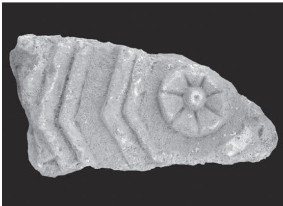
Sl. 33 - Supetarska Draga, ulomak pluteja s kazetom

u 5. st., pri čemu su kao predlošci mogli poslužiti u toj sredini poznati italiski kanelirani sarkofazi, dok su svi drugi motivi na relikvijaru široko rasprostranjeni i omiljeni u produkciji različitih ranokršćanskih radionica. Križ, pa i ovjenčani križ, vrlo je čest motiv na relikvijarima kojima je zbog malih dimenzija odgovarao sažeti likovni govor. Motivu na rapskom relikvijaru vrlo je srodan motiv na kamenom relikvijaru u obliku sarkofaga iz Istanbula, datiranom u 5. st. Taj relikvijar na dužim stranicama ima križ u lovorovom vijencu s čijeg dna se izvijaju vitice s bršljanovim listovima. 105 Imajući u vidu da su brojni kameni relikvijari bili i neukrašeni, 106 lijepo ukrašeni rapski relikvijar svjedoči svakako o zahtjevnoj zajednici koja je u gradu Rabu za čuvanje sigurno dragocjenih relikvija, nabavila profinjeno izrađen relikvijar. Po bogatstvu ukrasa spomenik se izdvaja među istovrsnim djelima na istočnome Jadranu. Ovdje za usporedbu navodimo ukrašeni kameni relikvijar iz Lovrečine na Braču. 107 Taj relikvijar ima jednostavnu četvrtastu formu i ukras urezanog latinskog križa na svim stranicama. Tipološki, križevi na relikvijaru posve odgovaraju tzv. salonitanskom tipu križeva s proširenim