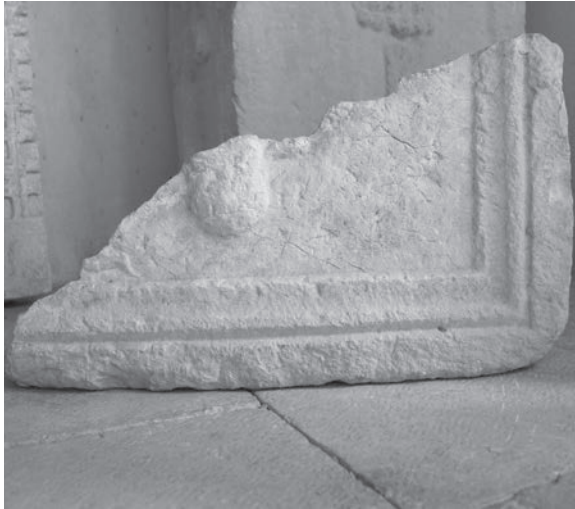
Sl. 31 - Rab, Sv. Andrija - ulomak pluteja

pretpostavimo širinu od oko 1 m, da se na sredini donje plohe nalazila udubina za fiksiranje u podlogu. Na poleđini ploče vidljivi su ostaci tankog premaza, što možda upućuje na prislanjanje i spajanje žbukom s nekom vertikalnom podlogom. Možda se može pretpostaviti da je ploča bila naslonjena na širi monolitni stipes nekog oltara i predstavljala frontalnu ukrasnu ploču. Pored širega središnjeg stipesa mogli su postojati i ugaoni stupići, nosači menze, budući da je taj tip oltara bio posebno omiljen u kasnoantičkoj Dalmaciji. Tako bi rapska ploča mogla biti interpretirana kao oplata stipesa oltara, za što ima analogija i na području Dalmacije odnosno u novijoj literaturi