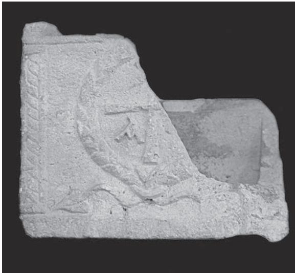
Sl. 32 - Rab, Sv. Ivan Evanđelista, relikvijar