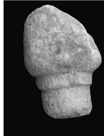
Sl. 37 - Supetarska Draga, stupić sa zaobljenim završetkom