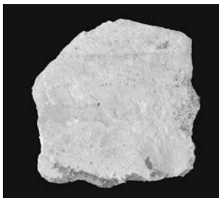
Sl. 36 b - Supetarska Draga, gornja ploha kapitelica