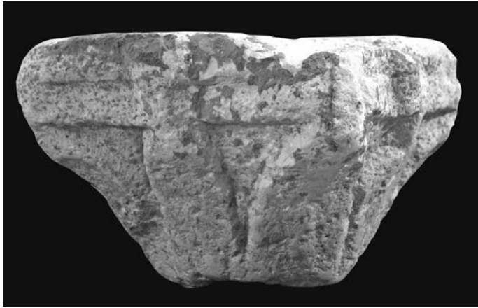
Sl. 36 a - Supetarska Draga, kapitelic