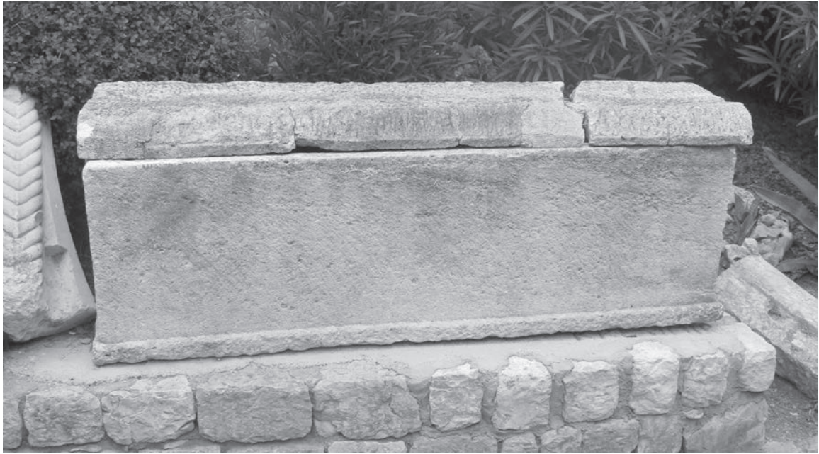
Sl. 64 - Rab, sarkofag ispred lapidarija

djelovala tek od sredine 6. st. 170 Čak i kada pojedinačni nalazi unutar sarkofaga mogu biti usko datirani, oni ne moraju nužno datirati i izradu samih sarkofaga. Između izrade i korištenja, čak i prvoga korištenja, moglo je proći i duže vrijeme.