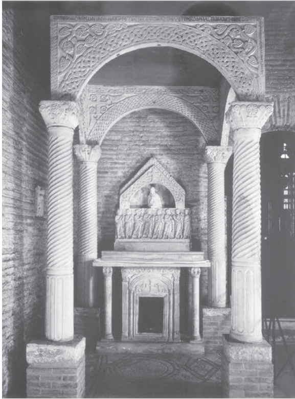
Sl. 88 - Sant'Apollinare in Classe, predromanički ciborij

se kao da su i shvaćeni kao dio ornamenta. Na druge dvije arkade isklesani su samo apstraktni motivi pletera. Takva dekoracija četverostraničnog ciborija iz Sv. Marte posve odgovara njegovoj dataciji u drugu četvrtinu 9. st. Inače je u literaturi taj ciborij s pravom izdvojen u odnosu na druge ciborije 9. st. s istočne obale Jadrana. 206 Ako kompariramo položaj zoomorfnih i izričito kršćanskih (križ, pentagram) motiva na arkadama rapskog ciborija, čini se da imaju podjednako istaknuto mjesto u odnosu na geometrijski pleter, pa čak i dominiraju u cjelini prikaza. Tako na arkadi s dva pleterna pojasa, zoomorfni i simbolički prikazi uokvireni su pleternim ornamentom i predstavljaju pravi centar kompozicije. Na arkadi s nizom motiva u četverokutnim i kružnim poljima, taj ukras posve dominira u odnosu na lučni segment s pleternom dekoracijom. Također, i na trećoj sačuvanoj arkadi, dva istovjetna motiva paunova s kantarosom u trokutnim poljima kao da su posebno istaknuta kompliciranim prepletom u gornjem dijelu arkade. Uz ova razmišljanja o motivima na rapskom ciboriju, svakako se treba složiti sa zaključcima o posebnosti tog ciborija u odnosu na druga djela iz Dalmacije i Istre. 207 To je lakše objasniti ako se prihvati rana datacija ciborija u prva desetljeća 9. st., jer se kod kasnijih ciborija iz 9. st. uočava veća uklopljenost u određene sisteme dekoracije što su ih njegovale pojedine radionice na tlu Hrvatske i dalmatinskih gradova.