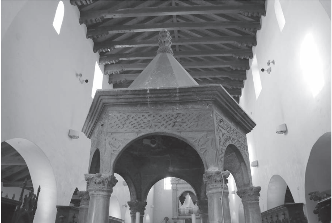
Sl. 83 - Rapska katedrala, ciborij, pogled na predromaničke arkade i pokrov