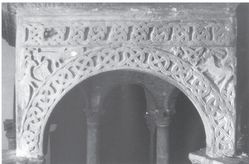
Sl. 85 - Rapska katedrala, predromanička arkada ciborija