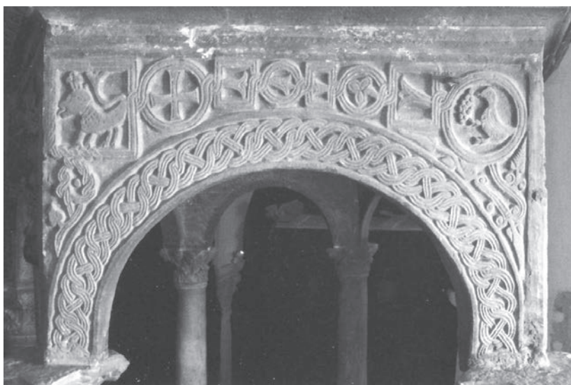
Sl. 86 - Rapska katedrala, predromanička arkada ciborija