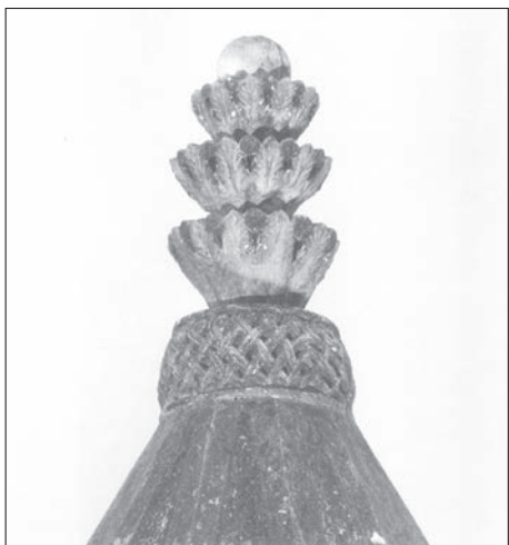
Sl. 90 - Rapska katedrala, akroterij ciborija

današnji vijenac, no o izgledu originalnog gornjeg dijela arkada ciborija nema podataka. Tu su se mogle nalaziti jednostavne kuke, kao najčešći dekorativni motiv na vijencima naših predromaničkih ciborija, ali ne treba isključiti ni mogućnost smještaja natpisa. Isto tako, možda nije bilo istaknutog vijenca, nego su arkade završavale jednostavnom uskom letvom. Što se tiče današnjeg vijenca, zanimljivo je kako se on prikazivao u literaturi. Na crtežu ciborija koji je objavio D. Frey, na vijencu su, iznad predromaničkih arkada, nacrtani ornamentalni nizovi akantusa, astragala i ovula (Sl. 89). 212 Na crtežu, pak, u knjizi R. Eitelbergera, na vijencu nema nikakvih ornamenta. 213 Oba crteža predočavaju stranu s predromaničkim arkadama. Međutim, „posebnosti“ na crtežima ciborija time nisu iscrpljene. Dok D. Frey donosi točan raspored arkada, na crtežu W. Zimmermanna u Eitelbergerovoj