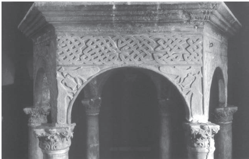
Sl. 84 - Rapska katedrala, predromanička arkada ciborija