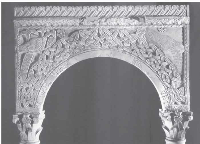
Sl. 87 - Sv. Marta u Bijačima, arkada ciborija

Predromaničke arkade u cjelini djeluju harmonično i predstavljaju dobar klesarski rad s lijepo raspoređenim motivima. Ostvarena je i raznolikost u izboru motiva. Premda s jednostavno koncipiranim ukrasom, arkade nisu monotone nego pobuđuju na promatranje svakoga pojedinog motiva. Tropruta pleterna ornamentika na njima je potpuno ostvarena, što upućuje na dataciju poslije tzv. prijelazne faze formiranja pletera tijekom druge pol. 8. st. Skladno komponirani zoomorfni i vegetabilni motivi također upućuju na vrijeme nakon kraja 8. st. U komparaciji sa sigurno datiranim Mauricijevim ciborijem i nizom italskih ciborija iz 8. st., 203 iskazuju se različitosti koje govore o nešto kasnijoj izradi rapskoga ciborija. Usporedba, pak, s nekim ciborijima iz prve pol. 9. st. učvršćuje dataciju rapskoga ciborija u to vrijeme. Ovdje se može uputiti na krstionički ciborij iz pulske katedrale i na oltarni ciborij iz crkve sv. Felicite, također iz Pule. 204 Općom jednostavnom koncepcijom rasporeda ornamentalnih motiva, ti ciboriji podsjećaju na rapske arkade. Razlike se očituju u većoj gustoći motiva na pulskim ciborijima, na kojima nisu zastupljeni zoomorfni motivi dok na rapskom ciboriju imaju istaknuto mjesto. Na rapskome ciboriju zoomorfni motivi imaju izrazito simboličko značenje, a takva koncepcija je dodatno naglašena uvođenjem izrazitih kršćansko-simboličkih motiva križa i pentagrama. Isticanje sadržajne komponente, značenja motiva, približava