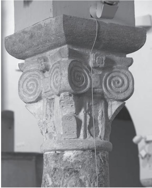
Sl. 93 - Rab, katedrala, predromanički kapitel

Prerirali različite spomenike s navedenim ornamentom, on je osobito prisutan u ranije predromaničko doba, što učvršćuje ranu dataciju rapskog pilastra. 220