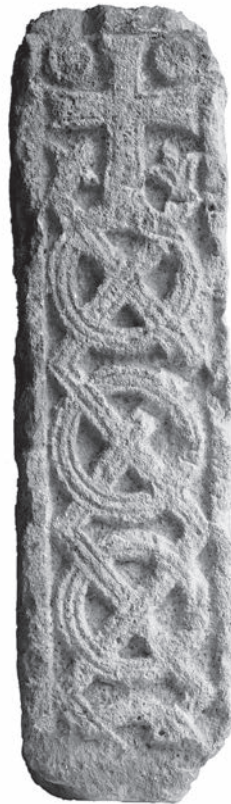
Sl. 92 - Pilastar iz katedrale