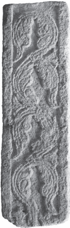
Sl. 91 - Pilastar iz katedrale