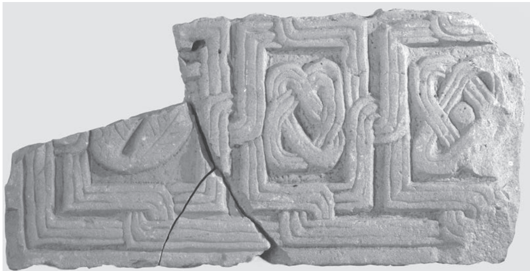
Sl. 98, Rab, lapidarij, fragmentarni plutej