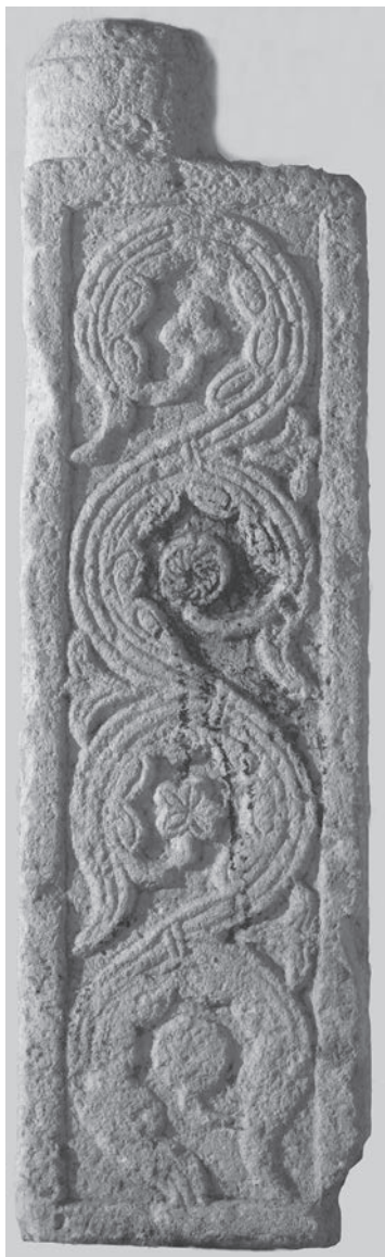
Sl. 94, Rab, lapidarij, pilastar iz Sv. Martina

Katedralni pilastar s vegetabilnom viticom vrlo je sličan pilastru iz rapskoga lapidarija koji potječe iz porušene crkvice sv. Martina (Sl. 94, Kat. br. 43). Ovaj pilastar je, za razliku od onoga iz katedrale, cjelovito sačuvan s početkom stupa na gornjoj