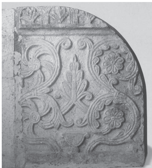
Sl. 95 - Plutej iz Božave