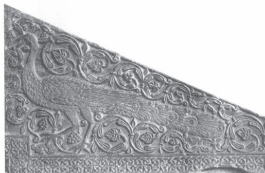
Sl. 96 - Brescia, ploča ambona

nje stabalce i kantaros. Uz motiv sitnih listića, na pluteju iz Božave u vitici se nalaze i virovite rozete (Sl. 95). Pluteji su ispravno povezani s ranosrednjovjekovnom radionicom crkvenog namještaja iz Zadra, 230 što potpuno potvrđuju noviji nalazi. Posebno je važan nalaz vrlo oštećenog pluteja u samome Zadru. 231 Na novopronađenom pluteju iz središnjeg kantarosa izviru dvije troprute vitice s grozdovima i pticama u zavijucima i s virovitim rozetama. Iako nema motiva sitnih listića unutar zavijutaka, jasna je ista ikonografska shema i isto porijeklo opisanih pluteja. Oni jasno pokazuju inspiraciju starokršćanskim djelima, bilo mozaicima bilo kamenim spomenicima, i svjedoče o kontinuitetu klesarskih radionica u dalmatinskim gradovima od kasne antike do srednjovjekovlja. 232