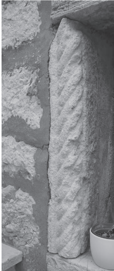
Sl. 97 a - Rab, arhitektonski ulomak, sekundarno uzidan na položaju predromaničke crkve sv. Martina