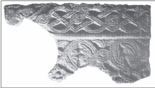
Sl. 103, a - Osora, ulomak pluteja