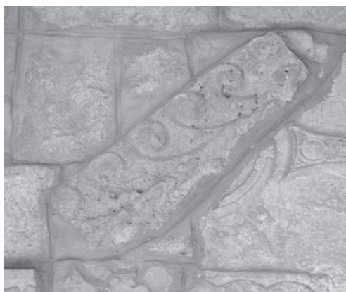
Sl. 107 - Kampor, ulomak grede s kukama

području, u Privlaci, govori o mogućnosti izrade kamporskog pluteja u zadarskim klesarskim radionicama, odnosno o povezanosti otoka Raba sa zadarskim radionicama, o čemu svjedoče i drugi primjeri još iz kasnoantičkoga doba, spomenuti u ovome radu. Kamporski plutej treba datirati u ranije predromaničko doba, najvjerojatnije u početak 9. st.