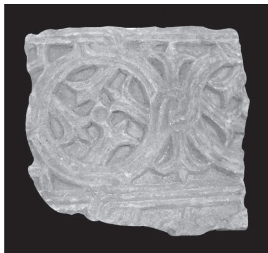
Sl. 105 Dubrovnik, ulomak pluteja

Vezano uz dataciju pluteja iz osorske katedrale, zanimljivo je upozoriti na povijesne podatke o djelovanju osorskog biskupa potkraj 8. st. S obzirom, pak, na razvoj klesarstva, druga pol. 8. st. je vrijeme intenzivnoga klesarskog rada kada nastaju brojni spomenici na mnogim lokalitetima. Kompleks osorske katedrale korišten je, inače, tijekom cijeloga ranog srednjeg vijeka, a i u kasnijim stoljećima. 256 Na temelju stilskih karakteristika sačuvanih ulomaka namještaja, može se pretpostaviti da je vjerojatno krajem 8. st., u vrijeme novoga stvaralačkog procvata klesarske djelatnosti diljem jadranskih obala, došlo do izrade nove oltarne pregrade za osorsku katedralu. U to vrijeme osorska crkva imala je sigurno važnu ulogu, što na svojevrsan način