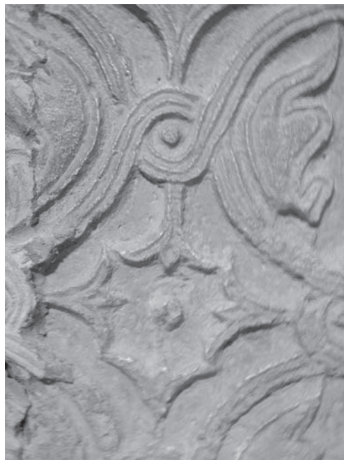
Sl. 104 - Kampor, detalj predromaničkog pluteja

osmišljen nezavisno od eventualnoga posrednog oblika zapaženog u Novigradu. Evidentna omiljenost motiva virovitih ljiljana na spomenicima iz ranoga predromaničkog razdoblja svakako je u osnovi rjeđe zastupljenog motiva tzv. kazeta od ljiljana, koji obilježava pluteje iz Osora i Raba, a u Novigradu nije zabilježen. Važnost Novigrada u razmatranju ovoga motiva proizlazi iz posebnog položaja toga grada u ranijem predromaničkom razdoblju, kada je u njemu bila izuzetno živa klesarska djelatnost. O tome svjedoče brojni spomenici, najvjerojatnije djela novigradske klesarske radionice koja je izrađivala crkveni namještaj za šire područje Istre i Kvarnera. 247