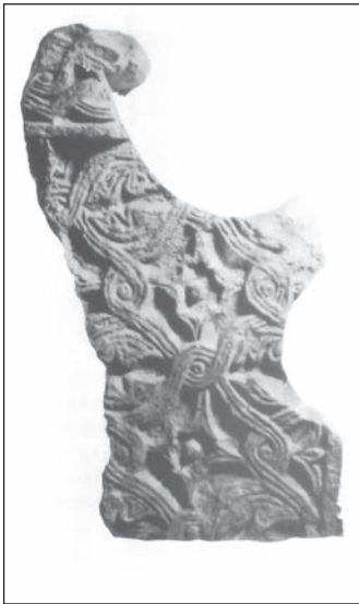
Sl. 103 b - Osora, ulomak pluteja

listovima, nalazi se na jednom od pilastara iz katedrale. Cjelina kompozicije na pluteju, međutim, originalna je i vrlo rijetko prisutna na istočnoj obali Jadrana. Identična kompozicija nalazi se, kako je spomenuto, samo na ulomcima pluteja iz Osora, kojima treba pridružiti i jedan ulomak iz Privlake u sjevernoj Dalmaciji. 243 Takav uvid pruža objavljena ranosrednjovjekovna građa, pa je moguće da se u muzejskim depoima čuva još poneki istovjetan spomenik. 244 U svakom slučaju, s