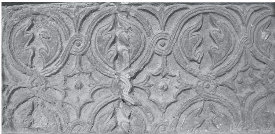
Sl. 100 - Kampor, predromanički plutej

Najcjelovitije sačuvan plutej na otoku Rabu nalazi se u kompleksu samostana sv. Eufemije u Kamporu. Spomenik je i danas u funkciji pluteja ugrađen ispred kapele Grčke Gospe u crkvi sv. Bernardina. Plutej iz Kampora nije sačuvan u cijeloj dužini, a kako mu je i današnja sačuvana dužina velika, pripada među veće predromaničke pluteje na istočnoj obali Jadrana (Sl. 100, Kat. br. 46). Izrađen je od vapnenca. Sačuvana dužina pluteja iznosi 132 cm. Danas vidljiva visina iznosi 61 cm. Debljina je oko 10-ak cm. I svojom dužinom i visinom plutej je bio veći od današnjih dimenzija. U prilog veće izvorne