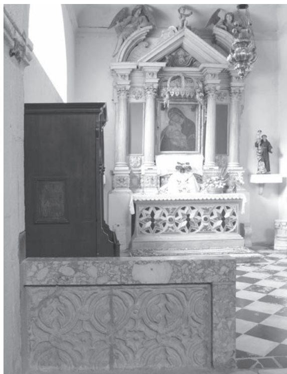
Sl. 102 - Kampor, crkva sv. Bernardina, oltarna pregrada s kopijom pluteja

Kamporski plutej pretrpio je određena oštećenja. U donjem dijelu ima vidljivu pukotinu. Pošto je dugo služio kao nadgrobna ploča s ukrašenom stranom okrenutom prema zemlji, razumljivo je da postoje oštećenja, koja, s obzirom na takve okolnosti, i nisu velika. 242 Klesarije u gornjem dijelu pluteja (gornji red kružnih medaljona) dobro su sačuvane. Polovično vidljiv donji red kružnih medaljona prilično je oštećen. U tom dijelu reljefi su na nekim mjestima otučeni i oštećeni. Možda su oštećenja nastala prilikom prenamjene pluteja u nadgrobnu ploču. Budući da tada ornamentika ploče nije pobuđivala nikakvo zanimanje, možda je slučajno oštećen dio reljefa. Kasnije je možda kod povremenih otvaranja grobnice, također moglo doći do oštećenja. S obzirom na takve okolnosti, reljef je prilično dobro sačuvan i svjedoči o klesarskoj vještini majstora koji ga je izradio. Uočavajući vjerojatno vrijednost predromaničkog rada, kod njegovog postavljanja u malu oltarnu pregradu koja i danas postoji, izrađen je faksimil i postavljen s druge strane prolaza (Sl. 102).