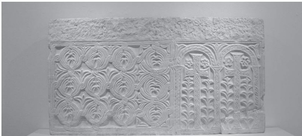
Sl. 106 - Kotor, predromanički plutej