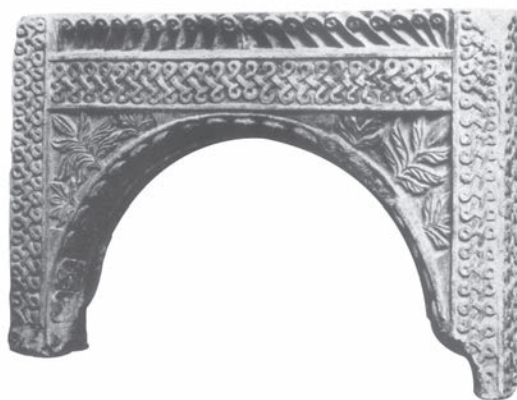
Sl. 120 - Brescia, arkada ciborija

razdvajati u dva različito usmjerena niza. One su, međutim, sve okrenute na istu stranu, sa zavojnicama koje gledaju na lijevo. Kod ranih predromaničkih spomenika poznata su različita odstupanja, pa se tako kuke mogu naći i niže od rubnog pojasa, unutar arkade. Na jednom reprezentativnom spomeniku, arkadi ciborija iz Brescije, kuke su smještene na standardnom mjestu i izrađene u dva odvojena niza, ali specifično usmjerena. 288 Zavojnice su u oba niza okrenute prema sredini arkade, što predstavlja odstupanje od standardne izvedbe rubnih kuka na arkadama ciborija (Sl. 120). Isto tako, među arkadama ciborijâ može se naći poneki primjer za usmjerenost kuka u samo jednom pravcu, kao na ulomku iz Supetarske Drage.