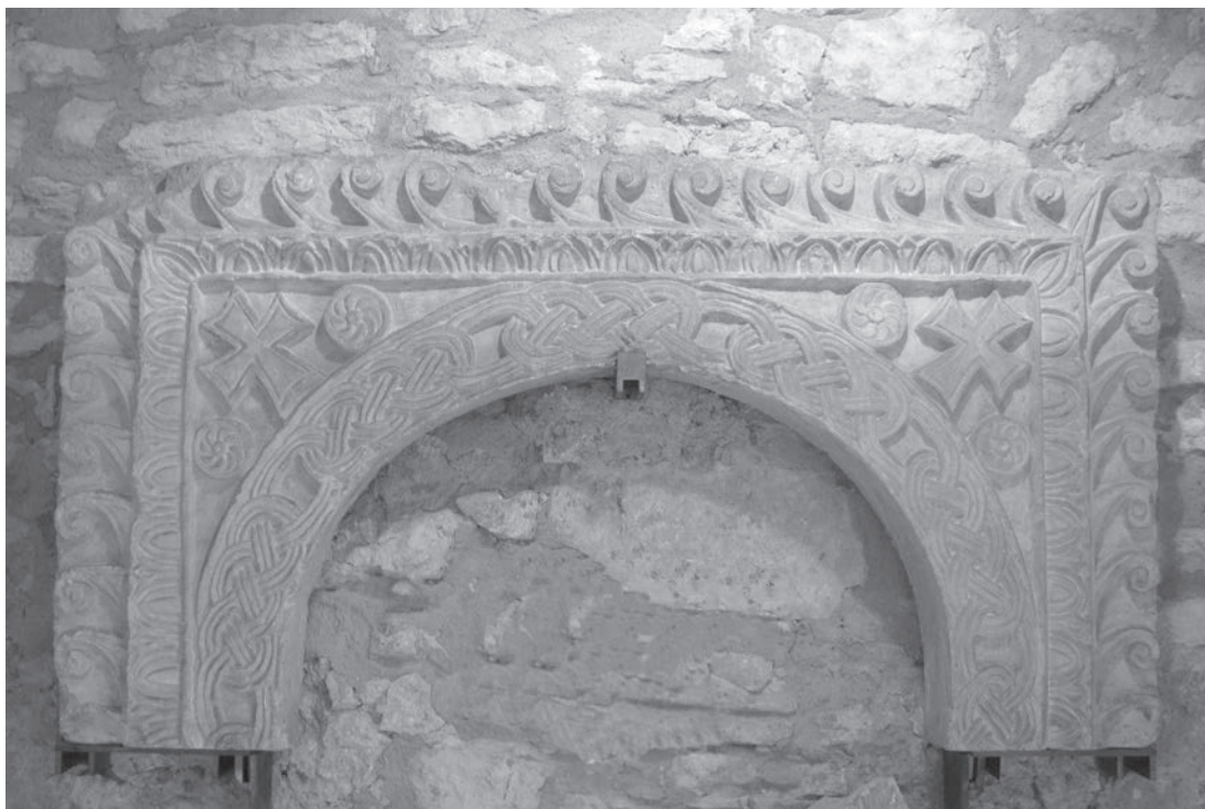
Sl. 121 - Valpolicella, arkada ciborija

Arkada iz Valpolicelle ima svoje mjesto u raspravama o počecima pleterne ornamentike u Italiji. Kojem je ciboriju ona pripadala i kako interpretirati postojeći rekonstruirani ciborij na menzi oltara u San Giorgio di Valpolicella, ostaje izvan tematskih okvira