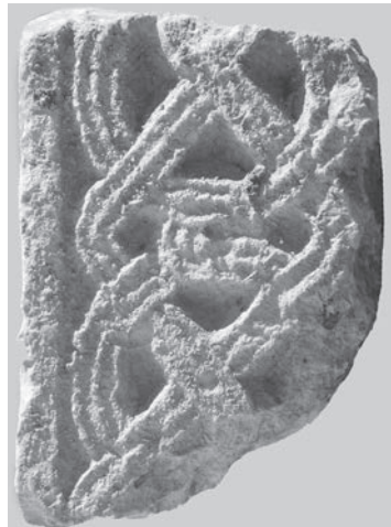
Sl. 123 a - Supetarska Draga, ulomak pilastra