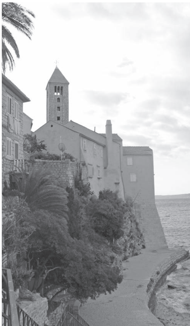
Sl. 125 - Rab, kompleks samostana sv. Andrije