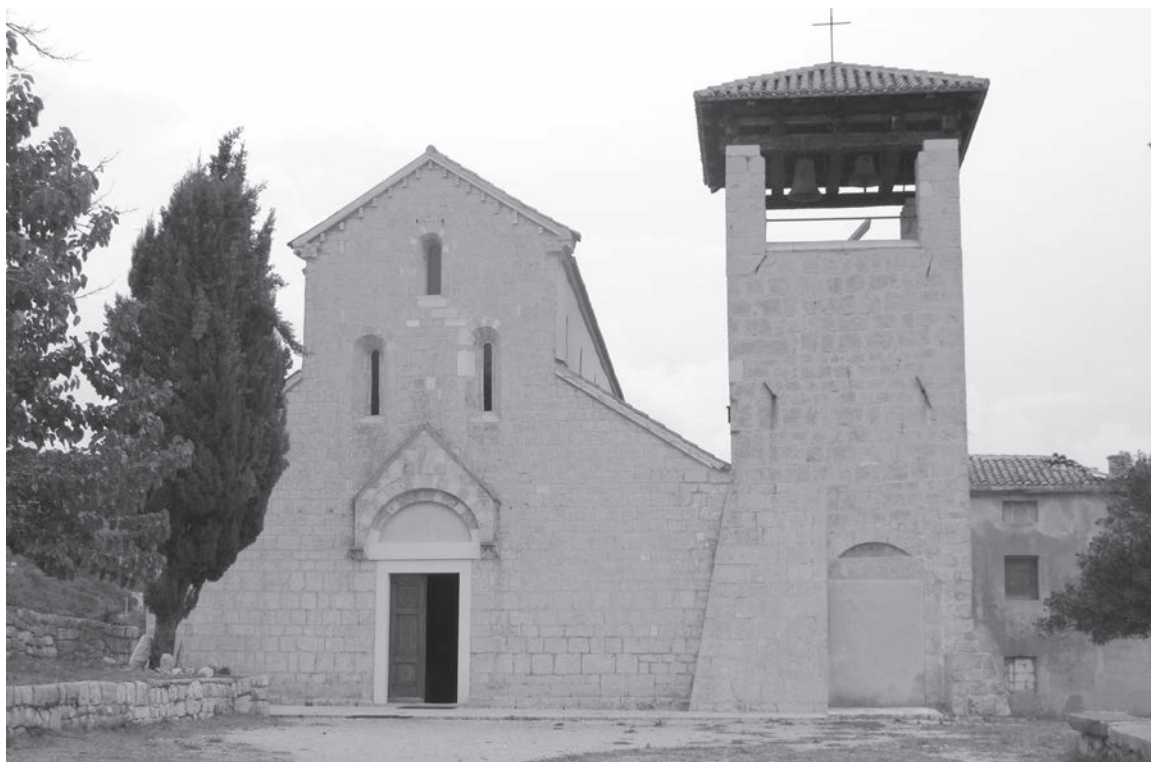
Sl. 116 - Supetarska Draga, Sv. Petar

Ulomak bi se mogao smjestiti u donji dio jedne strane zabata, na što upućuje lučni pojas s kimatijem obrubljen dvjema plastičnim trakama (Sl. 118). Taj pojas bi odgovarao lučnom dijelu zabata, premda je motiv kimatija prilično neobičan za taj dio zabata u kojem se najčešće nalazi neki jednostavni pleterni motiv poput pletenice. U donjem lučnom pojasu zabata mjesto je također za natpis, ukoliko je oltarna pregrada obogaćena i natpisima. Sam motiv kimatija na zabatima oltarnih pregrada pojavljuje se tijekom razvijene predromaničke faze, u pravilu od sredine 9. st. Njegovo mjesto nije uz lučni izrez nego uz rubne kuke, gdje, u bogatijoj predromaničkoj dekoraciji zabata, čini drugi dekorativni pojas koji omeđuje središnju kompoziciju u trokutastom polju zabata.