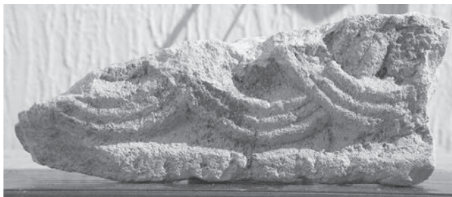
Sl. 124 - Supetarska Draga, ulomak pluteja

Od drugoga pilastra sačuvana su dva ulomka (Sl. 123, Kat. br. 55). Taj je bio ukrašen tipičnim motivom troprutih kružnica ispresijecanih dijagonalama. Još jedan ulomak iz Supetarske Drage zbog znatno manje debljine od prethodnih ulomaka, vjerojatno pripada pluteju (Sl. 124, Kat. br. 56). Djelomično je sačuvan motiv troprutih zaobljenih traka koje se presjecaju.