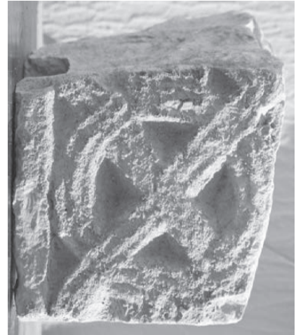
Sl. 123 b - Supetarska Draga, ulomak pilastra

ove knjige. 289 Analogija za položaj kuka koje su isklesane u jednome smjeru važna je za interpretaciju ulomka iz Supetarske Drage, čija ikonografska rješenja, iako rijetka, ipak nisu posve usamljena.