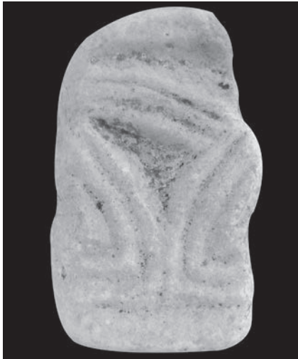
Sl. 115 - Rab, lapidarij, mramorni ulomak

rada. 284 Motiv križa s palmetama možda je najrasprostranjeniji u okviru tzv. trogirске klesarske radionice iz prvih desetljeća 9. st., kada se susreće na plutejima na većem broju lokaliteta, kako na obali tako i u dalmatinskom zaleđu. 285