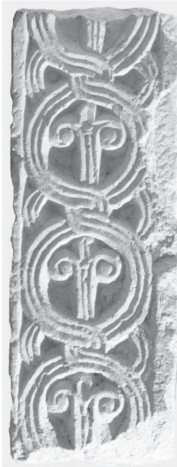
Sl. 122 - Supetarska Draga, fragmentarni pilastar