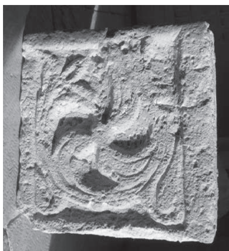
Sl. 126 - Rab, samostan sv. Andrije, ulomak crkvenog namještaja

U crkvi su, u istaku na južnom zidu, uzidani ostaci triju pilastara (Sl. 127, Kat. br. 58). Dva mramorna ulomka u donjem dijelu istaka predstavljaju dijelove dvaju pilastara. Ukrašeni su