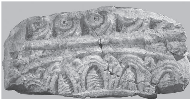
Sl. 117 - Supetarska Draga, ulomak ciborija

Fragment iz Supetarske Drage dobro se uklapa u središnji prostor arkade ciborija (Sl. 119). Ulomak popunjava tjemeni dio arkade, od vrha lučnog izreza do gornjega ruba arkade. Uz oštećene zavojnice kuka mogla bi se postaviti i završna rubna letva kao gornji završetak arkade ciborija. Raspored ornamentalnih pojaseva nije tipičan niti za arkadu ciborija, međutim, svi ornamentalni motivi na ulomku pojavljuju se na arka-