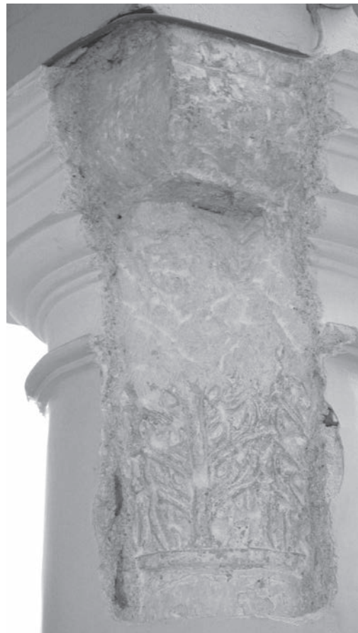
Sl. 148, Sv. Andrija, kapitel na 4. južnom stupu