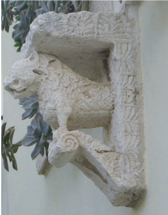
Sl. 178 - Rab, Konzola