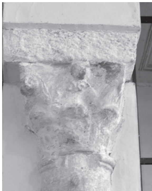
Sl. 140 - Rab, katedrala, kapitel na južnom polustupu

katedrale u odnosu na druge crkve, upućuje na vjerojatnu ranu dataciju kapitela iz katedrale. To također osnažuju i stilske karakteristike kapitela iz katedrale. Ukoliko se, naime, veća plastičnost akantusovih listova na ranoromaničkim kapitelima na Rabu pripisuje nešto kasnijem vremenu njihova klesanja, onda bi plošni i izrazito stilizirani akantus na kapitelima iz katedrale mogao upućivati na ranije vrijeme izrade tih kapitela. 307 U odnosu na kapitele iz Akvileje, 308 kapiteli iz rapske katedrale znatno su više stilizirani i udaljeni od antičkog prototipa. Kod obje grupe kapitela raspored