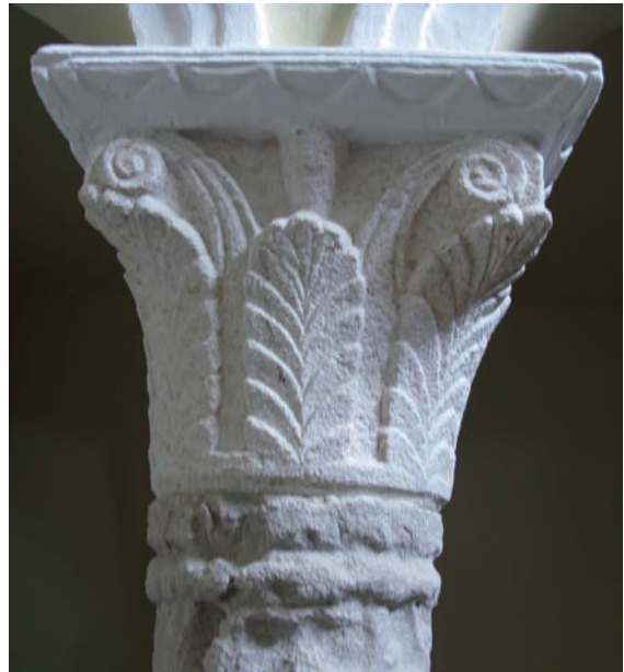
Sl. 172 - Rab, Sv. Justina, kapitel na lijevom stupu pjevališta

upozoriti na plošan tretman listova palmeta i ugaonih voluta. 328 Ti dijelovi kapitela klesani su posve u stilu drugih rapskih palmetnih kapitela s kompaktnim priljubljenim palmetama plošnog izgleda. I detalji izrade posve odgovaraju drugim kapitelima od vapnenca. Možda se male središnje volute preko istaka mogu protumačiti svojevrsnim radioničkim (majstorskim) potpisom kojim je klesar označio svoj rad, jedinstven među rapskim, ali i drugim ranoromaničkim kapitelima s palmetama. 329 Zaključno, zasada se kapitel može šire datirati u drugu pol. 11. st., a s mogućim detaljnijim podacima bit će možda moguća i uža datacija.