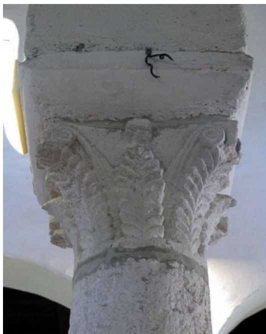
Sl. 153 - Supetarska Draga, Sv. Petar, kapitel na 4. sjevernom stupu