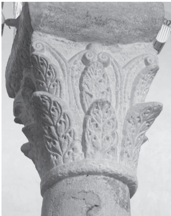
Sl. 137 - Rab, katedrala, kapitel na 1. južnom stupu