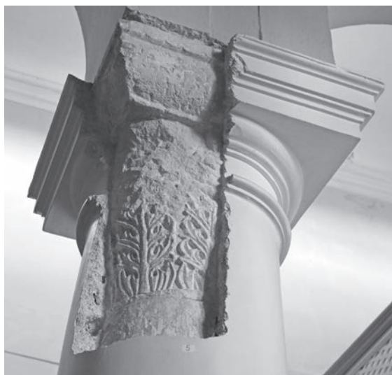
Sl. 143, Sv. Andrija - kapitel na 2. sjevernom stupu