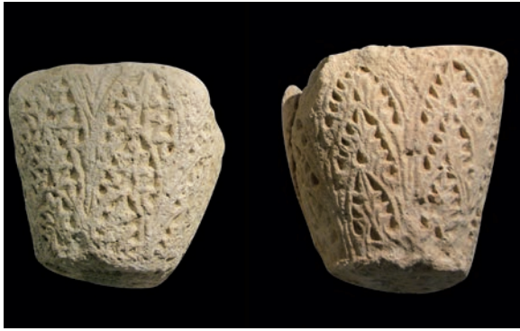
Sl. 174 - Nin, Arheološka zbirka, kapiteli iz Sv. Marije

klasičnih voluta na korintskim kapitelima. Plošno klesane palmete imaju u donjem dijelu svrdlane rupice, inače karakteristične za oblikovanje akantusa na ranosrednjovjekovnim kapitelima. Klesar je tako malo modificirao klasičnu palmetu, čestu na rapskim ranoromaničkim kapitelima, vjerojatno zato da unese kontrast i dinamiku u izrazito odmjerenu dekoraciju kapitela. Raspored ornamenta inače posve odgovara kasnoantičkim kapitelima s glatkim ugaonim listovima i trolistima,