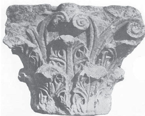
Sl. 164 - Zadar, kapitel iz crkve sv. Marije Velike

je vrlo slična, a slično je i postavljanje voluta samo u uglovima kapitela, dok središte gornje zone zauzima naglašeni istak. Dok su stapke voluta na kapitelima iz Sv. Ivana Evanđelista tropruto raščlanjene, na kapitelima iz Sv. Marije Male stapka voluta ima kompaktan široki volumen, a zavojnice su višestruko raščlanjene i slične onima na rapskim kapitelima. Budući da su i kapiteli iz Sv. Marije Male usko datirani u vrijeme neposredno prije posvete same crkve, 322 time se dobiva još jedno uporište za dataciju srodnih rapskih kapitela u kraj 11. st. Na temelju zadarskih analogija, kao i razvojnog tijeka oblikovanja kapitela u rapskim crkvama, kapitele iz Sv. Ivana Evanđelista datiramo u kraj 11. ili prva desetljeća 12. st. 323 Oni su u umjetničkom pogledu najljepši i najrazvijeniji ranoromanički kapiteli na Rabu. Potpora ovakvome datiranju ne može se, nažalost, naći u literarnim izvorima za samostan i crkvu sv. Ivana Evanđelista, jer osim izvora o utemeljenju samostana sv. Petra u Supetarskoj Dragi 1059. g. (čime nije datirano uređenje i posvećenje ranoromaničke crkve sv. Petra), za samostane sv. Andrije i sv. Ivana u gradu Rabu nema izvora iz 11. i ranog 12. st. 324 Ti su samostani, međutim, sigurno utemeljeni u 11., ili u slučaju samostana sv. Ivana, možda u ranom 12. st., o čemu svjedoči arhitektura njihovih crkava, arhitektonska plastika i nalazi crkvenog namještaja koji se povezuju uz samostanske crkve.