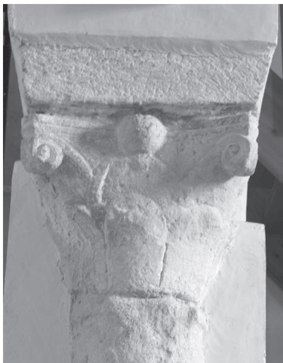
Sl. 139 - Rab, katedrala, kapitel na sjevernom polustupu