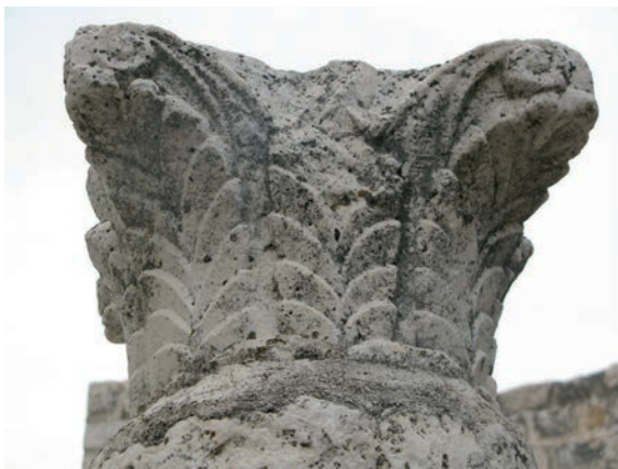
Sl. 163 - Sv. Ivan Evanđelist, deambulatorij, kapitel na 6. stupu

crkve sv. Ivana Evanđelista. 319 Taj kapitel iz Sv. Marije Velike zaista je vrlo srodan kapitelima s akantusom iz Sv. Ivana Evanđelista. 320 Srodnost je posebno istaknuta kod oblikovanja listova, dok se volute ponešto razlikuju. Kapiteli iz Sv. Ivana Evanđelista nemaju središnje volute, a ugaone počivaju na trostruko segmentiranoj nozi. Oblik voluta kapitela iz Sv. Marije Velike sličan je volutama kapitela s akantusom iz rapske katedrale i iz Sv. Petra u Supetarskoj Dragi. Sve to govori da se neki detalji oblikovanja zadržavaju kroz dulje vrijeme, tijekom