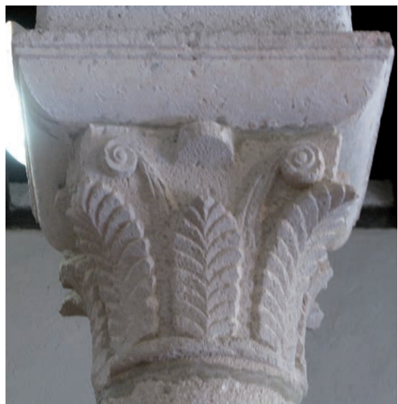
Sl. 152 - Supetarska Draga, Sv. Petar, kapitel na 2. južnom stupu

Kod palmetnih kapitela iz Supetarske Drage upadljivo je nestajanje jasno odvojenog abakusa. Stoga je središnji istak spušten prema glavnom dekorativnom motivu palmete i, kod nekih primjeraka, dobiva posebna ornamentalna obilježja. Istak se, za razliku od položaja na sredini abakusa, nalazi zapravo između ugaonih voluta i donekle zauzima mjesto središnjih voluta, koje su, možda zbog ovih promjena, izostavljene. Ova se pojava dalje može pratiti na kapitelima iz crkve sv. Ivana Evanđelista.