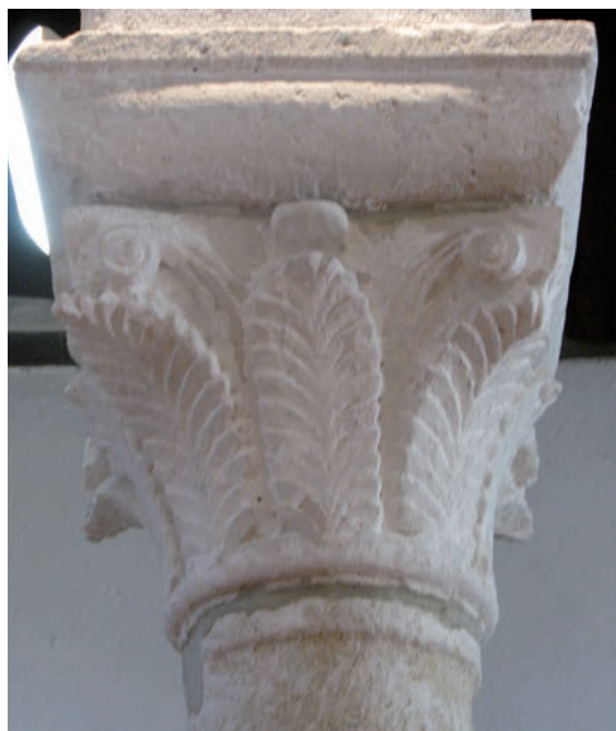
Sl. 154 - Supetarska Draga, Sv. Petar, kapitel na 4. južnom stupu