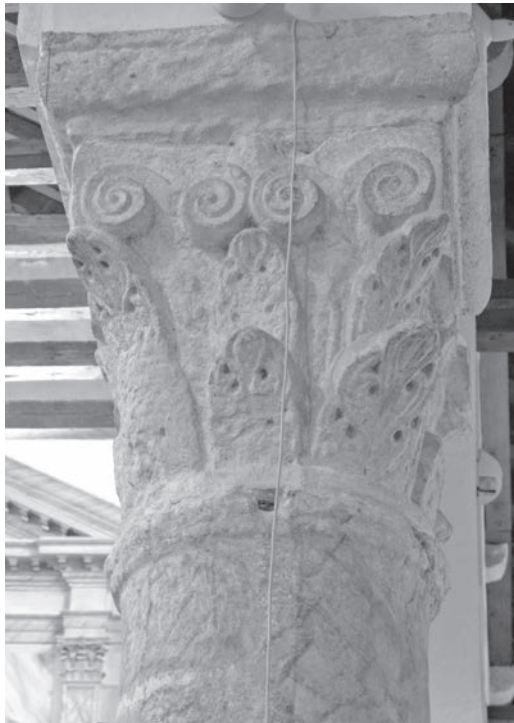
Sl. 135 - Rab, katedrala, kapitel na 3. sjevernom stupu