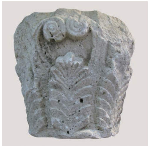
Sl. 167 - Rab, lapidarij, izvorno iz Sv. Ivana Evandelistista

palmetama u deambulatoriju Sv. Ivana Evandelistista. Drugi palmetni kapitel iz lapidarija (Sl. 167, Kat. br. 92) ukrašen je velikim palminim listovima koji se uzdižu od baze kapitela do njegove gornje trećine. Iznad palmeta su volute s velikim zavojnicama. Kapitel je djelomično otučen i izdubene unutrašnjosti.