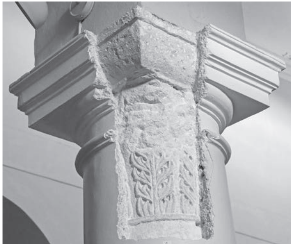
Sl. 147, Sv. Andrija - kapitel na 4. sjevernom stupu

To je možda dovelo do koncentracije klesara na izvedbu akantusovih listova, vrlo lijepo oblikovanih, s određenom realističkom crtom. Vrhovi listova izdvajaju se iz ravnine plohe i strše u prostoru. Po četiri rupice oblikovane između sitnih listića daju osnovnu formu svakome listu. Akantus na ranoromaničkim kapitelima iz Sv. Petra bliži je antičkim prototipovima od stiliziranog akantusa na kapitelima iz rapske crkve sv. Andrije. Palmete na prevladavajućim palmetnim kapitelima iz Sv. Petra u Supetarskoj Dragi također se razlikuju od onih iz crkve sv.