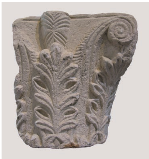
Sl. 168 - Rab, lapidarij, kapitel izvorno iz Sv. Ivana Evanđelista