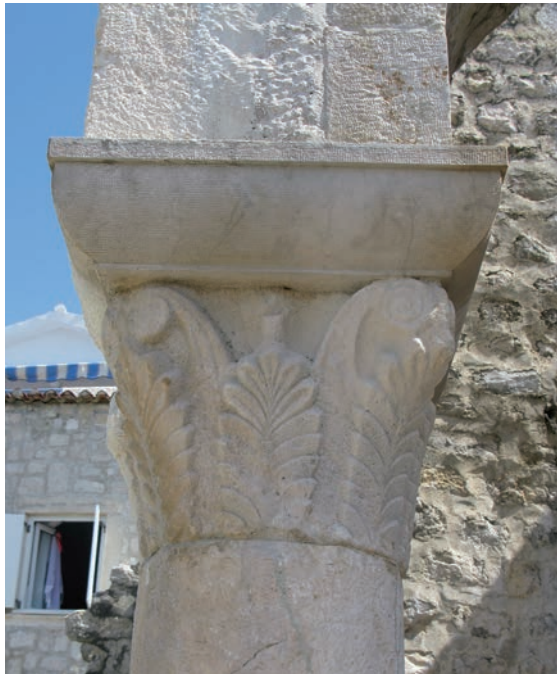
Sl. 158 - Sv. Ivan Evanđelista, deambulatorij, kapitel na 1. sjevernom stupu