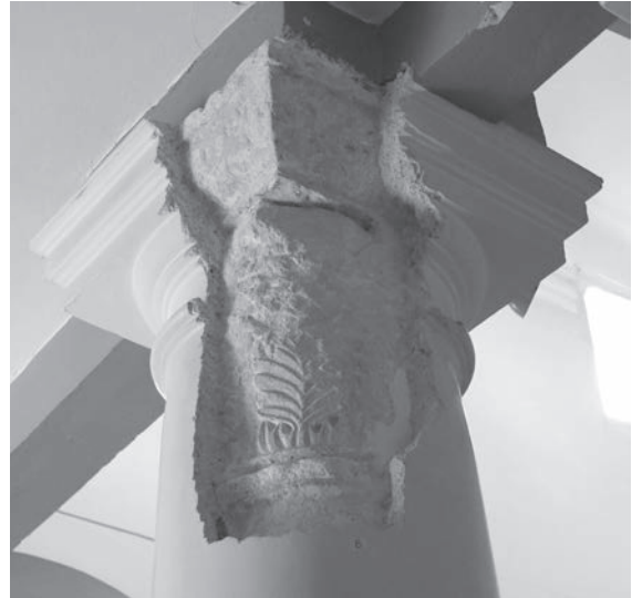
Sl. 142, Sv. Andrija - kapitel na 1. južnom stupu

unutarnjih ( helices ) i vanjskih voluta je podudaran. Dok akvilejski primjerci imaju, iako transformirane, klasične stalke ( caules ), na rapskim ranoromaničkim kapitelima oni su izostavljeni. Očito se nisu mogli uklopiti u krajnje stiliziranu dekoraciju u kojoj jedine elemente čine pravilni izduženi listovi (znatno udaljeni od antičkog akantusa) i volute u gornjem dijelu tijela kapitela. Na dobro sačuvanim kapitelima iz rapske katedrale volute imaju duge drške koje se pružaju do donjeg reda listova - međutim, te drške nemaju donji dio karakterističan za antičke korinthske kapitele. Sama forma listova na rapskim kapitelima udaljenija je od antičkog prototipa u odnosu na lisnatu formu u Akvileji. Sve to upućuje da su akvilejski kapiteli, bliži antičkim prototipovima, stariji od rapskih kojima su mogli poslužiti kao uzor.