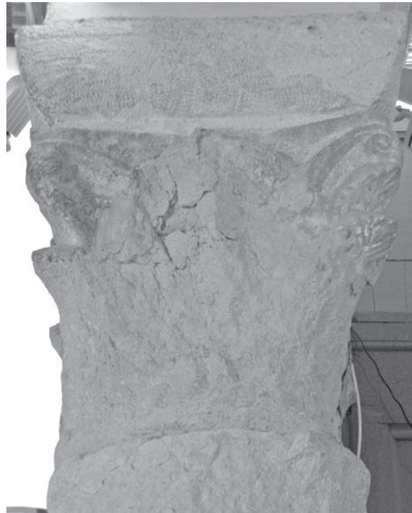
Sl. 136 - Rab, katedrala, kapitel na 5. sjevernom stupu

Danas je u rapskoj katedrali in situ sačuvano 5 ranoromaničkih kapitela. Ako se tome pridruže i dva kapitela na polustupovima na ulazu u crkvu, ukupan broj je 7 kapitela. Kapiteli na polustupovima ponešto se razlikuju u svojoj dekoraciji od ostalih kapitela na stupovima dviju kolonada. Ovi pak kapiteli na stupovima rapske katedrale imaju zajednička temeljna obilježja iz kojih proizlazi zaključak o njihovoj istovremenoj izradi i ugledanju na isti prototip.