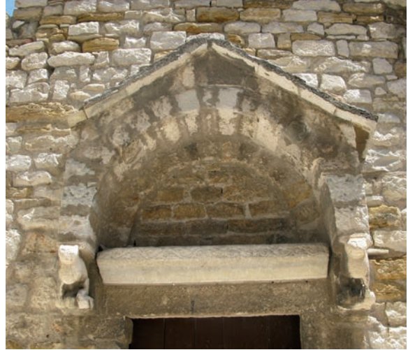
Sl. 179 - Split, Sv. Nikola, dio portala

Oblici slova na nadvratniku iz Sv. Ivana Evanđelista nalaze se kako na predromaničkim tako i na ranoromaničkim natpisima. 360 Ipak, može se ustanoviti češća pojava karakterističnih spojeva slova M i V i A i V na ranoromaničkim natpisima, na kojima susrećemo i oblik slova A sa nadvratnika. 361 Slova na nadvratniku iz Sv. Andrije približno su jednake veličine i lijepog pravilnog oblika. To upućuje na ranoromaničko vrijeme izrade natpisa. Na oba nadvratnika nedostaje ornamentalni ukras. I ovo ih približava ranoromaničkim nadvratnicima druge pol. 11. st. u koje vrijeme se datira nekoliko nadvratnika bez ornamentalnog ukrasa ili s ukrasom u reduciranoj formi, koji predstavlja ornamentalni okvir natpisa. Primjeri su nadvratnik iz Sv. Nikole u Kaštel Starome i nadvratnici iz Sv. Julijane i Sv. Nikole (Mikule) u Splitu. 362