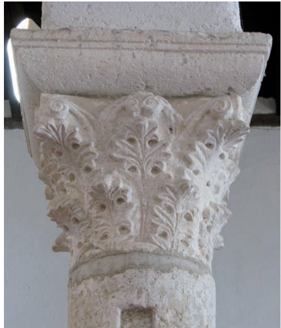
Sl. 150 - Supetarska Draga, Sv. Petar, kapitel na 3. južnom stupu