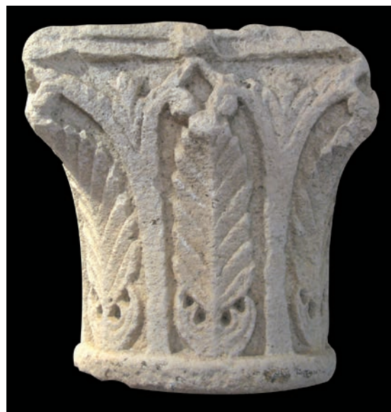
Sl. 173 - Nin, Arheološka zbirka, kapitel iz crkve sv. Marije