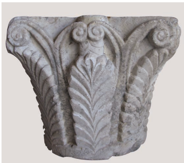
Sl. 170 - Rab, samostan sv. Andrije, kapitel

središnje manje volute, što je posebno obilježje ovog reprezentativnog, izvrsno klesanog kapitela. Ugaone volute, kao i središnje, pružaju se s dvoprute stapke. Listovi su u obliku klasičnih palmeta, kao na palmetnim kapitelima u deambulatoriju Sv. Ivana. Riječ je o zatvorenoj formi sa stepeničasto klesanim malim listićima. Palmete su priljubljene uz kalathos, ali imaju volumen i ističu se, kao i drugi ornamentalni motivi, u odnosu na osnovnu plohu kalathosa. Baš ovaj jedinstveni mramorni kapitel izvrsno pokazuje kvalitetu klesanja te odvajanje i