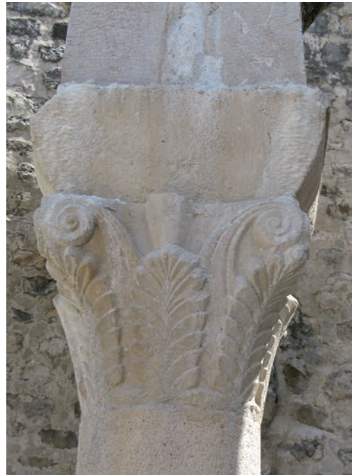
Sl. 159 - Sv. Ivan Evanđelist, deambulatorij, kapitel na 2. stupu sa sjeverne strane

162, Kat. br. 89). Dekoracija ima iste osobine kao na drugom kapitelu iste inačice unutar deambulatorija. Kapitel na šestom stupu pripada palmetnoj inačici (Sl. 163, Kat. br. 90). Istih je obilježja kao drugi palmetni kapiteli deambulatorija. Niz završava, na posljednjem stupu deambulatorija, najbližem romaničkom zvoniku, kasniji kapitel koji je očito zamijenio izvorni ranoromanički primjerak.