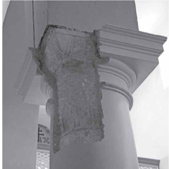
Sl. 146, Sv. Andrija - kapitel na 3. južnom stupu

poznato iz izvora. 313 Dok u samostanskoj crkvi sv. Andrije prevladavaju kapiteli s akantusom, u Supetarskoj Dragi brojniji su kapiteli s palmetama.