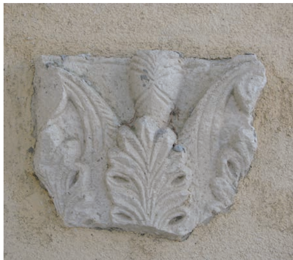
Sl. 169 - Rab, dvorište Muzičke škole, ulomak kapitela

središnje manje volute, što je posebno obilježje ovog reprezentativnog, izvrsno klesanog kapitela. Ugaone volute, kao i središnje, pružaju se s dvoprute stapke. Listovi su u obliku klasičnih palmeta, kao na palmetnim kapitelima u deambulatoriju Sv. Ivana. Riječ je o zatvorenoj formi sa stepeničasto klesanim malim listićima. Palmete su priljubljene uz kalathos, ali imaju volumen i ističu se, kao i drugi ornamentalni motivi, u odnosu na osnovnu plohu kalathosa. Baš ovaj jedinstveni mramorni kapitel izvrsno pokazuje kvalitetu klesanja te odvajanje i