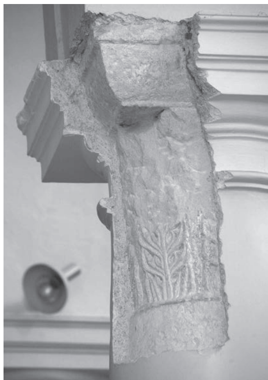
Sl. 144, Sv. Andrija - kapitel na 2. južnom stupu

Drugi par kapitela u crkvi sv. Andrije ukrašen je plitko klesanim akantusom (Sl. 143, 144, Kat. br. 69, 70). Akantus kapitela na 2. stupu sjeverne kolonade (lijevo od ulaza) dosta je dobro sačuvan, iako ne u cijeloj visini. S jedne i druge strane središnje grane (rebra) pružaju se manji listići, odvojeni svrdlanim rupicama. Cijeli je vegetabilni motiv čvrsto priljubljen uz kapitel i plitko klesan. Gornji dio otkrivenog dijela kapitela znatno je otučen. Nasuprotni kapitel, na 2. stupu desno od ulaza, više je otučen. Razabire se identično klesan motiv akantusa.