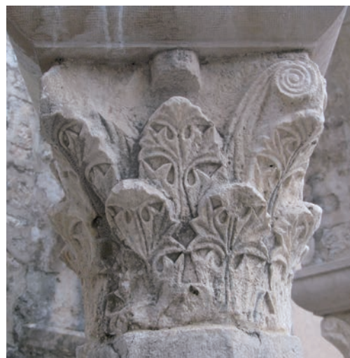
Sl. 160 - Sv. Ivan Evanđelist, deambulatorij, kapitel na 3. stupu sa sjeverne strane