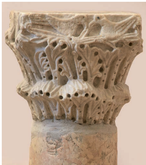
Sl. 180 - Sv. Andrija, kapitel ciborija

O kapitelu je, s obzirom na njegovu kvalitetu i iznimnu umjetničku vrijednost, vrlo malo pisano. 368 U novijoj literaturi tek je nekoliko puta objavljen i ukratko opisan. 369 Svakako treba naglasiti izvrsno usklađen raspored motiva na kapitelu. Ptice u gornjem dijelu neposredno su povezane s biljnim motivom akantusa. U