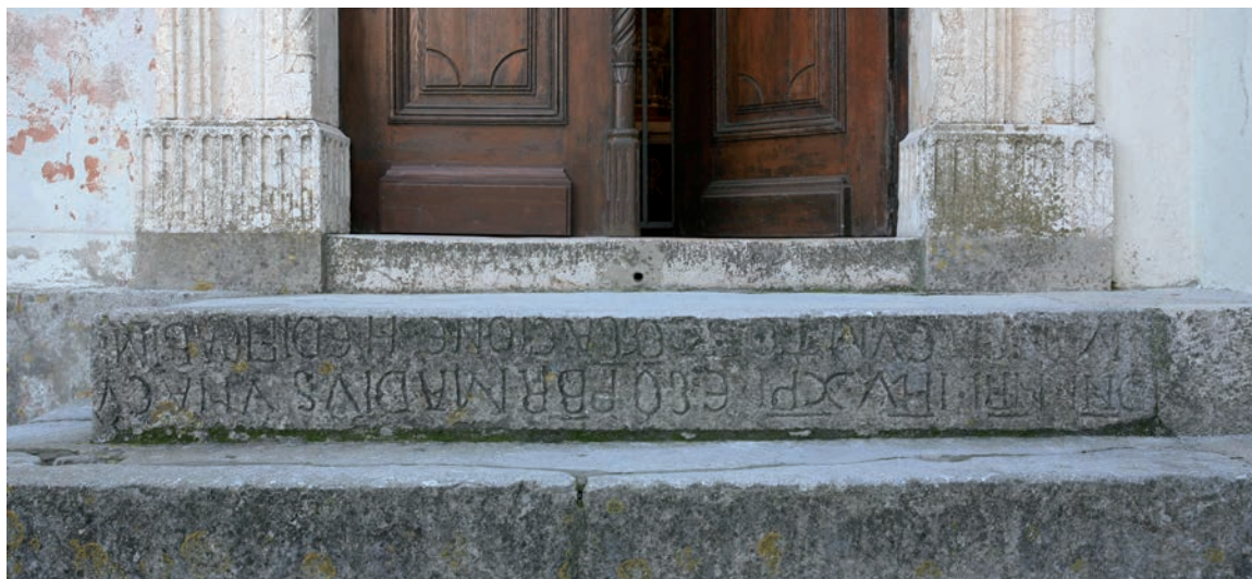
Sl. 177, Sv. Andrija, sekundarno ugrađeni nadvratnik

Na natpisu je sa sadržajne strane osobito zanimljivo pojavljivanje imena Madius . Madije je označen kao svećenik i nositelj radnje. S obzirom na zastupljenost imena u povijesnim izvorima, bilo je moguće predložiti identifikaciju osobe iz natpisa, što je u literaturi i učinjeno. 356 Madius iz natpisa poistovjećen je s istoimenim rapskim biskupom što se spominje u izvoru iz 1018. g. 357 Kako je, međutim, davno primijetio Jackson, ime Madius je vrlo često u ranosrednjovjekovnoj Dalmaciji, 358 te nije dovoljno uporište za dataciju natpisa. Isto tako sam natpis ne daje dovoljno uporište za zaključak da je crkva sv. Andrije građena već 1018. g. Činjenica što je nadvratnik ugrađen ispred crkve sv. Andrije upućuje na mogućnost da joj je izvorno pripadao. Moglo bi se zaista raditi o ranoromaničkom nadvratniku crkve sv. Andrije, okvirno datiranom u 11. st. Pritom ni ranu dataciju oko 1018. g. ne treba potpuno isključiti, ali ona se ne smije smatrati dokazanom na temelju spomena biskupa Madija u povijesnom izvoru. Drugi nadvratnik, iz Sv. Ivana Evanđelista, sigurnije se datira u ranoromaničko doba zbog pripadnosti ranoromaničkom portalu. 359 Ipak, u pogledu datacije oba nadvratnika, važna bi bila paleografska analiza natpisa i usporedba s drugim ranoromaničkim nadvratnicima.