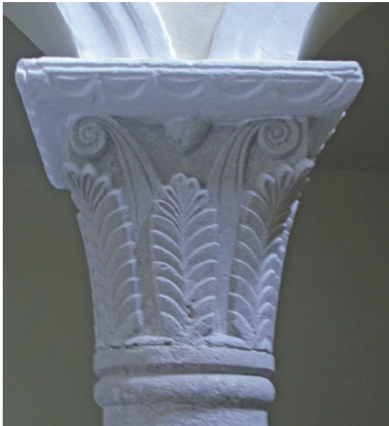
Sl. 171 - Rab, Sv. Justina, kapitel na desnom stupu