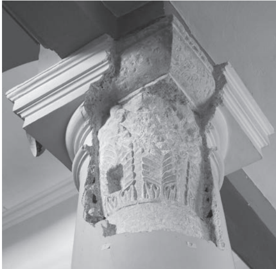
Sl. 141, Sv. Andrija - kapitel na 1. sjevernom stupu