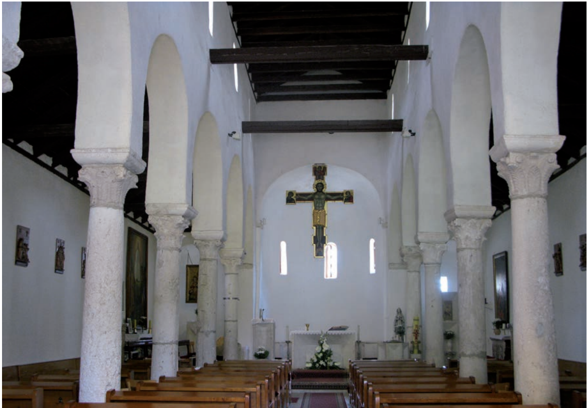
Sl. 157 - Supetarska Draga, Sv. Petar

zahvata. Baze stupova razlikuju se u detaljima raščlambe i visinom, ali ukupan dojam je da su prilično ujednačene. 316