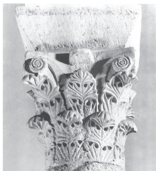
Sl. 165 - Zadar, Sv. Marija Mala, kapitel

Crkvi sv. Ivana Evanđelista pripisuju se i veliki ranoromanički kapiteli pohranjeni u rapskome lapidariju. Riječ je o tri kapitela, od kojih su dva ukrašena motivom palmeta, a jedan akantusovim lišćem. Dobro sačuvani kapitel s palmetama odlikuje se odmjerenošću i skladnim proporcijama ornamentalnih motiva (Sl. 166, Kat. br. 91). Iznad plošno klesanih listova lijepo su oblikovane ugaone volute na tropruto raščlanjenim stapkama. Po motivima i načinu klesanja kapitel je srodan primjercima s