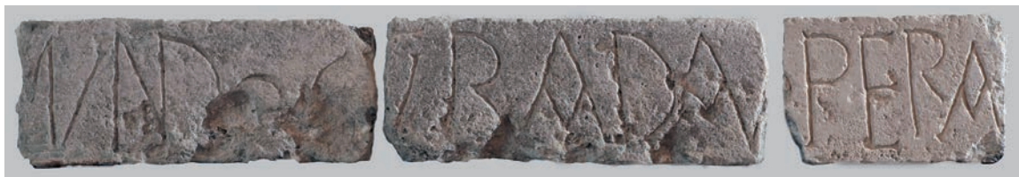
Sl. 176 - Rab, lapidarij, ulomci nadvratnika

Na natpisu je sa sadržajne strane osobito zanimljivo pojavljivanje imena Madius . Madije je označen kao svećenik i nositelj radnje. S obzirom na zastupljenost imena u povijesnim izvorima, bilo je moguće predložiti identifikaciju osobe iz natpisa, što je u literaturi i učinjeno. 356 Madius iz natpisa poistovjećen je s istoimenim rapskim biskupom što se spominje u izvoru iz 1018. g. 357 Kako je, međutim, davno primijetio Jackson, ime Madius je vrlo često u ranosrednjovjekovnoj Dalmaciji, 358 te nije dovoljno uporište za dataciju natpisa. Isto tako sam natpis ne daje dovoljno uporište za zaključak da je crkva sv. Andrije građena već 1018. g. Činjenica što je nadvratnik ugrađen ispred crkve sv. Andrije upućuje na mogućnost da joj je izvorno pripadao. Moglo bi se zaista raditi o ranoromaničkom nadvratniku crkve sv. Andrije, okvirno datiranom u 11. st. Pritom ni ranu dataciju oko 1018. g. ne treba potpuno isključiti, ali ona se ne smije smatrati dokazanom na temelju spomena biskupa Madija u povijesnom izvoru. Drugi nadvratnik, iz Sv. Ivana Evanđelista, sigurnije se datira u ranoromaničko doba zbog pripadnosti ranoromaničkom portalu. 359 Ipak, u pogledu datacije oba nadvratnika, važna bi bila paleografska analiza natpisa i usporedba s drugim ranoromaničkim nadvratnicima.