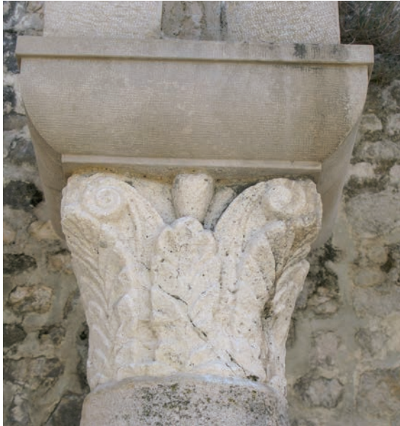
Sl. 161 - Sv. Ivan Evanđelist, deambulatorij, kapitel na 4., središnjem stupu