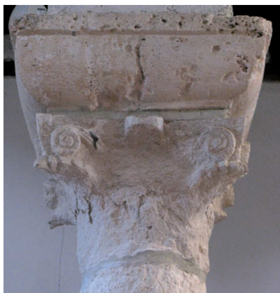
Sl. 156 - Supetarska Draga, Sv. Petar, kapitel na 5. južnom stupu

kapitela i jedan kasniji, gotički. 315 Među ranoromaničkim kapitelima prevladavaju palmetni – u deambulatoriju ih je postavljeno 4. Dva su ranoromanička kapitela ukrašena akantusom. Oni se nalaze na trećem stupu sa sjeverne strane i trećem stupu s južne strane i okružuju palmetni kapitel na središnjem stupu deambulatorija. Svi imposti su sličnih obilježja – lagano zaobljeni i bez posebnog ornamentalnog ukrasa. Razlike koje se vide na tijelima stupova vjerojatno su posljedica oštećenja i konzervatorskih