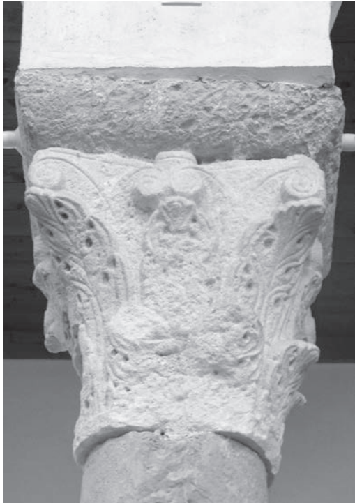
Sl. 134 - Rab, katedrala, kapitel na 1. sjevernom stupu

je blizak antičkom akantusu, na što osobito upućuju gornji vrhovi listova, povijeni i istaknuti u prostoru. Čini se, stoga, da je na akvilejskim ranoromaničkim kapitelima isklesan dvostruki vijenac akantusa, po čemu oni u svemu slijede prototip antičkih korintskih kapitela koji su očito, prema sačuvanom primjerku, i poslužili kao uzori ranosrednjovjekovnim klesarima. 305