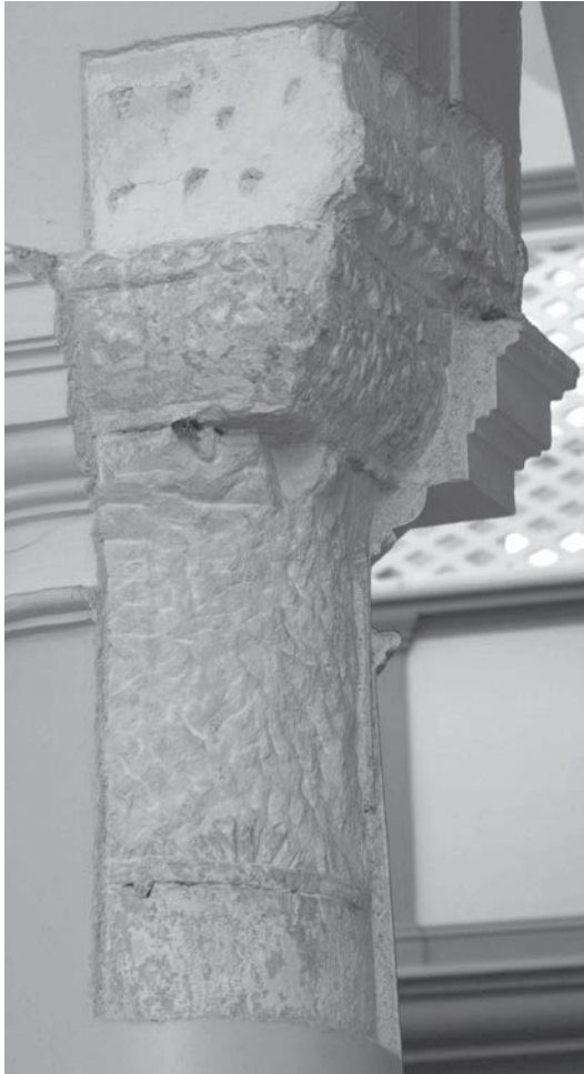
Sl. 145, Sv. Andrija - kapitel na 3. sjevernom stupu