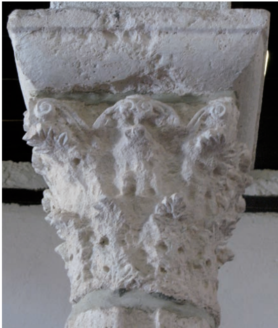
Sl. 149 - Supetarska Draga, Sv. Petar, kapitel na 3. sjevernom stupu