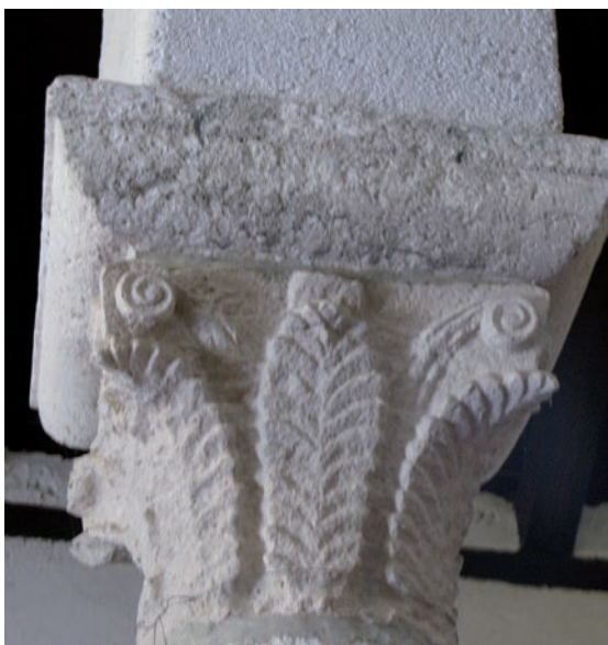
Sl. 151 - Supetarska Draga, Sv. Petar, kapitel na 2. sjevernom stupu