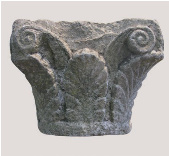
Sl. 166 - Kapitel iz lapidarija, izvorno iz Sv. Ivana Evandelistista