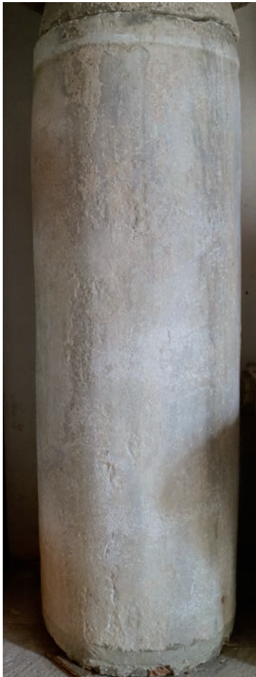
Sl. 175 - Rab, Sv. Andrija, mramorni stup

Uz reprezentativni mramorni kapitel s palmetama u samostanu sv. Andrije nalazi se mramorni okrugli stup (Sl. 175, Kat. br. 98). 350 Jesu li ta dva spomenika pripadala istoj cjelini teško je reći, premda njihova blizina na sadašnjem mjestu sugerira takvu mogućnost. Čini se da promjer stupa ne odgovara promjeru kapitela, 351 pa je možda riječ o pripadnosti istom interijeru, ali moguće unutar različitih cjelina arhitektonske skulpture odnosno liturgijskih instalacija.