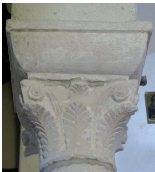
Sl. 155 - Supetarska Draga, Sv. Petar, kapitel na 5. sjevernom stupu