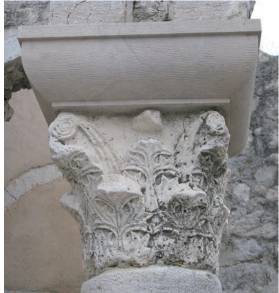
Sl. 162 - Sv. Ivan Evanđelist, deambulatorij, kapitel na 5. stupu