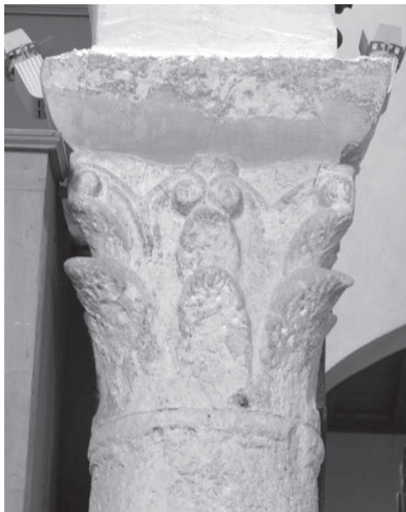
Sl. 138 - Rab, katedrala, kapitel na 5. južnom stupu

U drugoj, južnoj kolonadi sačuvana su 2 ranoromanička kapitela. Kapitel na 1. stupu (Sl. 137, Kat. br. 63) odlično je sačuvan. Dva vijenca akantusa pokazuju obilježja klesanja. Sa strana središnjeg rebra lista po dvije svrdlane rupice razdvajaju manje listiće. Vrh lista s nekoliko paralelnih uparanih linija izvijen je prema van i daje volumen listu. Volute su istih dimenzija, sitne, ali naglašene u prostoru. Na dnu kapitela je istaknuta prstenasta profilacija. Impost je zaobljen, ali ne osobito visok.