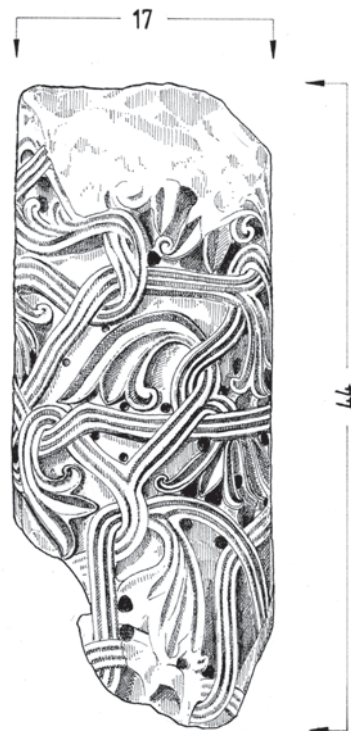
Sl. 183 - Sv. Andrija, ukrašeni stupić

Drugi ranoromanički ulomci u crkvi sv. Andrije izrađeni su od vapnenca. Na oltar južnoga zida crkve uzidan je ulomak okrugloga stupića s plastično ukrašenom površinom (Sl. 182, 183, Kat. br. 103). Riječ je o gustom prepletu troprutih traka i vegetabilnih listova. U izradi je sporadično korišteno svrdlo. Vegetabilni motivi mogu se promatrati kao odraz antičkog oblikovanja vinove loze na sličnim spomenicima. Iz Dalmacije je dobro poznat starokršćanski primjer - okrugli stupić ciborija s Marusinca. 372 Na starokršćanskom stupiću u donjem je dijelu vijenac velikih akantusovih listova iznad kojih se uzdižu vitice loze s listovima i grozdovima. Oblikovanje je realistično, s vjernim dočaravanjem vegetabilnih motiva. Na ranoromaničkom stupiću iz Sv. Andrije između troprutih traka mogu se prepoznati stilizirani listovi loze uz nešto drugačije oblikovane ranoromaničke vegetabilne motive. Stupić je prilično tanak (promjera 17 cm) i izrađen od vapnenca, pa je upitno može li se povezati s mramornim kapitelom i odrediti kao dio ciborija. Svakako, po stilskom izričaju i po korištenju svrdla, pokazuje srodnost s analiziranim kapitelom. Još je srodniji, međutim, jednom drugom rapskom ranoromaničkom kapitelu ciborija, što može pokazati analiza dvaju spomenika.