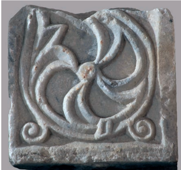
Sl. 191 - Rab, lapidarij, ulomak pilastra

dimenzija, dragocjen je jer se može pripisati ranoromaničkoj oltarnoj pregradi u katedrali. Riječ je o mramornom ulomku pluteja s motivom virovite rozete s trolisnim završetkom. 391 Izvedba rozete s naglašenim vegetabilnim završetkom, upućuje na ranoromaničku interpretaciju ranosrednjovjekovnog motiva virovite rozete. 392 I mramor od kojega je ulomak izrađen mogao bi se povezati s novim uređenjem katedrale u 11. st. Predromanički pilastri pronađeni u katedrali izrađeni su od vapnenca, i njihovom ornamentalnom repertoaru više bi odgovarala nešto drugačija izvedba motiva od one na mramornom ulomku pluteja. Novopronađenom