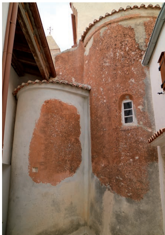
Sl. 187 - Rab, Sv. Andrija, apside ranoromaničke crkve

zbirdi. Riječ je o dva ulomka dovratnika, sa specifičnom ranoromaničkom vegetabilnom dekoracijom (Sl. 185). Na ninskim ulomcima unutar zavijutaka višepolute vitice nalaze se veliki peteročlani listovi ili cvjetovi na čijim peteljčkama su dvije male volutice. Jedna strana okvirne vitice rastvara se, pak, u trolisni oblik. Listići središnjih listova ili cvjetova imaju izduženi, uski oblik, i tankom linijom profilirane rubove. Izvedba je zaista specifična, a vrlo slično oblikovanje središnjeg vegetabilnog motiva nalazi se na uzidanom ulomku pluteja i na gornjem uzidanom ulomku pilastra u rapskoj crkvi sv. Andrije. 377 Svi detalji nisu posve podudarni, ali podudaran je središnji veliki list ili cvijet s tankim profiliranim listićima unutar medaljona ili povijene vitice. Na ulomku pluteja iz Sv. Andrije biljni motiv ima 6 listića i nedostaju male volutice. Na ulomku pilastra volutice su prisutne, a broj malih listića varira. Na svim spomenicima, i onima iz Raba i ulomcima iz Nina, jasno se prepoznaje ranoromanička razrada