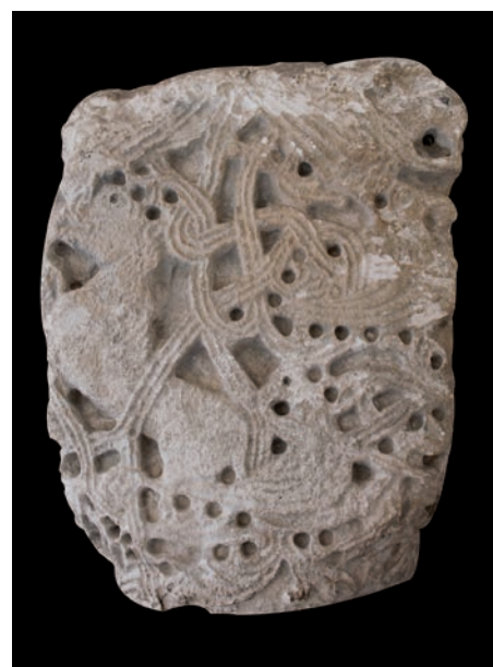
Sl. 188 -Zadar, Arheološki muzej, kapitel