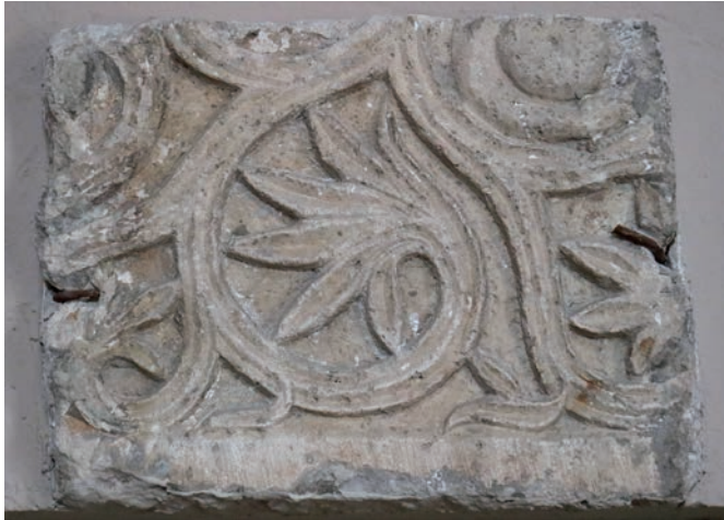
Sl. 184 - Sv. Andrija, ulomak pluteja