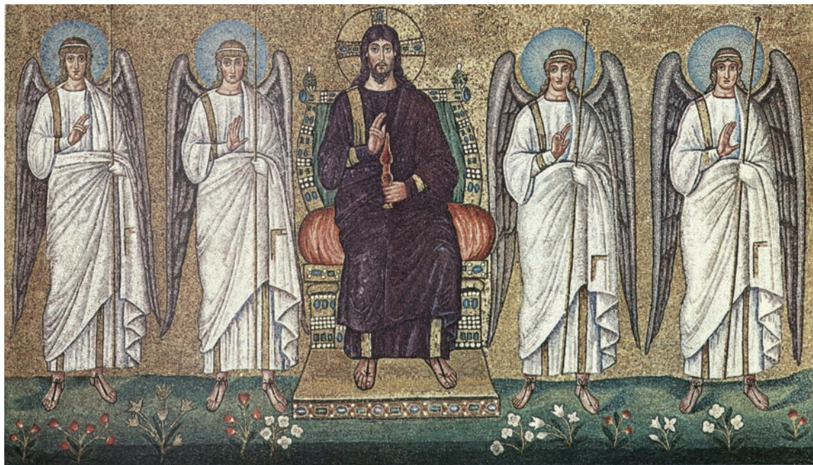
Sl. 193 - Ravenna, Sant' Apollinare Nuovo, mozaik