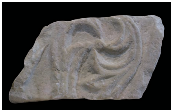
Sl. 190 - Rab, lapidarij, ulomak pluteja

drugim primjerima ranosrednjovjekovnih kapitela. Može se tako navesti arhitektonska skulptura iz Quedlinburga odnosno neki kapiteli s kontinuiranim tijekom zoomornih ili vegetabilno-geometrijskih motiva. 384 Riječ je samo o vrlo načelnim usporedbama, te rapski kapitel ostaje zacijelo izrazom maštovite i nekonvencionalne umjetnosti. Predstavlja originalno i jedno od najvrednijih djela naše rane romanike. Osim već navedenih analogija, treba upozoriti na spominjanje kapitela u mađarskoj literaturi. 385 Tu je doveden u vezu s nekim tamošnjim kapitelima, čime se otvara zanimljiva problematika i pronalaze analogije daleko od područja gdje bi ih prvenstveno očekivali.