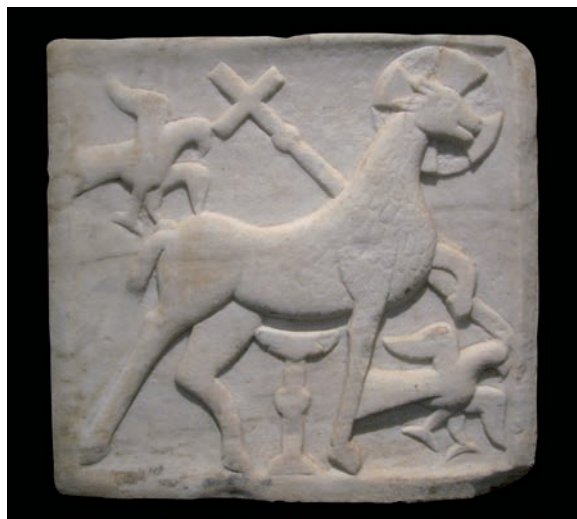
Sl. 195 - Kotor, bizantski reljef

je u svojoj analizi Rapskog evanđelistara ukazao na bizantsku provenijenciju figuralnih motiva, ali i na vjerojatni nastanak rukopisa u skriptoriju, možda na samome Rabu, pod utjecajem zadarskog skriptorija sv. Krševana. 408 Nasuprot tome, kameni reljef s Kristom na prijestolju ne može se povezati s domaćim ranoromaničkim radionicama u Dalmaciji, nego predstavlja uvozni rad, kakvi su vrlo rijetki u razdoblju 11. i 12. st. u Dalmaciji i na Kvarneru.