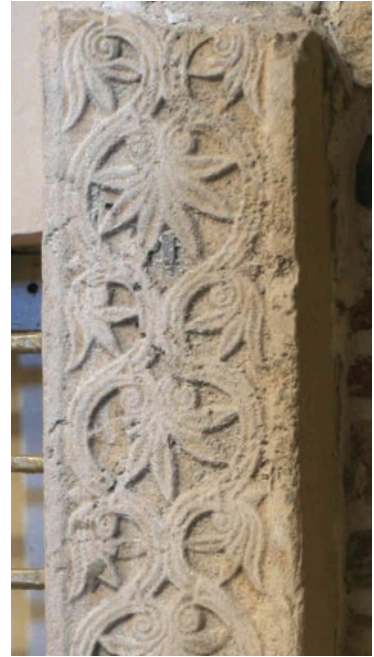
Sl. 186 - Sv. Andrija, pilastar