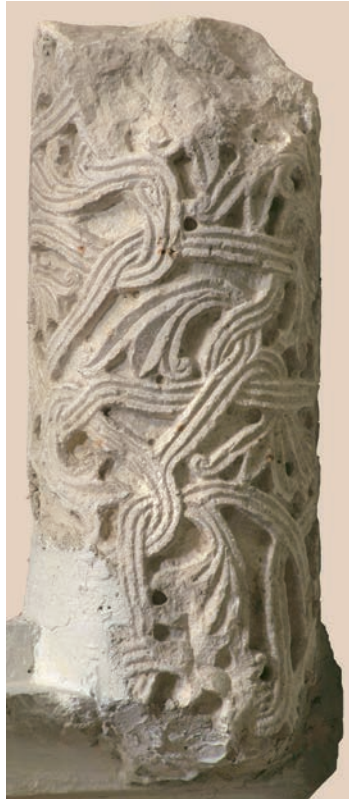
Sl. 182 - Sv. Andrija, stupić