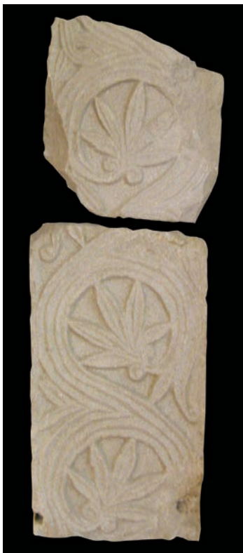
Sl. 185 - Nin, Arheološka zbirka, ulomci dovratnika

Moglo bi se pretpostaviti da je zajedno s ulomkom pluteja činio dio oltarne pregrade iz 11. st. Jesu li ovi ulomci izvorno pripadali crkvi sv.