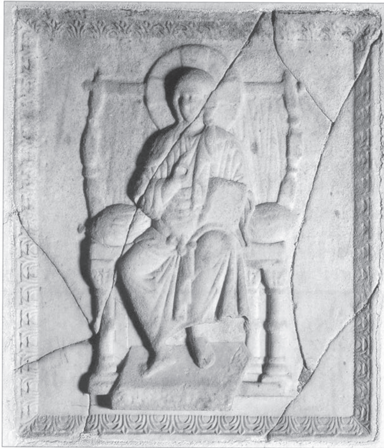
Sl. 192 - Rab, katedrala, reljef s Kristom na prijestolju

bizantski rad neke strane radionice. Kako su, međutim, slične bizantske skulpture sačuvane izvan Hrvatske prilično rijetke, rapski reljef zaslužuje posebnu pažnju i trebao bi biti uključen u rasprave o bizantskoj skulpturi i umjetnosti općenito.