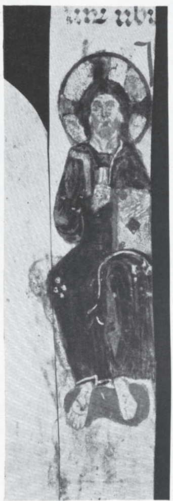
Sl. 194 - Rapski evanđelistar, Krist na prijestolju

mramornog reljefa manjeg formata, u obliku prenosive ikone, osobito je važna i ima iznimno mjesto među djelima s prikazom motiva Krista na prijestolju u obliku lire, te to treba posebno naglasiti u pokušaju cjelovitije interpretacije rapskoga spomenika.