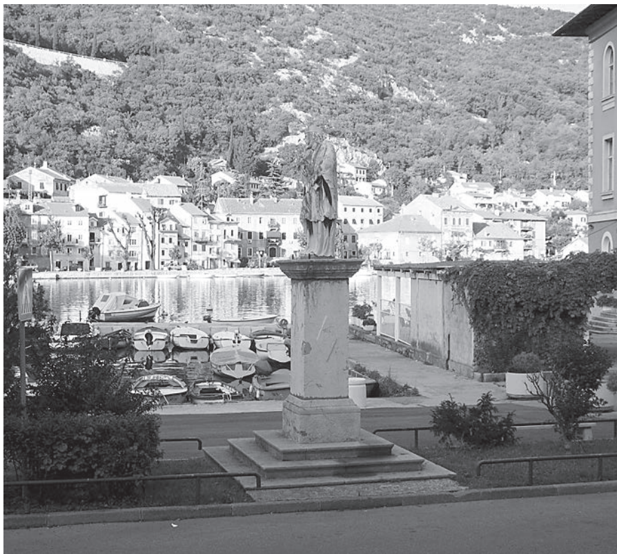
143. Gradski pil sv. Ivana Nepomuka (XVIII. st.), Bakar.

djelatnost naslućujemo također kod osječkog spomenika Sv. Trojstva (1729/30), reprezentativnih spomenika sv. Ivana Nepomuka pred dvorcima u Klenovniku, Velikom Bukovcu i Zelendvoru (o. 1766) [...]. 560