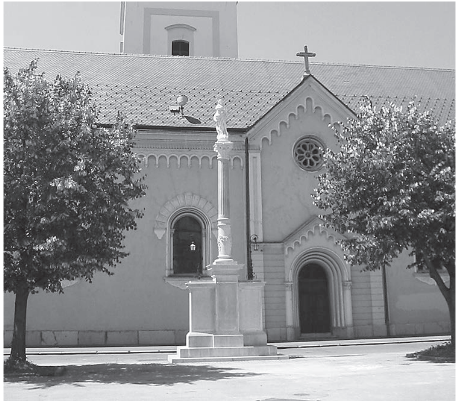
141. Francesco Robba, Gradski pil Bezgrješnoga začeca (1730.), Karlovac.

gledniji stanovnici Kaptola. Pozornost s kojom su se franjevci u Karlovcu pobrinuli za Marijin pil svjedoči koliko im je važan bio javni ulog u vjersku identifikaciju vojnoga grada.