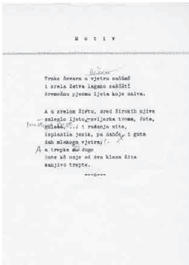
Sl. 3. Desnica je veliku pažnju posvećivao svakom leksemu i većina njegovih pjesama ima nekoliko rukopisnih verzija

i „trepke mu duge“ nasuprot „isplazila jezik pa dahće i guta“ i „trepke joj duge“. Precrtana riječ „mu“ i dopisana „joj“ dodatno bi ustabilile pretpostavku o središnjoj poziciji ove verzije u evoluciji teksta pjesme. Odluka da gramatičku podudarnost usmjeri ka metaforičkom označitelju opjevane pojavnosti otkriva Desničinu insistiranje na bajkolikoj, mitološkoj personifikaciji prirodnog procesa koju pjesma uspostavlja. Gozba u poljima i jeste mali pokušaj stvaranja svojevrsne individualne pjesničke mitologije čovjekove pozicije u prirodnom ciklusu – u njegovom kretanju i vječnom obnavljanju – a nijanse koje Desnica izvlači naizgled neznatnim korekcijama, zapravo su krupni pomaci u semantici njegovih konačnih lirskih tvorevina. 13