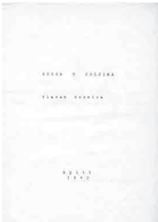
Sl. 1. Naslovnica neobjavljene zbirke pjesama Vladana Desnice sastavljena u Splitu 1940. godine