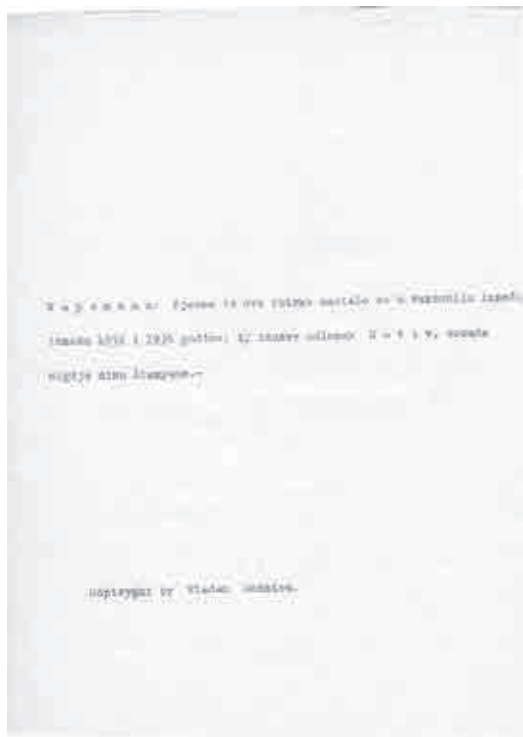
Sl. 2. Desničina napomena uz zbirku Gozba u poljima

Kako će ti Vlade biti rekao, putem mi se izgubila valiza sa svom onom pustom robom i – što je najtragičnije, za mene lično – sa čitavim lirskim radom jednog decenija!