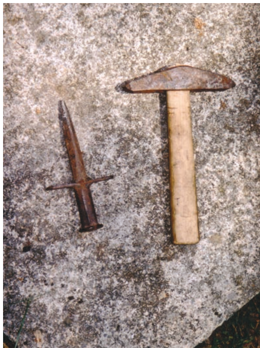
Slika 9. Klepac i babica; snimio Augustin Perić, lipanj 2003.