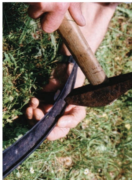
Slika 8a: Klepanje kose, krupni detalj.