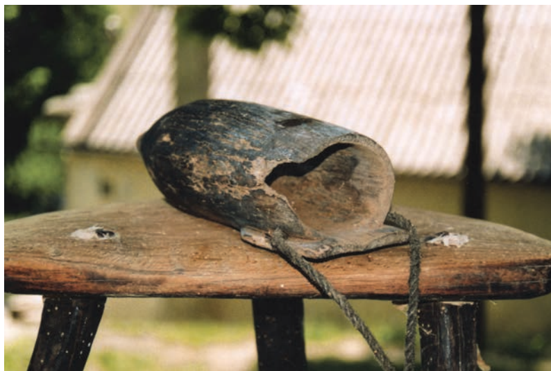
Slika 7a: Neukrašeni tulac; snimio Augustin Perić, lipanj 2003.