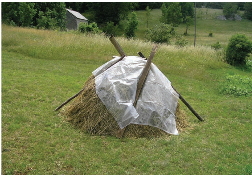
Slika 11: Plast sijena, lipanj 2005.

Izgled plasta vjerno je opisan u kazivanju Luke Krmpotića: Kao jedna hrpica, kao stožinica mala, natrpaj seno al nema u sredini stupa, stožine. Stavljaj okolo, okolo, onda kad dođeš do gore više puta prođi (vilama ili rozgama, op. a.), da kad pada kiša pada dole. Velimo završit plašt. Na zemlju se ne stavlja niš, jedino ako će stajat tako duže od par dana. Stoji kako ko može dobit blago da doveze, vozilo se na voli, di je bliže i prenašaj na nim dragaćama (...) dragače napravi... vako sastrane dva velika drveta i na njima poprečne letvice, daske jedna do druge na udaljenosti 20-30 centimetara, da seno ne propane. I onda sa strane uzmemo ja i on il već ko bia i nosimo. To je dugačko negdi 2 metra. To koristiš ako je negdi blizu, ako je dalje onda ideš s koli.