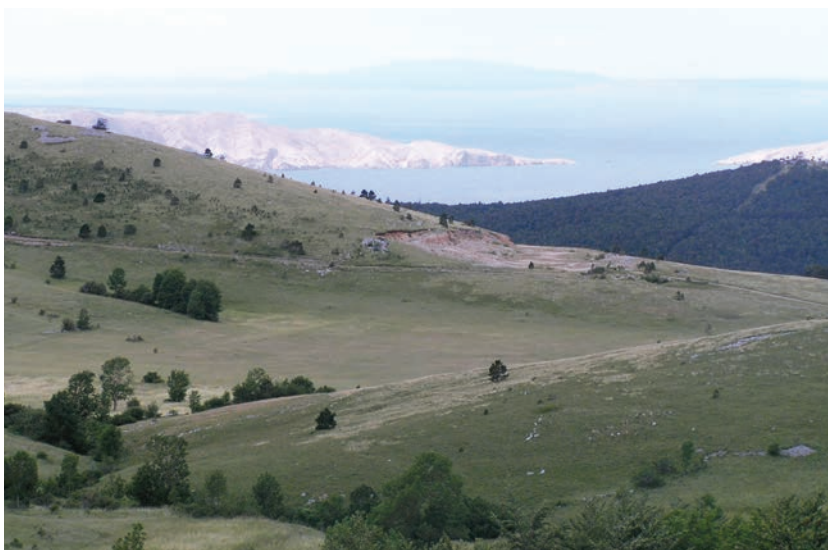
Slika 1: Planina, lipanj 2005.

Građu za ovaj prilog prikupila sam tehnikom intervjua, u početku polustrukturiranim, a nakon nekoliko kazivača strukturiranim. Kao polazište poslužila su mi pitanja navedena u Upitnici UEA, svezak prvi, tema 20. pod nazivom Sijeno . Za temu sjenokoše podatke sam pronašla i u temi 18. Kose i 19. Vodiri . Kao što je već spomenuto u uvodu za cjelinu tradicijsko gospodarstvo , čitavo je područje Krivoga Puta opisano u jednoj upitnici kao mjesto (selo) Krivi Put, stoga su podaci ondje geografski i kronološki generalizirani i uglavnom vrlo pojednostavljeni. Iz preslike se vidi da su podaci na Upitnici pod nazivom Sijeno vrlo šturi, stoga ću u daljnjem tekstu iz Upitnice navoditi i komparirati samo podatke koje nisam zabilježila na terenu ili one koji se razlikuju od mojih (ponajviše zbog četrdesetogodišnje razlike u vremenu istraživanja). Prilikom istraživanja, Upitnicu za sjenokošu proširila sam i prilagodila krivoputskome području.