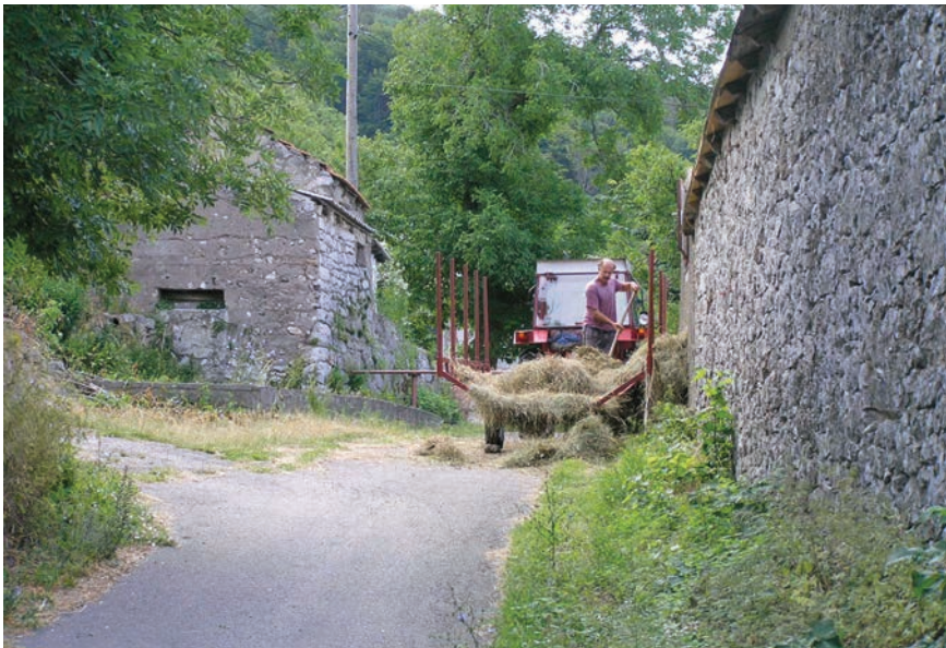
Slika 13: Istovar sijena u Francikovcu kod obitelji Prpić Nikolčinih; snimila M. Rajković, lipanj 2005.

Nakon što je sijeno dovezeno kući, mećalo se u pod (prostor pod krovom), više (iznad) blaga . Odozgo odma rušiš doli blagu. Ono što nije stalo u pod, mećalo se u stog. 65