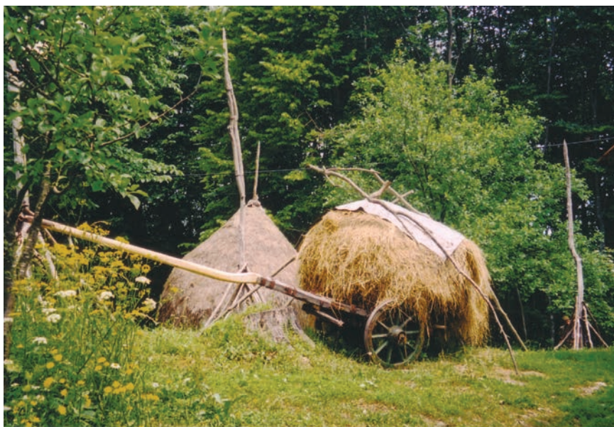
Slika 12: Sijeno na kolima, stog i priprema za stog u okućnici; snimio Augustin Perić, lipanj 2003.

Koliko dugo je sijeno stajalo u stočićima ili plastovima ovisilo je o tome jesu li ga Krivopučani imali s čime transportirati do kuće. Sijeno se moglo prevoziti na kolima s konjima ili volovima, ovisno tko je što imao; 62 zatim na magarcu ili muli i samaru, a također se moglo zavezati u balu i donijeti ručno. Na