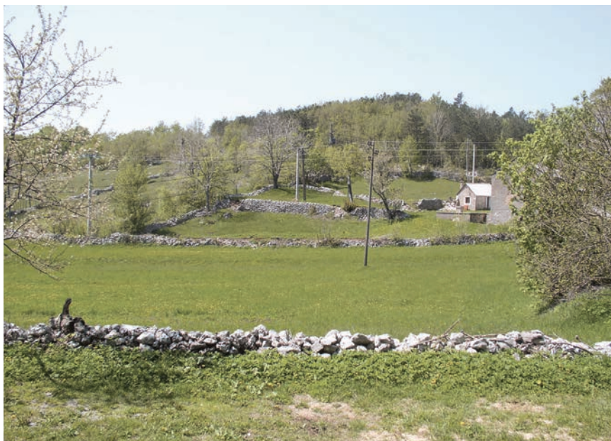
Slika 2: Livada pokraj okućnice na Alanu; snimila Marijeta Rajković, lipanj 2005.

Nakon što su pokosili ta područja, kosilo se uz naseljena područja (sl. 2), najčešće su to bile skromne oranice (koje su privremeno bile pretvorene u ledene ) te međe (prostor između oranica). Naime, zbog nedostatka odgovarajućega stajskog gnojiva, korištenje zemlje odvijalo se prema tradicijskoj recepturi, ne bi li se od nje dobio maksimum. Tako, primjerice, ako se na komadu zemljišta sadio krumpir, sljedeće su godine tamo sijali žito, a potom ponovno krumpir (tko je imao više domaćih životinja - žito). Nakon tri do četiri godine, zemlja se iscrpi i ne daje dovoljno plodova. 1 Ovisno o količini i kvaliteti zemlje odlučivalo se kada će se neki komad zatravniti. Kako gdi trevi, neko zatravni za tri, četiri godine, a neko tek nakon pet, šest godina. Zemlju koja je prazna, odnosno na kojoj raste trava ili na koju su posijali djetelinu, Krivopučani zovu ledena .