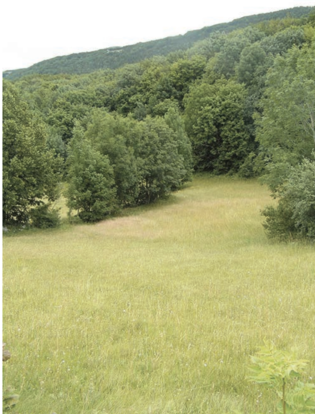
Slika 3: Livada pokraj šume ispod Bila; snimila Marijeta Rajković, lipanj 2005.

Nakon što je djetelina posijana, do košnje više nije bilo posla. No, djeca su imala zadatak nekoliko dana prije košnje ukloniti ( ići brati ) kamenje s livada da kosci ne bi oštetili ili pokidali kosu (željezni dio).