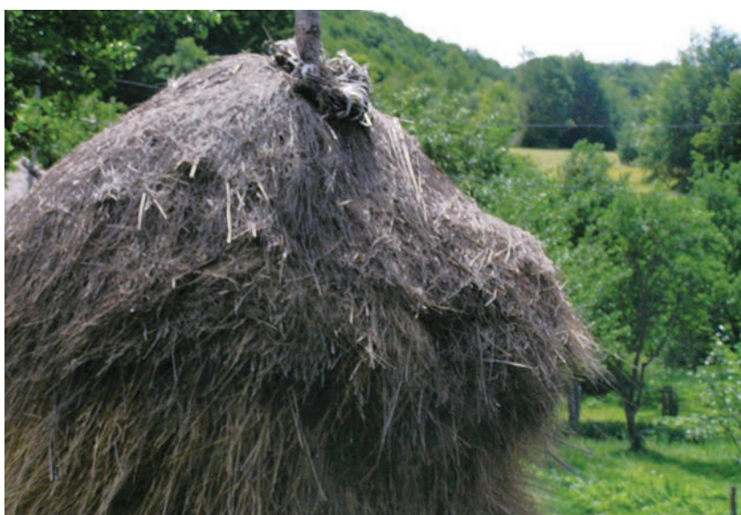
Slika 15: Vijenac na vrhu stoga ; snimila Marijeta Rajković, lipanj 2005.