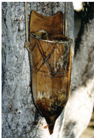
Slika 7: Drveni tulac, ukrašen tehnikom paljenja. Vlasnik Milan Prpić Apel, Mrzli Dol; snimio Augustin Perić, lipanj 2003.

Unatoč tome što je teško vremenski precizirati, obrađujući podatke može se pretpostaviti da se ukrašavanju tulaca u prvoj polovici 20. stoljeća posvećivala veća pažnja te da je razlog tome bio veći broj kosaca. Tulci su ukrašavani tehnikom paljenja (sl. 7), rezbarenja i bojenja. Najčešće su ih ukrašavali sami vlasnici prema osobnom sklonostima, od geometrijskih do figu-