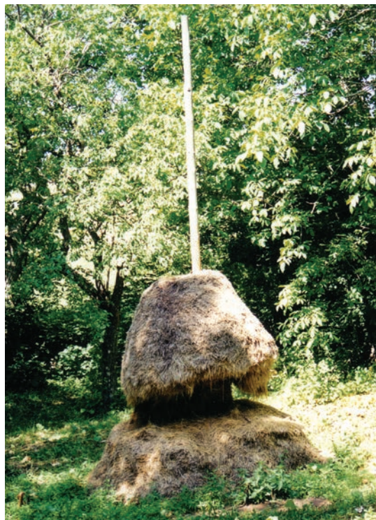
Slika 16: Korištenje sijena iz stoga ; snimio Augustin Perić, lipanj 2005.