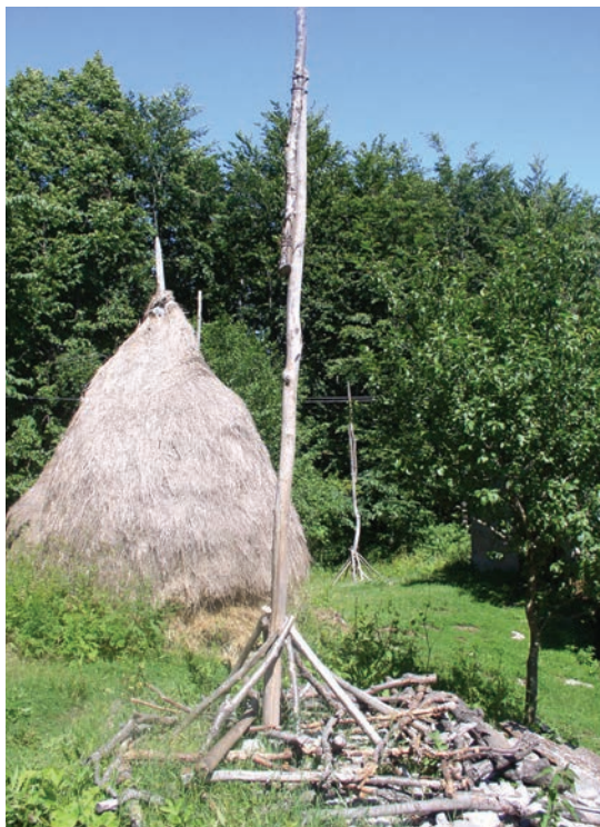
Slika 14: Stožina, priprema greda za sadivanje stoga ; snimila Marijeta Rajković, lipanj 2005.

Upitnice Etnološkog atlasa (UEA), svezak I, teme br.: 20. Sijanje , 18. Kose , 19. Vodiri ; Arhiv Odsjeka za etnologiju i kulturnu antropologiju, Filozofski fakultet u Zagrebu.