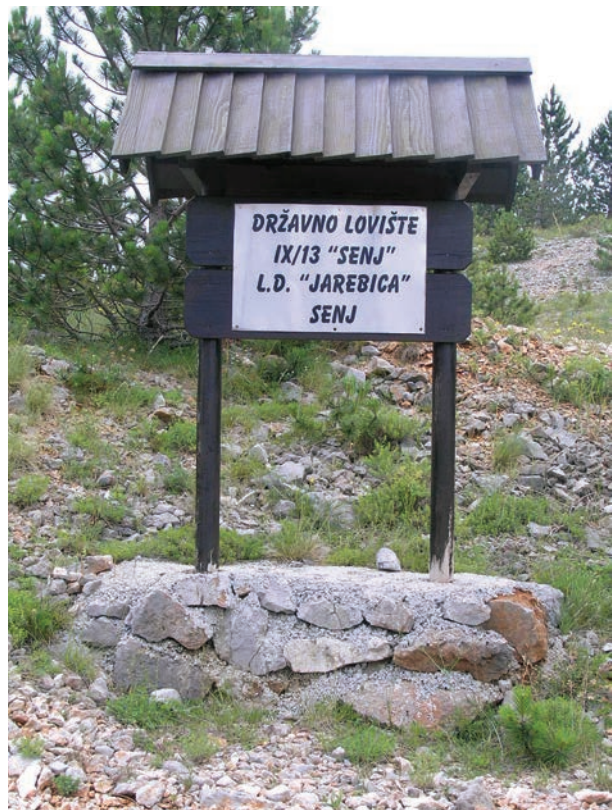
Slika 4: Oznaka područja Državnog lovišta broj IX/13 'Senj' u zakupu Lovačkog društva Jarebice; snimila Marijeta Rajković, svibanj 2004.

Lovačko društvo ima sastanke svaki mjesec na kojima se okupe članovi izvršnog odbora. Svi lovci pozvani su na godišnju skupštinu, a tijekom godine lovnici imaju slobodu sazivati sastanke. Društvo se sastoji od predsjednika, tajnika, lovočuvara, lovnika grupa i predsjednika grupa. U grupama ima od 40 do 60 ljudi i svaka grupa ima svog lovnika. Da se ne zanemari pojedino lovište lovci su podijeljeni u više grupa. Grupe su podijeljene po radnim obavezama. Teren Lovačkog društva je veliki i grani-