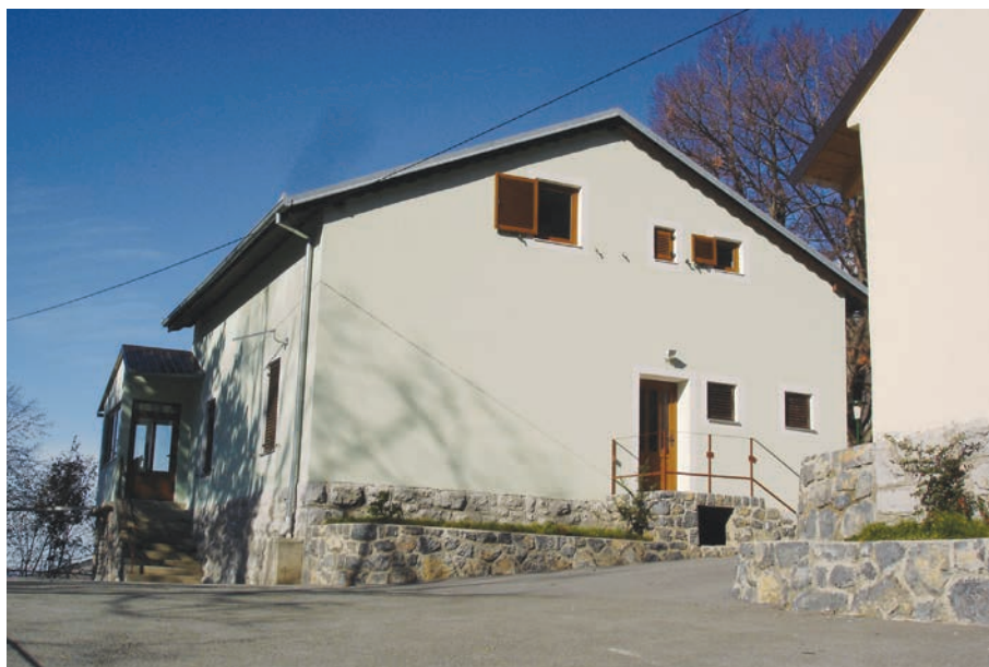
Slika 5: Lovачki dom u Perdasima; snimila Marijeta Rajković, travanj 2008. godine.

Sezona lova je čitavu godinu, npr. na divlju svinju mužjaka, dok se ostali lovostaji određuju prema razmnožavanju pojedine divljači. Primjerice za crnu divljač posebno, za plemenitu divljač posebno, za ptice. (...) Na ovom području sezona lova na crnu divljač počinje sredinom 10 mjeseca i traje najdalje do 15. siječnja, objasnio je Milan Vukelić Deviza. Sezona lova na ovom području počinje svake godine oko 15. listopada (kazivači napominju da mora biti nedjelja budući da većina članova radi ostalim danima). Na otvorenje lova prema tumačenju Milana Vukelića Devize, tajnika Lovачkoga društva, dođe stotinjak lovaca, odnosno 50 do 60 % članova Lovачkoga društva. Danas 'Jarebica' ima 195 članova (Jurčenko et al. 2005:18). Svake godine odredi se vrsta životinje koja se lovi, a najčešće su to divlje svinje ili lisice. Lovci se nakon zajedničkog lova družu uz ručak u Lovачkom domu u Perdasima, Senjska Draga (sl. 5).