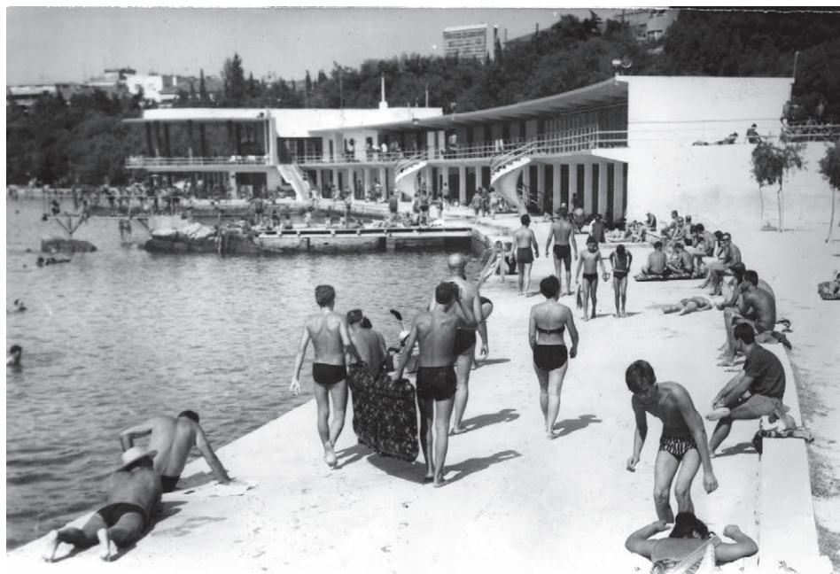
Sl. 9. Kupališna zgrada na Bačvicama. Finalni projekt arhitekata Prospera Čulića i Borisa Katunarića.

konačni nacrt, a prvi radovi su počeli 1938. Koncem godine održana je treća licitacija za izgradnju zgrade kupališta. Nedostajala su sredstva pa su radovi zastali. Na izradi projekta bio je angažiran i arh. Lavoslav Horvat, ali su konačno rješenje napravili Prosper Čulić i Boris Katunarić iz Arhitektonskog odsjeka Općine. Izgradnja je počela 1938. i trajala sve do početka rata. 47 U susjednoj je uvali Jugoslavenski pomorski sportski klub Firule sagradio 1923. svoj klub. Drvena zgrada bila je podignuta na stupovima u plićaku. Tako su Bačvice, uz nove hotele, ulice i bogate nasade zelenila, izrasle u visoko kvalitetno stambeno, turističko i rekreacijsko područje.