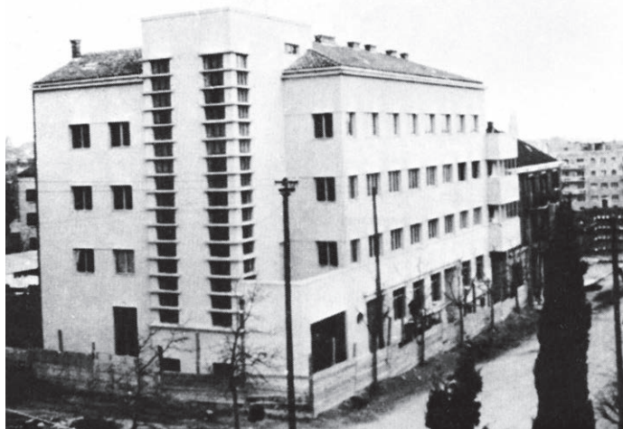
Sl. 5. Burza rada u Zrinsko-frankopanskoj ulici. Projekt arhitekata Helena Baldasara i Emila Cicilijanija.

U državi, pa i u Splitu, bio je velik broj nezaposlenih radnika. Skrb za njih povjerena je posebnom uredbom iz 1927. Središnjoj upravi rada i njezinim Javnim berzama rada. 23 Zadatak im je bio posredovati u radnim odnosima. U to vrijeme otvoren je i ured u Splitu. Trebalo je osigurati podizanje zgrade za njegov smještaj te za smještaj Radničkog azila