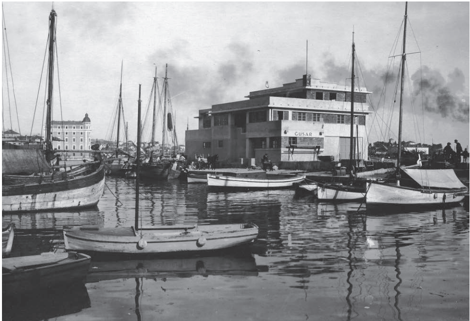
Sl. 10. Dom veslačkog kluba „Gusar“ na Matejuški. Projekt arh. Josipa Kodla.

Split ima bogatu sportsku tradiciju, posebno u pomorskim disciplinama. Među prvima je veslačko društvo „Gusar“, osnovano 1913. godine. Oko njega su se okupljali vrsni sportaši, intelektualci pa je to postalo omiljeno mjesto okupljanja i druženja građana. Prve prostorije su mu bile na istočnoj obali luke. Zgrada je najvećim dijelom služila kao spremište čamaca. Imala je i prostorije za upravu, veliku dvoranu i pomoćne sadržaje. S obzirom na pomorske investicije na tom mjestu „Gusar“ se morao iseliti. Odlučeno je podići novu zgradu na malom gatu u lučici. Nacrtno je napravio arh. Josip Kodl, i sam veslač. U tu su svrhu prikupljena znatna sredstva donatora, ali se i zadužilo. Radove je izvelo građevinsko poduzeće ing. Ivaniševića. U prizemlju je bilo spremište za čamce, radionica i stan čuvara, a na katu soba uprave, salon i svlačionice. Na drugom katu nalazila se čitaonica i velika terasa. Zgrada je tlocrtno i visinski bila raščlanjena, a krovovi ravni pa se dobro uklapala u okoliš. Predstavljala je avangardno ostvarenje moderne u našim krajevima. Dom je završen koncem travnja 1927. Svečano je otvoren uz nazočnost velikog broja građana i odličnika. 49 Ta gradnja predstavljala je početak preobražaja ribarske lučice na razmeđu Rive i Zapadne obale u cjeloviti gradski predjel s poslovnim zgradama, hotelom pa i zračnim pristaništem za hidroavione. 50