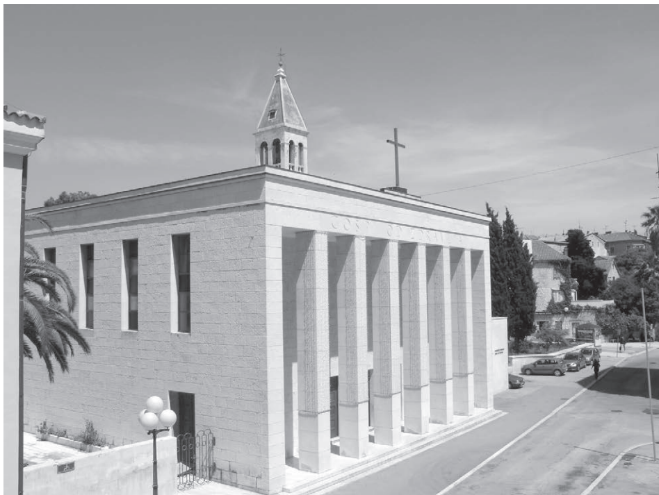
Sl. 8. Crkva Gospe od zdravlja na Manušu. Projekt arh. Lavoslava Horvata.

Škrivanić založio za nadogradnju drugog kata. Nacrt je besplatno napravio arh. Lavoslav Horvat, ali je izbila gospodarska kriza pa su banke zaustavile kreditiranje. Konačno se 1938. odlučilo ostvariti stari projekt. Preradio ga je arh. Fabjan Kaliterna. Siromašni redovnici nisu imali sredstava pa su se za gradnju prikupljala sredstva od građana. Radovi su završeni 1939. godine, na 30. godišnjicu preuzimanja svetišta. 39