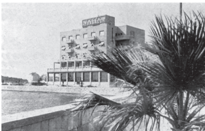
Sl. 6. Hotel „Ambasador“ na zapadnom kraju Rive. Projekt arh. Josipa Kodla.

U gradu je nedostajalo hotela koji bi komforom zadovoljavali zahtjevnije, posebno strane goste. Postojeći su uglavnom bili starije zgrade preuređene za ugostiteljstvo. Premda su se vlasnici trudili da ih uredi, rezultati su bili skromni. Ipak je dosta toga učinjeno. Osim već spomenute obnove hotela „Bellevue“, preuređeni su i hoteli „Central“, „Sava“ i „Slavija“ te još nekoliko manjih.