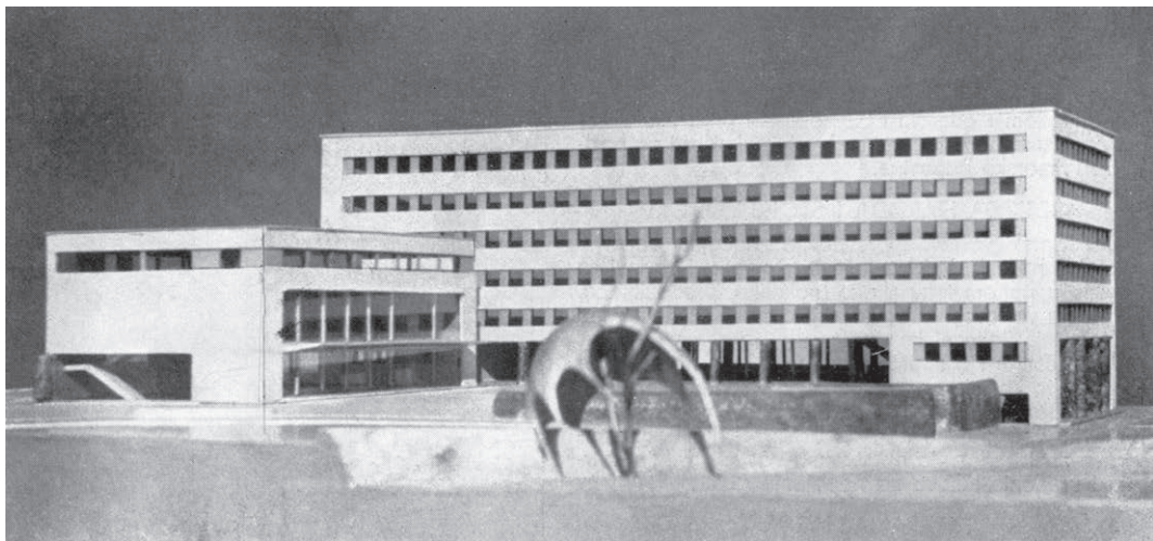
Sl. 2. Palača Primorske banovine na zapadnoj obali. Projekt zagrebačkih arhitekata Nikole Despota, Vida Vrbanića i Vladimira Turine.

Slijedila je 1933. zgrada Penzionog zavoda u Hrvojevoj ulici autora arh. Vladimira Šubica iz Ljubljane i 1935. palača Burze rada u Zrinsko-frankopanskoj ulici, koju je projektirao arh. Helen Baldasar. Konačno je 1939. sagrađena Bratimska blagajna na Bačvicama po projektu Emila Cicilijanija. 13