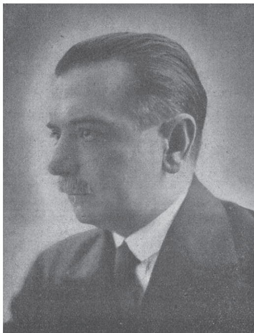
Sl. 1. Ivo Tartaglia, gradonačelnik Splita 1918. – 1928.