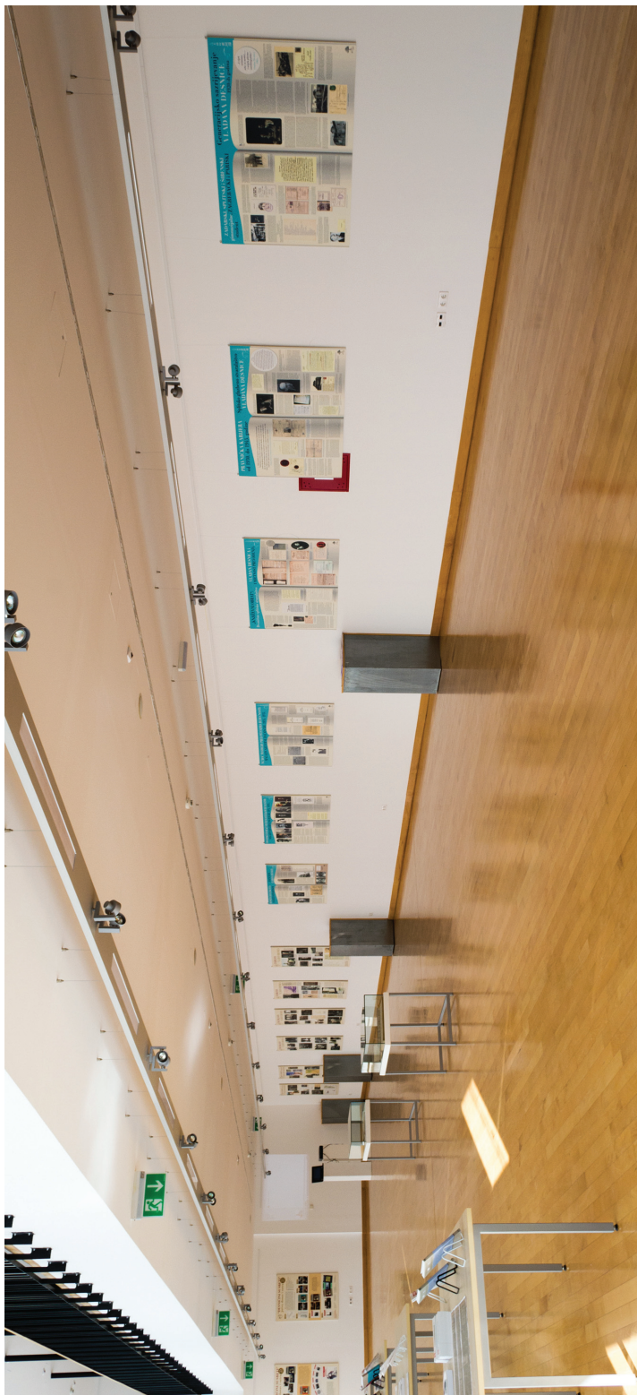
Sl. 7. Izložbena dvorana Sveučilišne knjižnice u Splitu uoči otvorenja izložbe Vladan Desnica i Desničini susreti