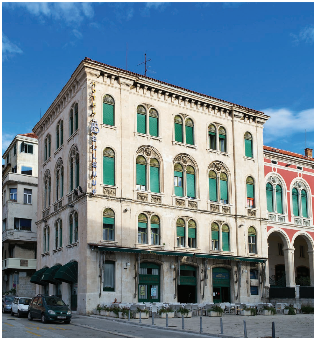
Sl. 1. Hotel „Bellevue“