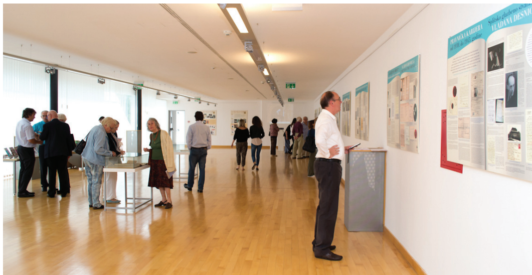
Sl. 9. Posjetitelji razgledaju izložbu Vladan Desnica i Desničini susreti u Sveučilišnoj knjižnici u Splitu