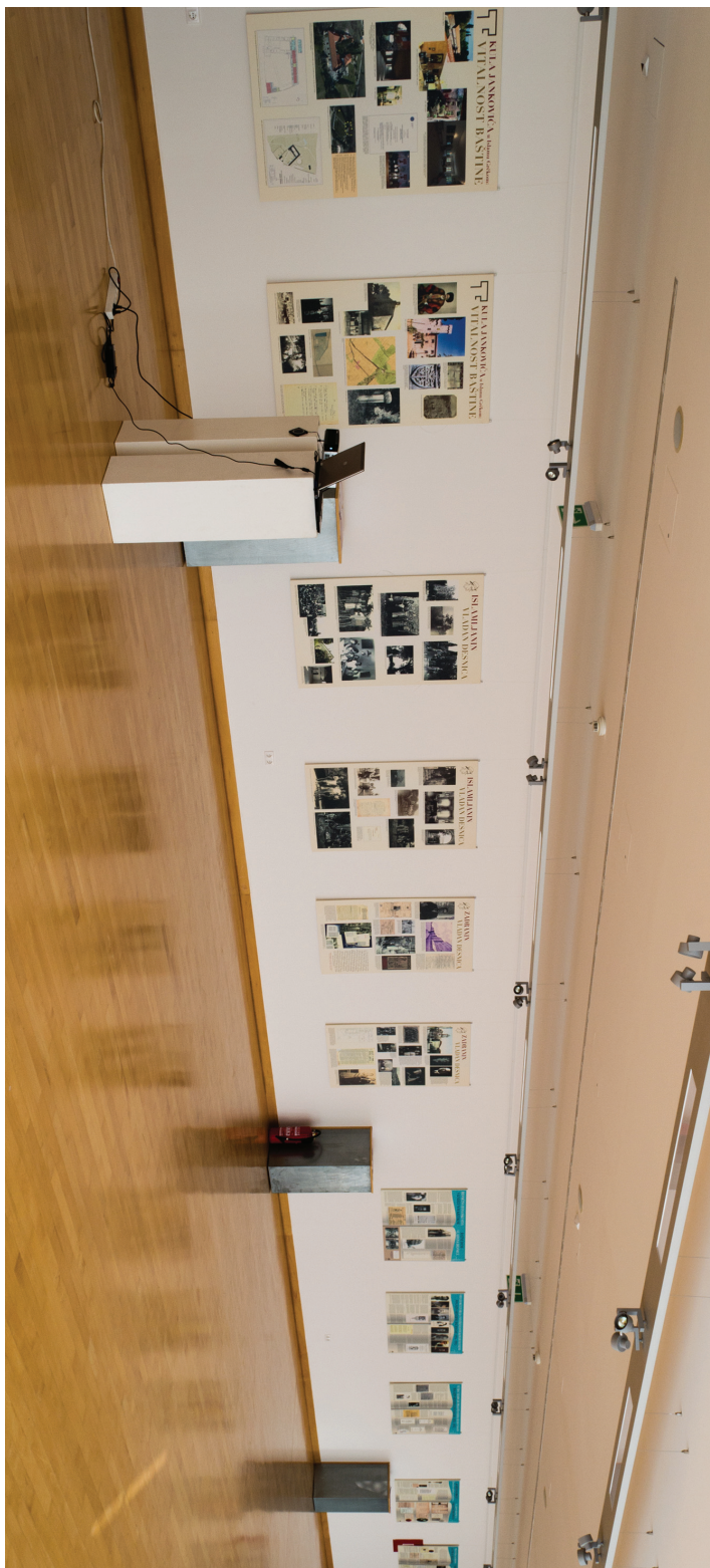
Sl. 8. Izložbena dvorana Sveučilišne knjižnice u Splitu noći otvorenja izložbe Vladan Desnica i Desničini susreti