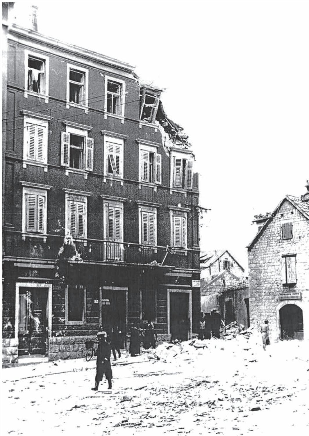
Sl. 5. Tomića stine 1 nakon savezničkog bombardiranja Splita 3. lipnja 1944.