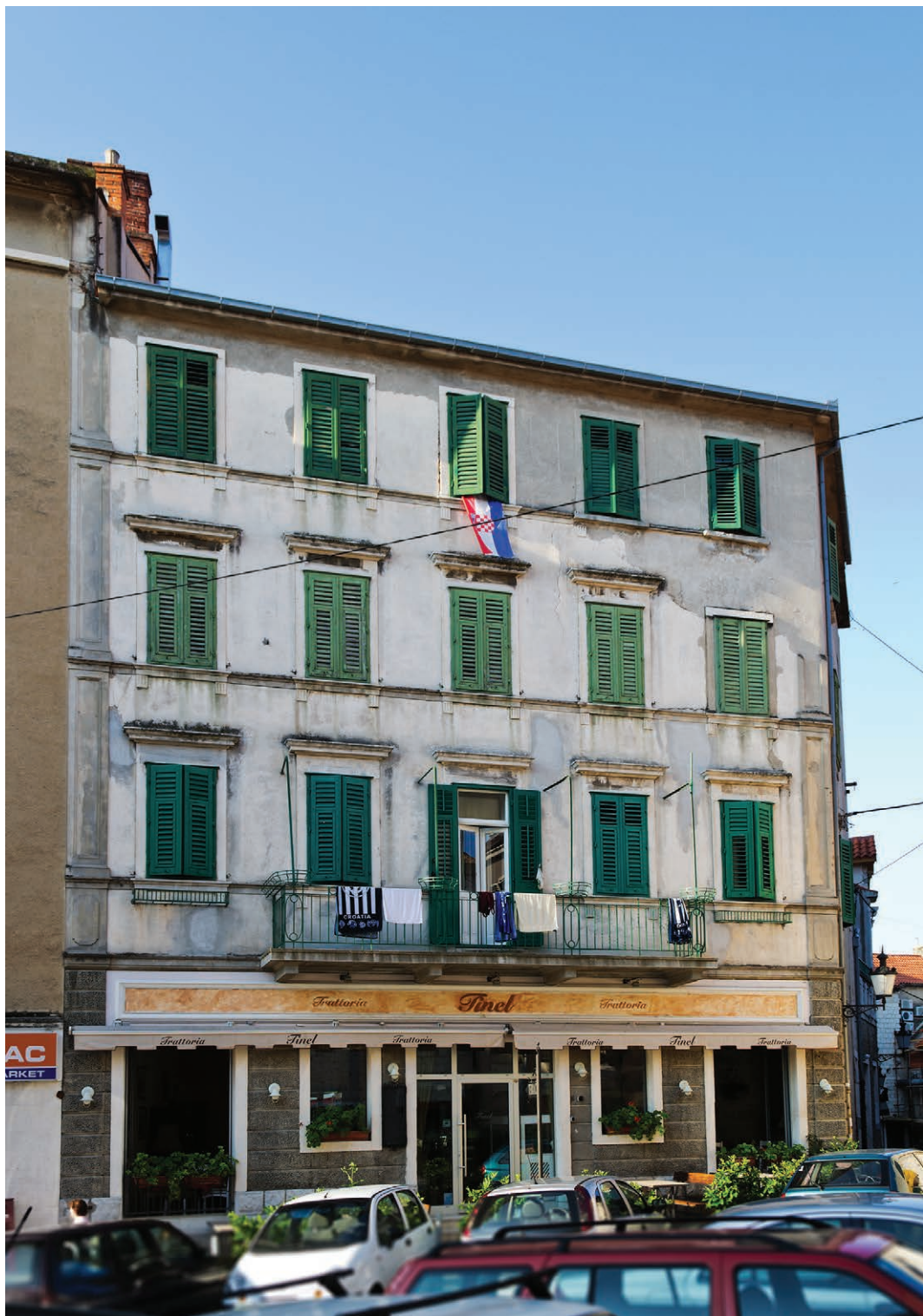
Sl. 4. Tomića stine 1