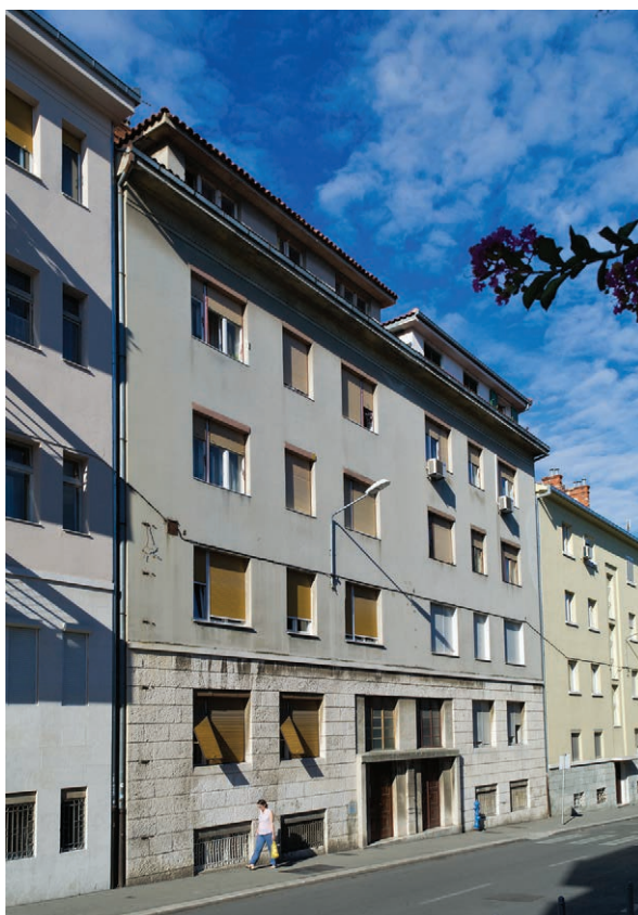
Sl. 3. Bihacka 5 i Bihacka 7