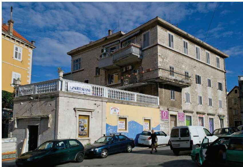
Sl. 2. Sinjska 7