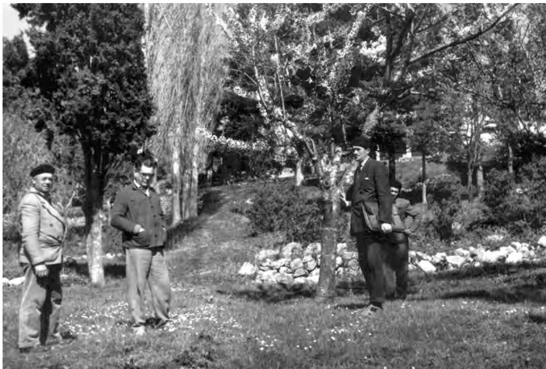
Sl. 8. Vladan Desnica s danas nepoznatim gostima u parku Kule Stojana Jankovića sredinom 1950-ih