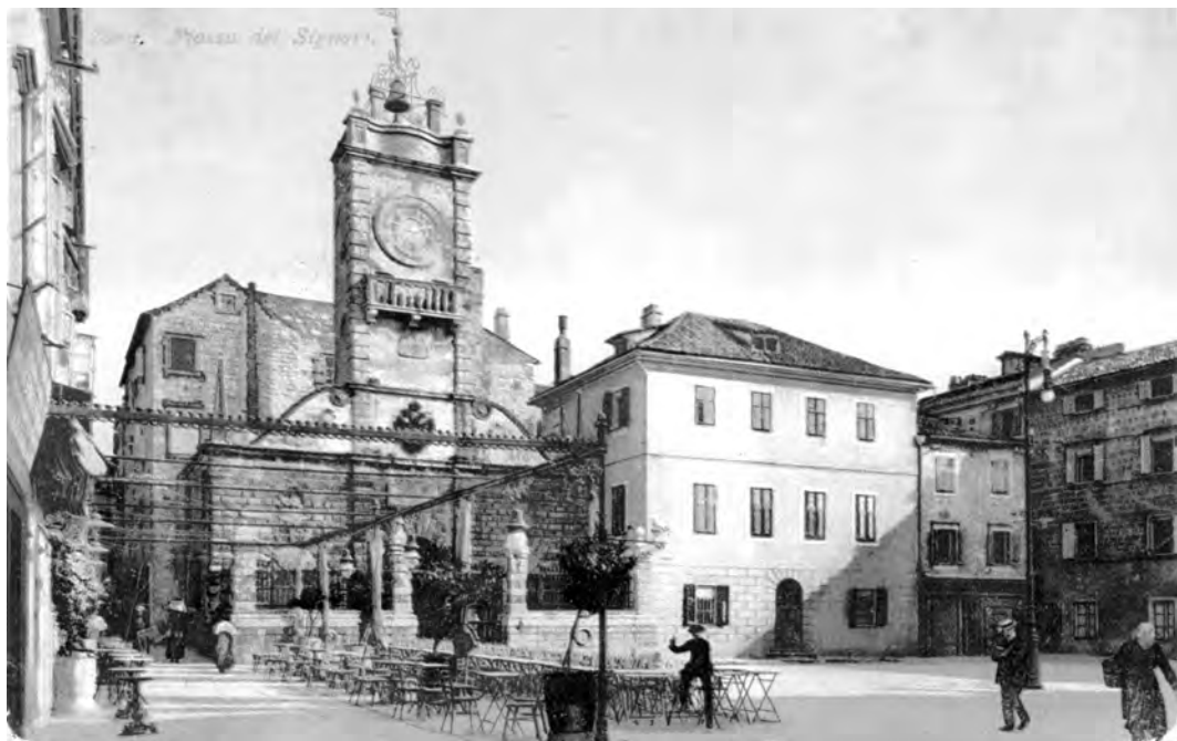
Sl. 5. Rodna kuća književnika Vladana Desnice (Zadar, 17. rujna 1905. – Zagreb, 4. ožujka 1967.) nalazi se s lijeve strane Narodnog trga ( Piazza dei Signori ). Na razglednici se ispred nje nalazi kavana. Peterosobni stan zadarskog odvjetnika dr. Uroša Desnice i njegove supruge Fanny Desnica (rođ. Luković) nalazio se na prvome katu. U njemu su s troje djece – Olgom (1901. – 1911.), Vladanom i Natašom (1907. – 1996.) – živjeli do 1920. godine, kada su morali napustiti Zadar.

nalazio brojne uzore, poput, primjerice, Benedetta Crocea, bez kojih nije moguće razumjeti njegov opus. Uzor i neosporni autoritet koji je utjecao na oblikovanje ličnosti Vladana Desnice bio je zasigurno i njegov djed s očeve strane Vladimir (1850. – 1922.), po kojemu je i dobio ime. On je također bio ugledni Zadrani i jedan od važnijih aktera u hrvatsko-srpskoj suradnji nakon 1905. godine. Početkom Prvoga svjetskog rata nestalo je idiličnog djetinjstva Vladana i Nataše. Djed Vladimir, otac Uroš i stric Boško bili su za austro-ugarske vlasti “veleizdajnici” i morali su biti što manje uočljivi. Vladan je započeo svoje zadarsko gimnazijsko školovanje u uvjetima koji nisu bili najpoticajni. O tome rječitro svjedoče ocjene sa svjedodžbe zadarske gimnazije, koja je također bila reproducirana na izložbi. Naravno, postavlja se pitanje bi li Vladan Desnica bio odličan učenik i u predratnim uvjetima. Vrlo je rano u svojoj imaginaciji stvorio vlastiti, artistski svijet, u kojemu su najvažnija bila literarna i glazbena mjerila.