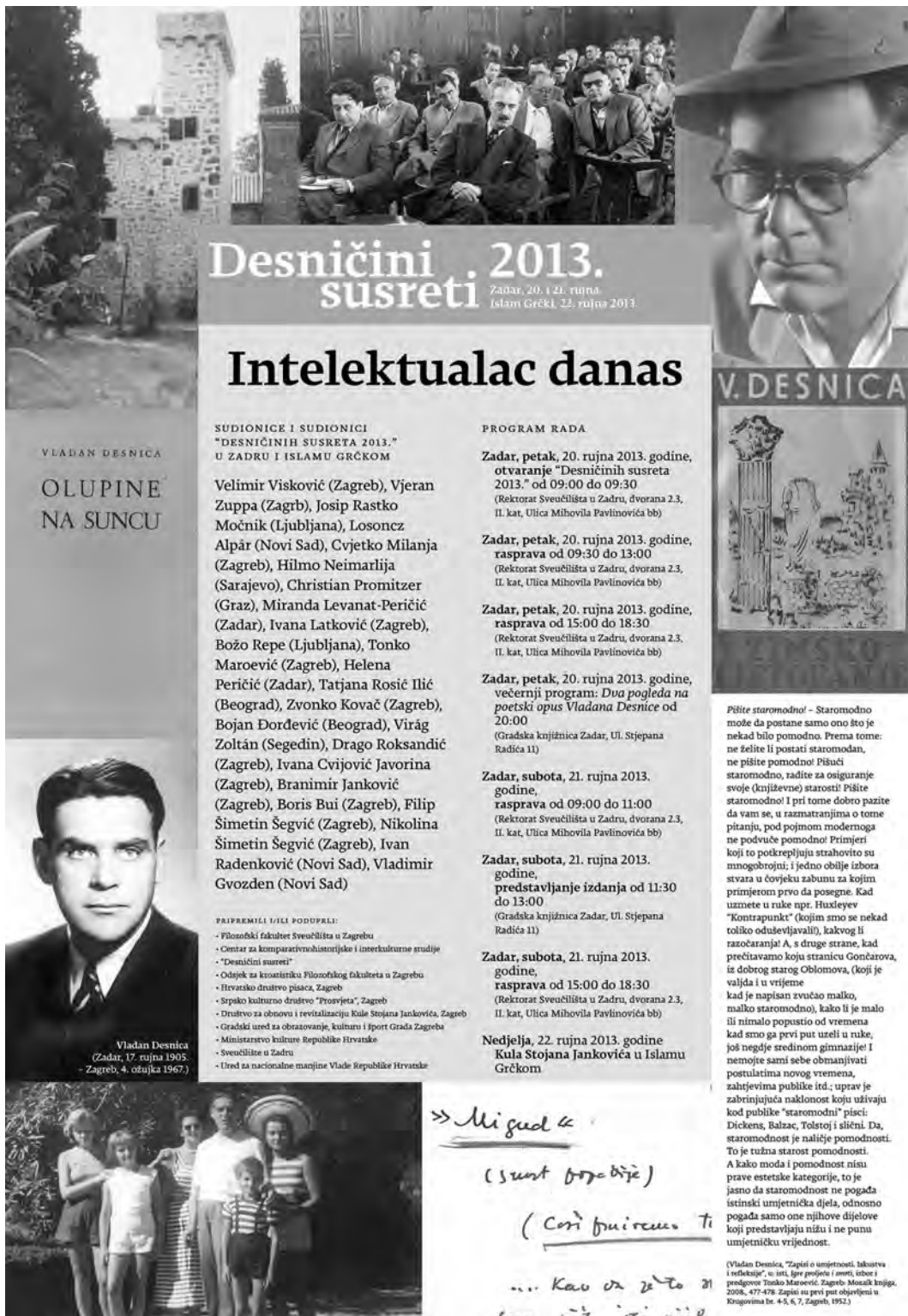
Sl. 1. Plakat za Desničine susrete 2013. Design: Dejan Dragosavac Ruta