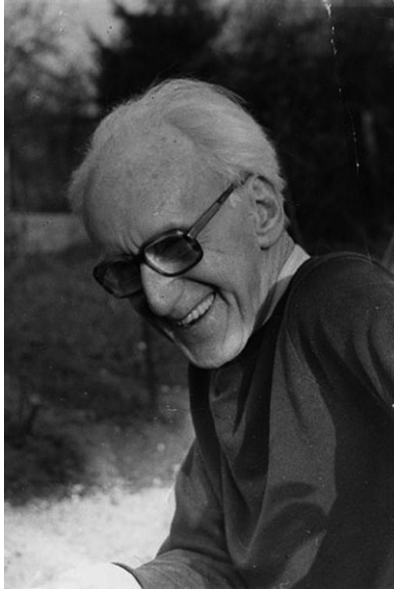
Slika 1. Józef Czapski u godinama nakon Drugoga svjetskog rata

kog prevrata. Pacifističko uvjerenje koje je proizlazilo iz Tolstojeve filozofije nesuprotstavljanja zlu, zamijenilo je odbijanje pasivnosti u situaciji sveobuhvatnog zla u obliku boljševizma. Sudjelovao je u poljsko-boljševičkom ratu 1919.–1920. godine, ističući se hrabrošću. Nakon rata upisao je u Krakovu Akademiju likovnih umjetnosti. Godine 1923. s prijateljima je osnovao grupu zvanu Pariški komitet ( Komitet Paryski ). Njegine su članove nazivali kapistima. U Parizu, prijestolnici svjetske umjetnosti, boravio je od 1924. do 1930. godine. Czapskog je fascinirala francuska književnost, uglavnom Proust. Kako bilježi njegov prijatelj i biograf Wojciech Karpiński, njegovo pariško slikarstvo nije dobro poznato jer je propalo tijekom Drugoga svjetskog rata. Poznavajući njegovo tadašnje stvaralaštvo, uspoređuje ga s ranim Matisseom ili čak njemačkim ekspresionistima. 1930. godine vratio se u Poljsku kao ugledna ličnost te je sve do 1939. godine aktivno sudjelovao u kulturnom životu. 15