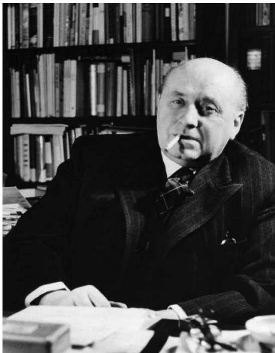
Slika 2. Gottfried Benn u svojoj radnoj sobi u studenom 1955. godine

pokazuje da su prve godine rata za Benna bile iznimno teške: s jedne strane zbog toga što je kao liječnik na bojišnici neposredno gledao sve ratne strahote, s druge strane zbog zabrane književnog djelovanja. Kada se vratio s rehabilitacije, Wehrmacht je već bio napao Sovjetski Savez. Tijekom 1941. i 1944. godine Bennov garnizon biva više puta premještan u Landsberg/Warthe, gdje je Benn ukupno proveo 17 mjeseci. Jednako kao za vrijeme boravka u Hannoveru, Benn osjeća tjeskobu provincije, ali unatoč tome u Landsbergu nastaju neka od njegovih kasnije značajnih djela. Zbog povlačenja njemačke vojske pred Crvenom armijom Benn 1945. napušta Landsberg i vraća se u Berlin, gdje će voljeni grad zateći u kaosu i ruševinama.